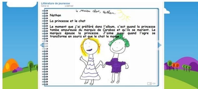
Figure 4 • Exemple de thématique pédagogique (rédigé par un élève)

sé un cahier multimédia musical pour recueillir des comptines d'autrefois fournies par des parents d'élèves et des grands parents et a ensuite organisé des rencontres musicales avec les parents et grands-parents volontaires pour chanter avec les élèves. Il s'agissait d'un projet intergénérationnel et collaboratif, où les élèves pouvaient apprendre et chanter ces comptines disparues, accompagnés par des aînés. L'ENT a été utilisé pour recueillir des notes musicales, le texte des comptines mais aussi des fichiers audio. Ces supports ont été rendus accessibles à tous les acteurs, enseignants, élèves, parents, en classe comme à la maison.