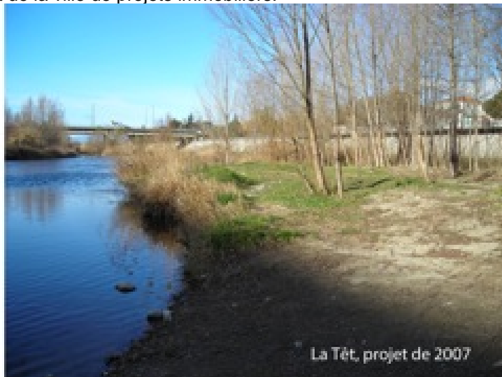
Figures 3a et 3b. Deux traitements paysagers de cours d'eau à Perpignan : traitement botanique et horticole de la Basse (canalisée en 1975) face au faible degré d'intervention sur la Têt (projet de 2007).

La représentation sociale alors positive de ces formes urbaines est fondée sur la valorisation d'une ingénierie de régulation. Un article de Florence Marot (1987) 1 témoigne de l'imaginaire de cette période. Elle y vante les mérites des techniques hydrauliques permettant une supériorité de l'homme sur une rivière personnifiée, prenant tantôt les traits d'une bête à dompter, tantôt d'une créature capricieuse à raisonner. Seules les interventions de l'homme, interventions géométriques et minérales, savamment scénographiées, viennent à bout de l'animal. Rien de ce qui fait la spécificité de l'élément naturel n'est alors convié au « spectacle urbain », les caprices de la rivière n'étant ainsi plus que souvenirs.