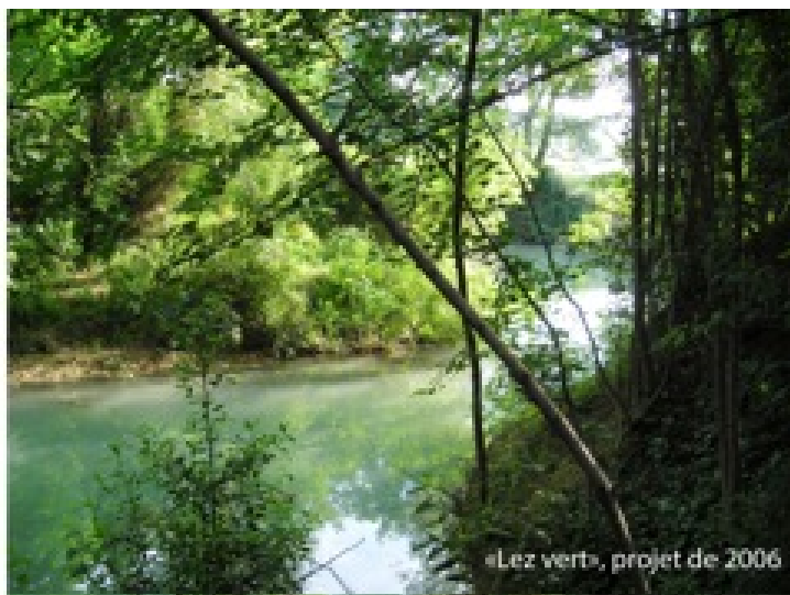
Figures 2a et 2b. Deux visions du fleuve dans la ville de Montpellier : le Lez urbain (projet de 1980), témoignage d'une époque célébrant la maîtrise humaine du fleuve et le Lez vert à Lavalette (projet de 2006), faisant la part belle aux ripisylves en place.

À Perpignan est cité l'aménagement en centre-ville du lit mineur de la Basse, affluent de la Têt : une canalisation également, et un cours d'eau rendu physiquement inaccessible, au profit de parterres floraux et engazonnés. La Têt, au contraire, séparant le centre historique de la partie nord de la ville, n'avait pas fait l'objet de « valorisation » botanique ou horticole. C'est la question du risque d'inondation qui a initialement dicté les formes de ces projets. La canalisation du Lez visait effectivement à réguler les débits du fleuve, afin de pouvoir notamment investir la rive est de la ville de projets immobiliers.