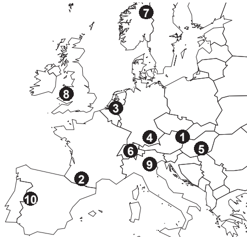
Abbildung 1: Untersuchungsregionen und Produktionsschwerpunkte: 1 Marchfeld und 2 Gascogne (Ackerbau), 3 Gelderland (Spezialkulturen), 4 Süd-Bayern und 5 Homokhatsag (Ackerbau mit Viehhaltung), 6 Obwalden, 7 Hedmark und 8 Wales (Viehhaltung), 9 Veneto (Weinbau) und 10 Extremadura (Oliven).

In den zehn untersuchten Regionen dominieren unterschiedliche Produktionsschwerpunkte (Abbildung 1). Die Bewirtschaftungsintensität in den Regionen ist im gesamteuropäischen Vergleich extensiv bis mittelintensiv. Die Regionen wurden so ausgewählt, dass keine systematischen Unterschiede in Lage oder Produktionsbedingungen zwischen biologischen und übrigen Betrieben vorhanden waren (Dennis et al. 2012).