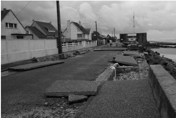
FIGURE 5 : DEGATS SUR LA DIGUE DE VER-SUR-MER SUITE A XYNTHIA

Ce projet de travaux, qui ne concerne que le tronçon géré par la commune, ne tient pas compte des tronçons situés de part et d'autre de la digue communale et participant à la protection de la même zone.