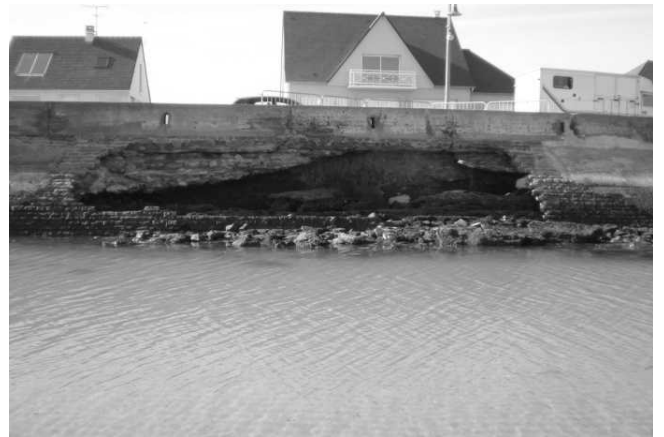
FIGURE 2 : DEVELOPPEMENT EXCESSIF D'UNE CAVITE DANS LA DIGUE D'ASNELLES - MAI 2011

Ces travaux, ont consisté en la recherche et le traitement des cavités, sous la voirie et sous le parapet. Les remblais décompactés ont été purgés, les cavités comblées par du béton. Sur plusieurs secteurs, la remise en sécurité du perré, affecté par des fractures profondes, a été effectuée par mise en place d'une voile en béton projeté sur un treillis ancré, tel qu'indiqué sur le schéma de principe Figure 4.