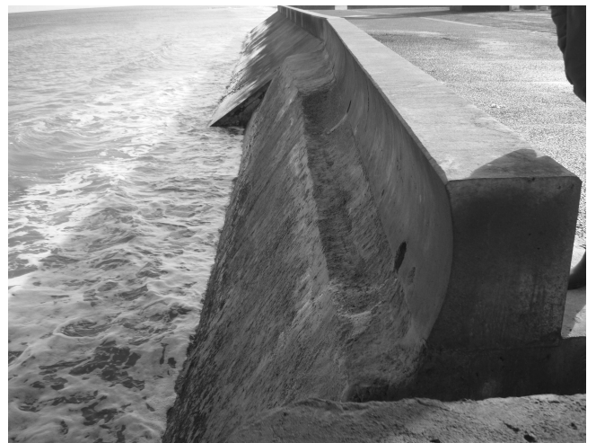
FIGURE 3 : RECONSTRUCTION DU PARAPET ET REPRISE DU PERRÉ DE LA DIGUE D'ASNELLES