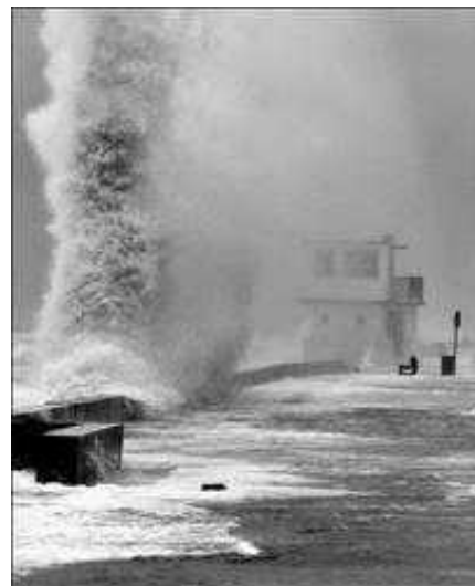
FIGURE 1 : DIGUE DE VER-SUR-MER LORS DE LA TEMPETE XYNTHIA

Les travaux urgents nécessaires ont incité les gestionnaires à mettre en œuvre des diagnostics, rendus obligatoires par le décret du 11 décembre 2007, et le classement des ouvrages au titre du décret n'a pas été un préalable, dans ces cas là, pour mener à bien ces études.