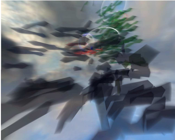
FIG. 1 : Design graphique de Plumage .

designers et chercheurs dans le cadre du projet Énigmes 2 piloté par Roland Cahen (ENSCI) et portant sur les « partitions navigables ». Il reprend des hypothèses et des recherches conduites dans le cadre du projet collaboratif Phase [4] sur l'utilisation d'un environnement virtuel 3D et d'un bras à retour d'effort pour parcourir un espace sonore interactif. Par partitions navigables, l'on entend ici des formes de notation ou de représentation musicale actives, avec lesquelles on peut directement jouer la musique. L'outil numérique permet de ne pas dissocier la partition de l'instrument et propose, par la notion de navigation sonore, de nouvelles approches de la composition/interprétation de la musique et du son.