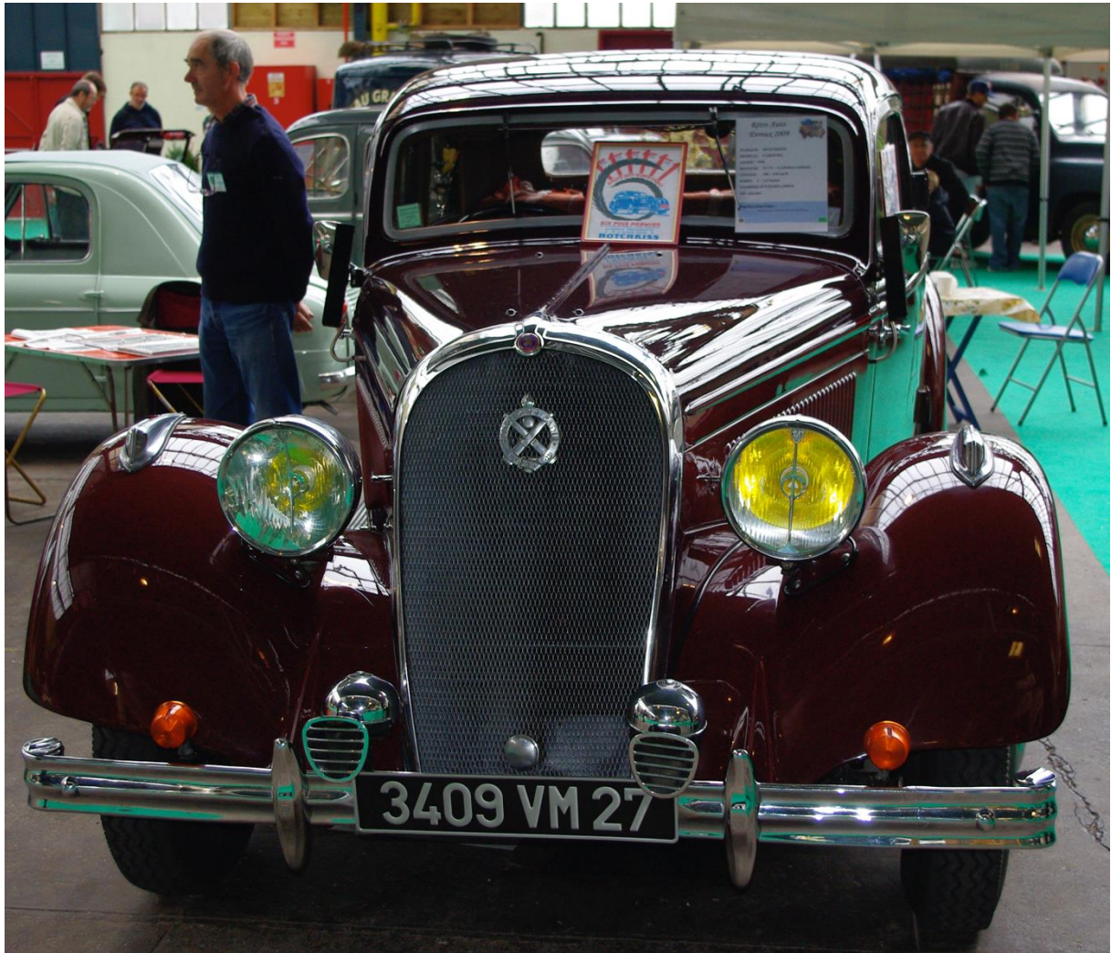
Hotchkiss Cabourg 1936 Évreux 24 octobre 2009