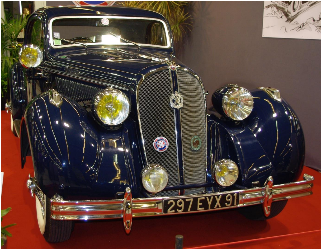
Hotchkiss Megève 1936 Rétromobile 2010