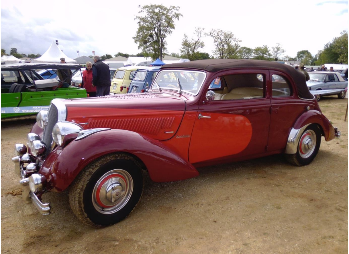
Hotchkiss Monte Carlo La Locomotion en Fête 24 mai 2014