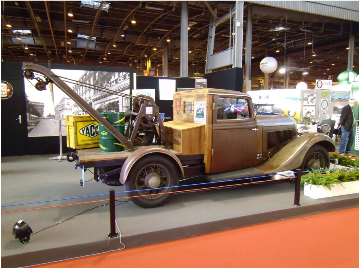
Hotchkiss 411 Dépanneuse 1934 Rétromobile 3 février 2016