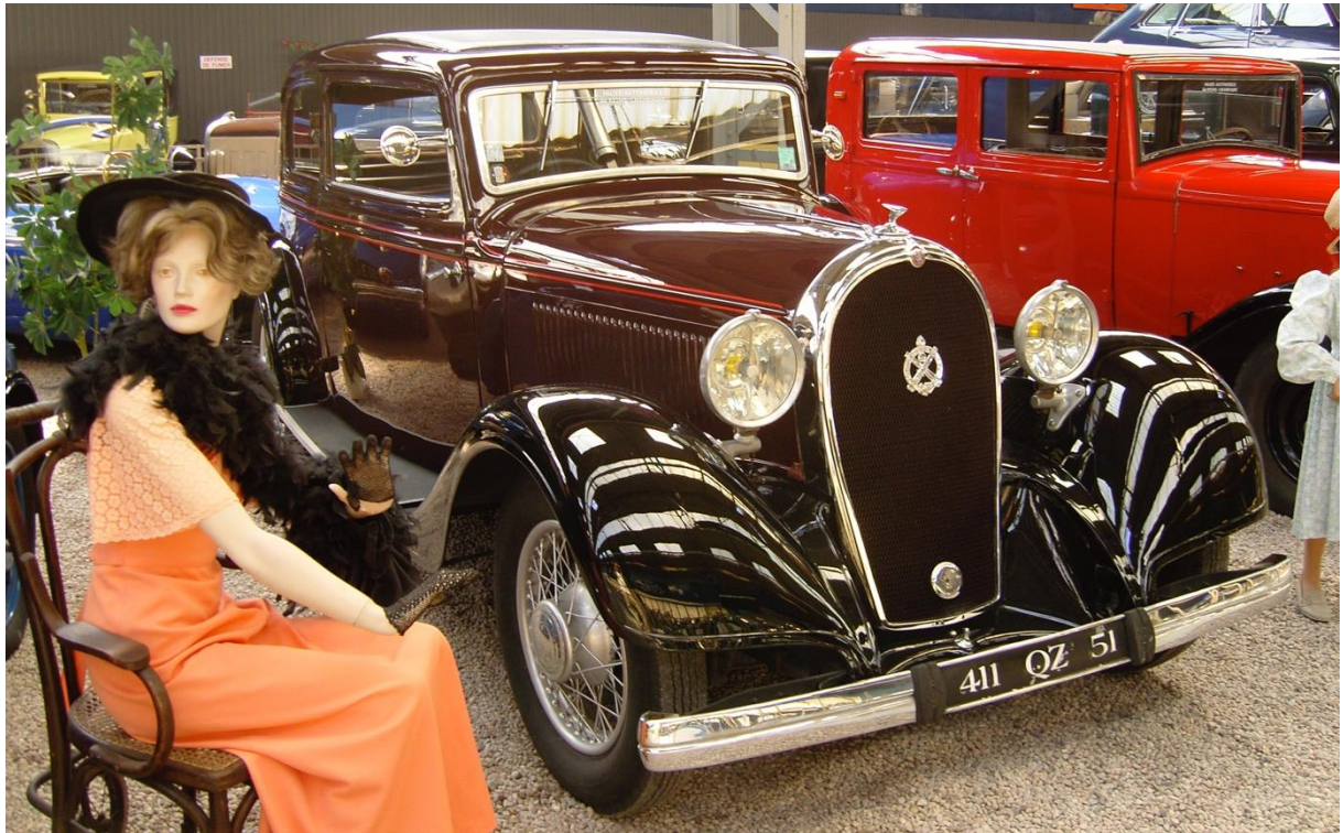
Hotchkiss 411 1934 Musée de Reims 10 mai 2008