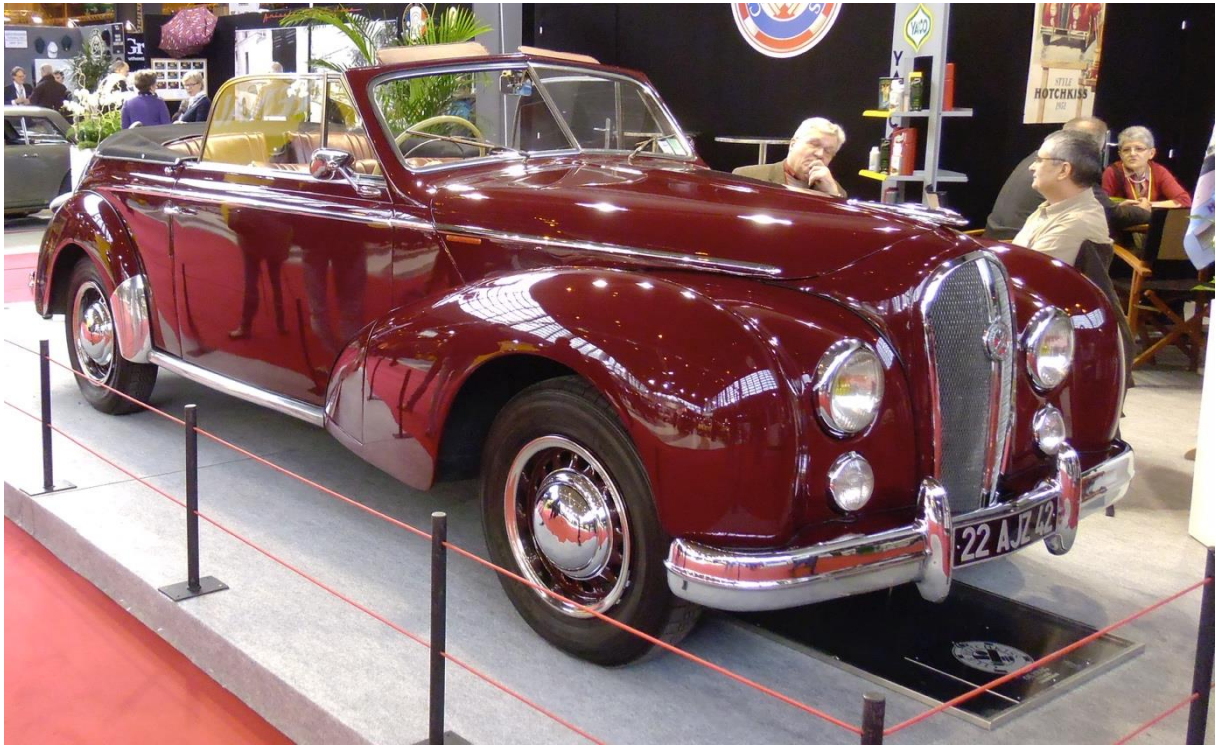
Hotchkiss Anthéor 1952 Rétromobile 2014