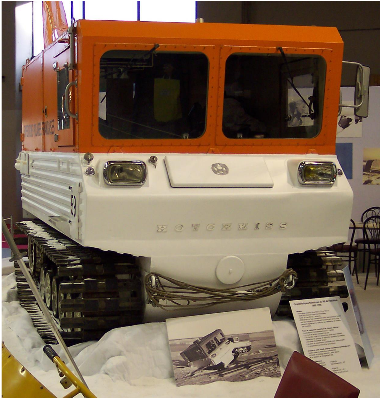
Hotchkiss chenillette Expéditions polaires françaises de Paul-Émile Victor, Salon Rétromobile le 16 février 2007