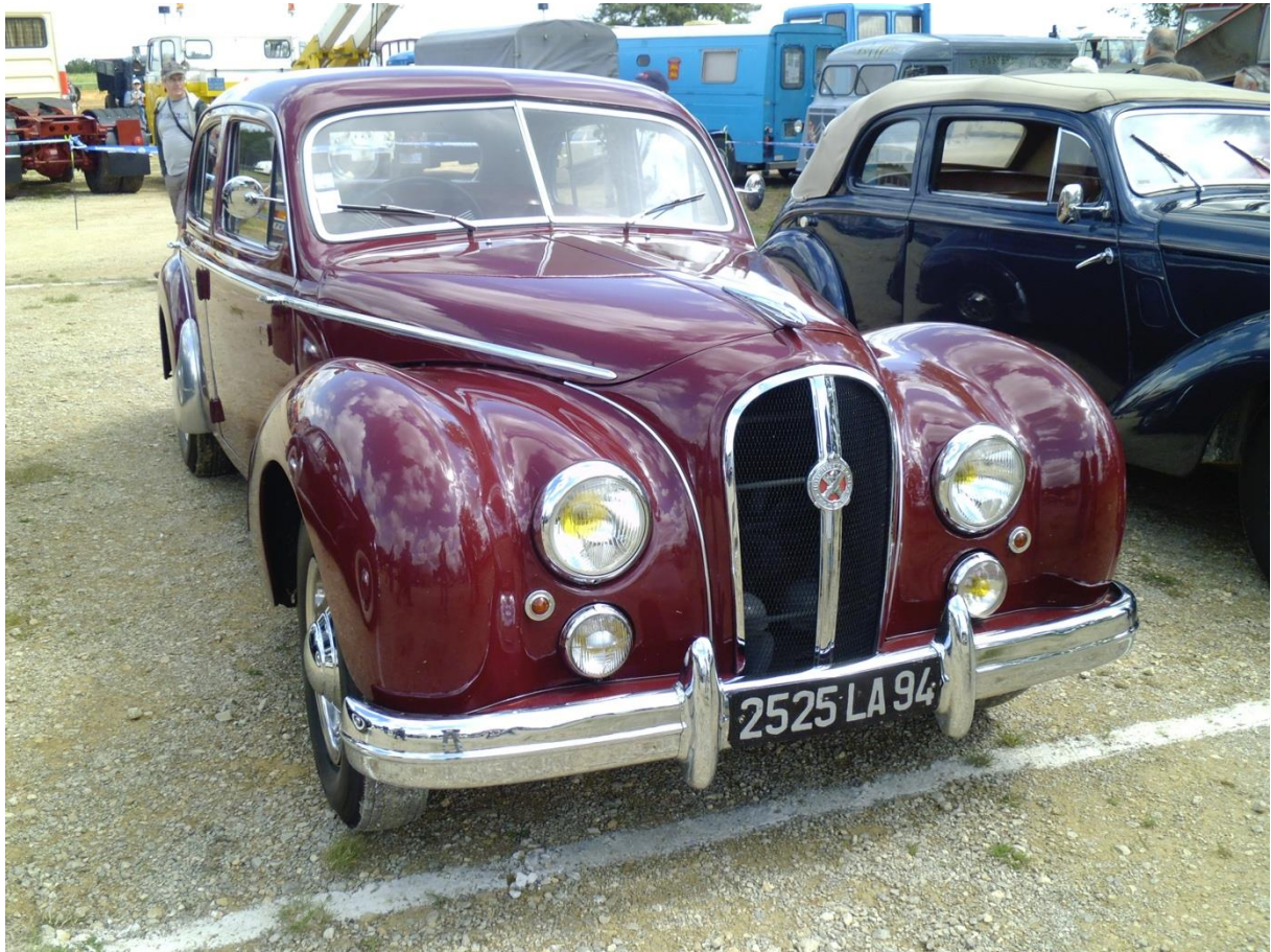
Hotchkiss Suspension Grégoire La Locomotion en Fête (La Ferté-Alais) 9 juin 2012