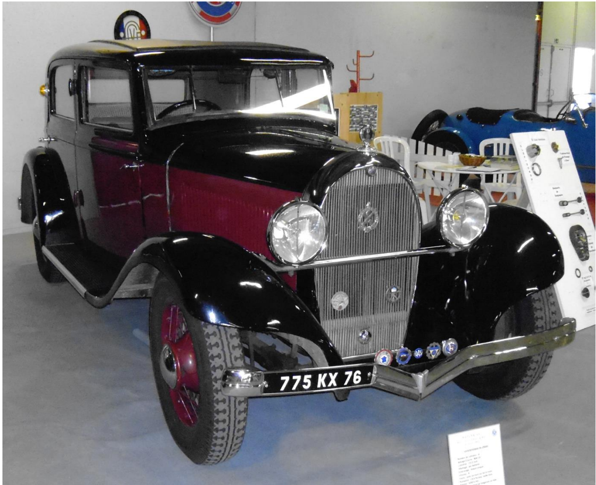
Hotchkiss Cabourg 1933 Rouen 22 septembre 2012.