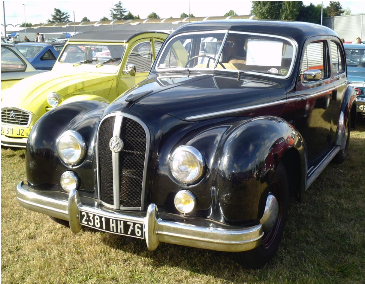
Hotchkiss Anjou 1952 Rouen 22 septembre 2012