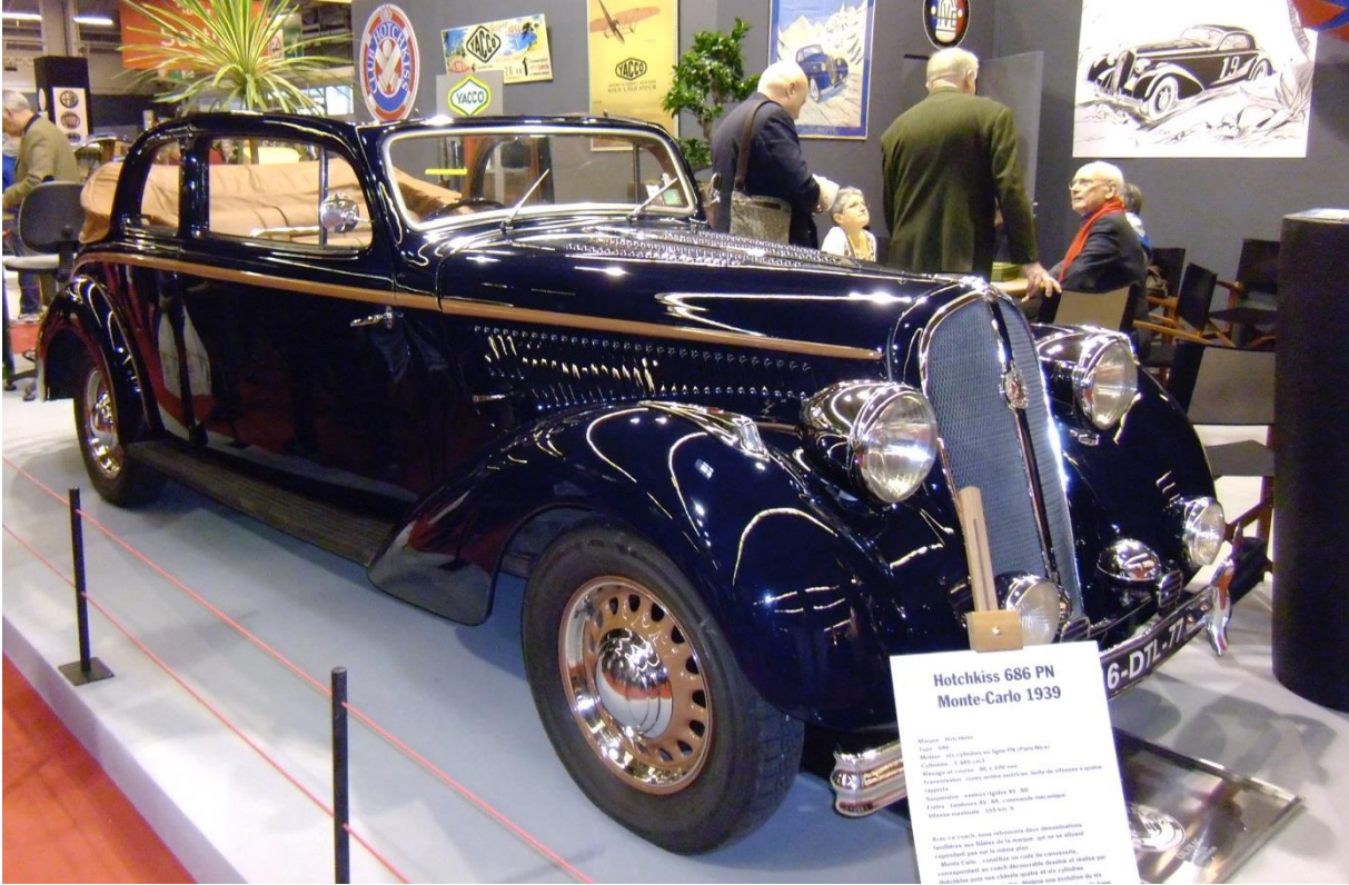
Hotchkiss Monte-Carlo 1939 Rétromobile 2013