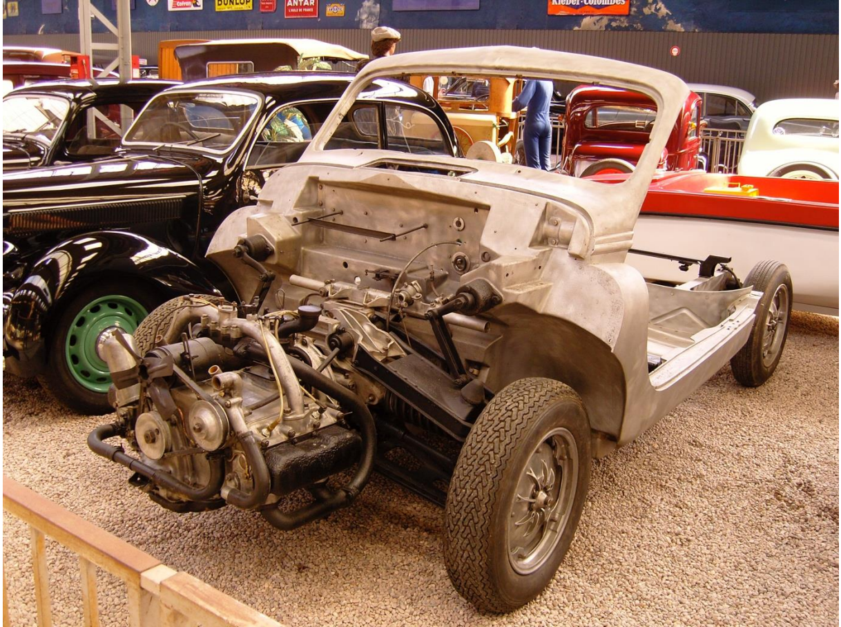
Hotchkiss-Grégoire JAG 1952 Musée de Reims 10 mai 2008