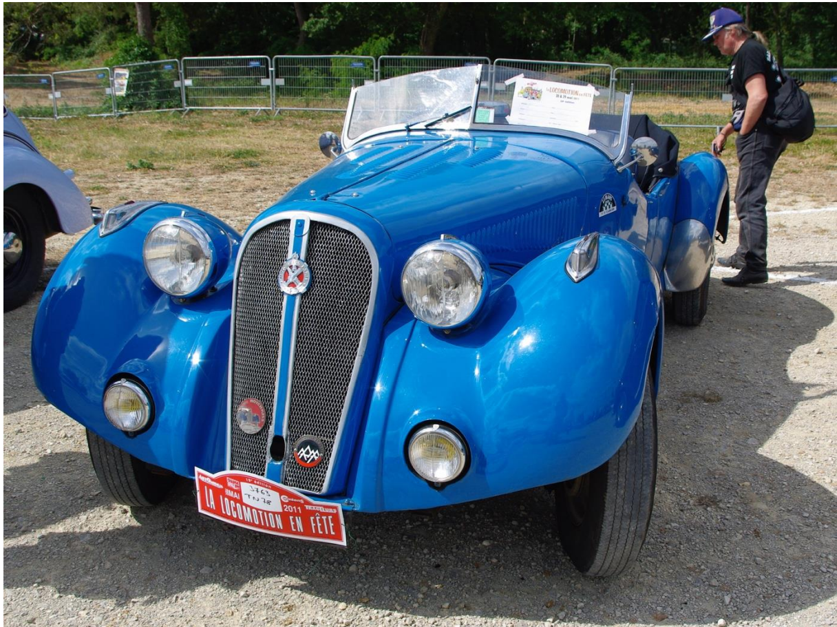
Hotchkiss Roadster 1938 Locomotion en Fête 28mai 2011