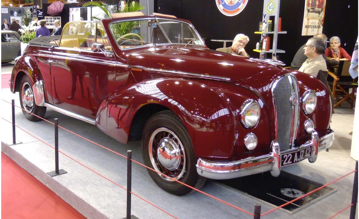
Hotchkiss Anthéor 1952 Rétromobile 2014