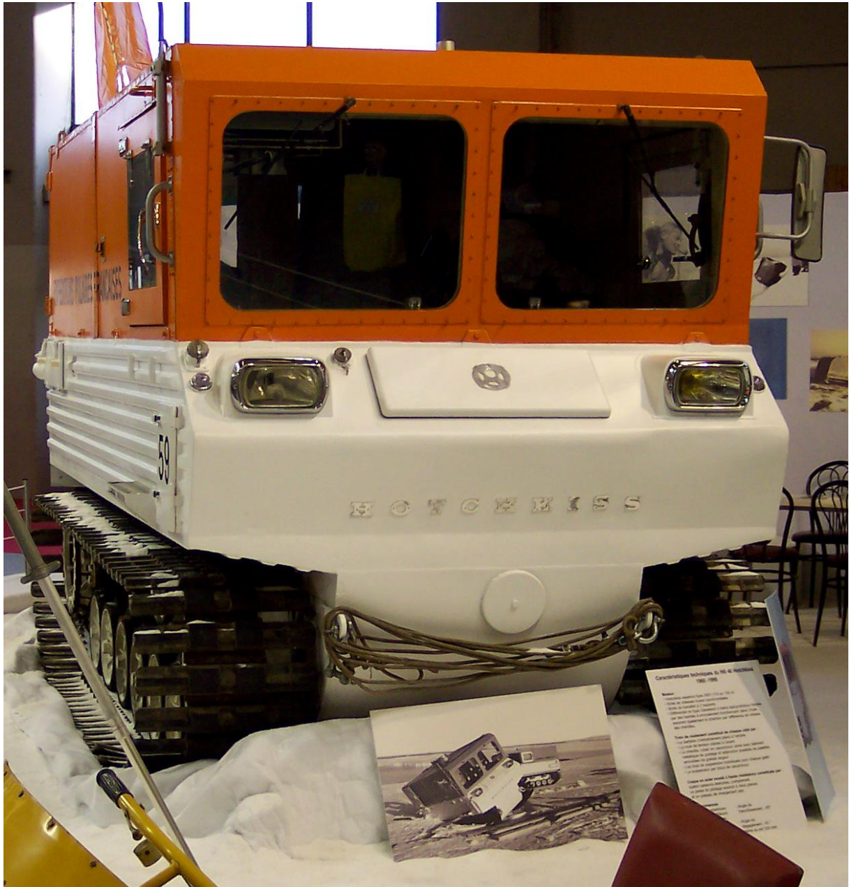
Hotchkiss chenillette Expéditions polaires françaises de Paul-Émile Victor, Salon Rétromobile le 16.02.2007