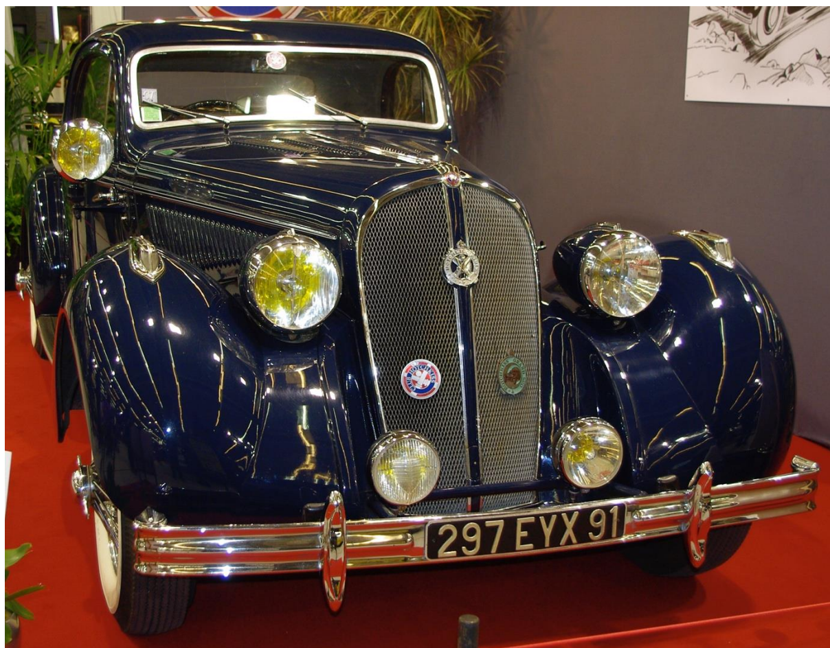
Hotchkiss Megève 1936 Rétromobile 2010