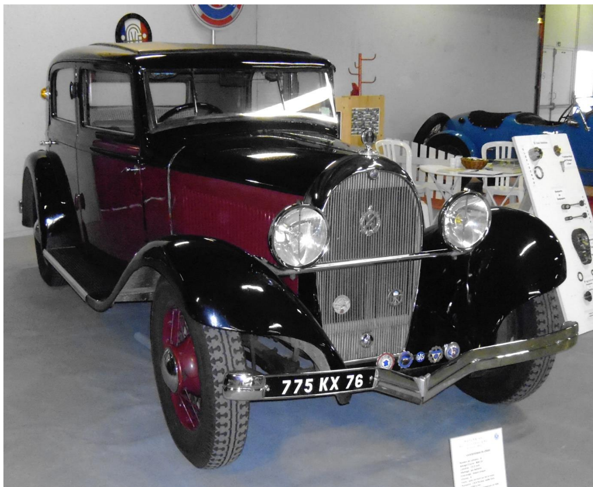
Hotchkiss Cabourg 1933 Rouen 22 septembre 2012.