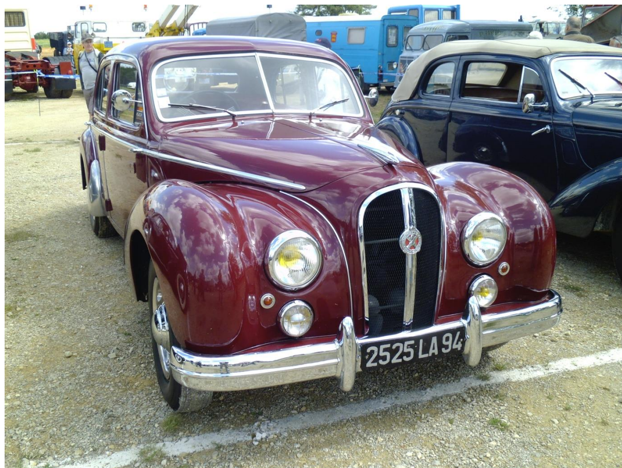
Hotchkiss Suspension Grégoire La Locomotion en Fête (La Ferté-Alais) 9 juin 2012