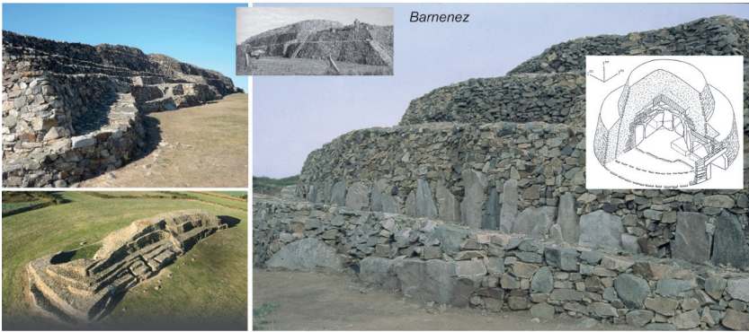
Figure 3 – Barnenez (Finistère), photographies du monument actuel et du chantier lors de sa restauration; vue isométrique d'un modèle de cairn à degrés (d'après L'Helgouac'h 1965).

En posant à part les ensembles restaurés depuis la fin du XIX e siècle jusqu'aux années 1930, qui conduisent le plus souvent en Bretagne à redresser des supports, à rapporter des dalles de couverture manquantes, à ramener les éboulis au centre de l'enveloppe originelle sans vraiment tenir compte des murs externes de limitation (travaux de Z. Le Rouzic, pour ne s'en tenir qu'à une figure emblématique en région carnacoise), il ne fait guère de doute que le cairn à chambres multiples de Barnenez (Finistère) est la figure archétypale du monument mégalithique telle que la communauté scientifique se la représente à partir du milieu des années 60 (fig. 3). Autrement dit le cairn à gradins ou à degrés. Il est difficile de dire qui, de P.-R. Giot ou de son élève J. L'Helgouac'h, est à l'origine de cette image convenue qui servira de modèle à tous les monuments restaurés à partir des années 1960, qu'il s'agisse de la Bretagne, de la Normandie, de l'Anjou, de la Vendée ou du Poitou (fig. 4). Il est en tout cas certain que, dans sa thèse, J. L'Helgouac'h énonce et figure de façon assez novatrice comment doit se constituer un cairn-type à enceinte, chaque mur concentrique délimitant une terrasse horizontale 45 (fig. 3; L'Helgouac'h 1965, p. 27 fig. 6), tandis que dans le même temps Barnenez est en cours de restauration.