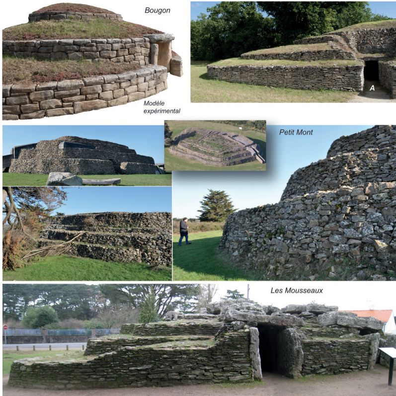
Figure 4 – Cairn à degrés des tombes à couloir restaurées de Bougon (Deux-Sèvres), Petit Mont (Morbihan) et Les Mousseaux (Loire-Atlantique).

Ce parti-pris provient certainement d'une reconnaissance assez tardive des archéologues de la France de l'Ouest relativement aux appareillages structurant le cairn ou le tumulus, non seulement au sein de la masse des pierres et sédiments accumulés autour de l'espace sépulcral, mais plus encore en façade et périphérie du monument ainsi constitué. C'est en effet tout le mérite de nos collègues œuvrant sous l'impulsion de P.-R. Giot d'avoir reconnu, défendu et revendiqué ces éléments d'architecture, juste entrevus dans le passé (notamment à l'Île Longue par Z. Le Rouzic). Mais on peine en revanche à comprendre les arguments qui vont conduire à l'image du cairn à gradins que nous connaissons désormais et qui semble s'imposer sans discussion.