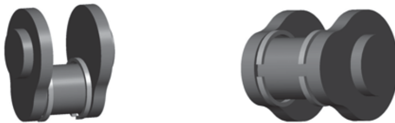
Figure 2. Chauffage par induction d'un vilebrequin muni de deux inducteurs.

La figure 2 présente le système industriel composé de deux inducteurs monospires autour de la partie utile d'un vilebrequin. Les inducteurs sont alimentés en courant par un générateur, ce qui implique une ouverture de la boucle formée par chacun d'eux.