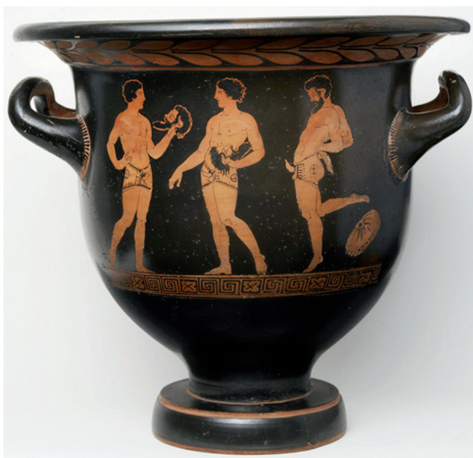
Fig. 7 : Cratère en cloche à figures rouges, 410-380 avant J.-C., attribué au peintre Tarporley, provenant d'Apulie. Ht. 33 x diam. 36 cm. Sydney University Museums, Nicholson Museum Collection, inv. NM 47.5.

Mais les deux satyres du vase de Pronomos se rapprochent également du reste de la troupe par le fait qu'ils tiennent tous les deux leur masque, à l'instar de leurs compagnons, à l'exception d'un seul (n° 18). Les uns laissent pendre leur accessoire (n° 2, 17, 23, 24, 26), tandis que les