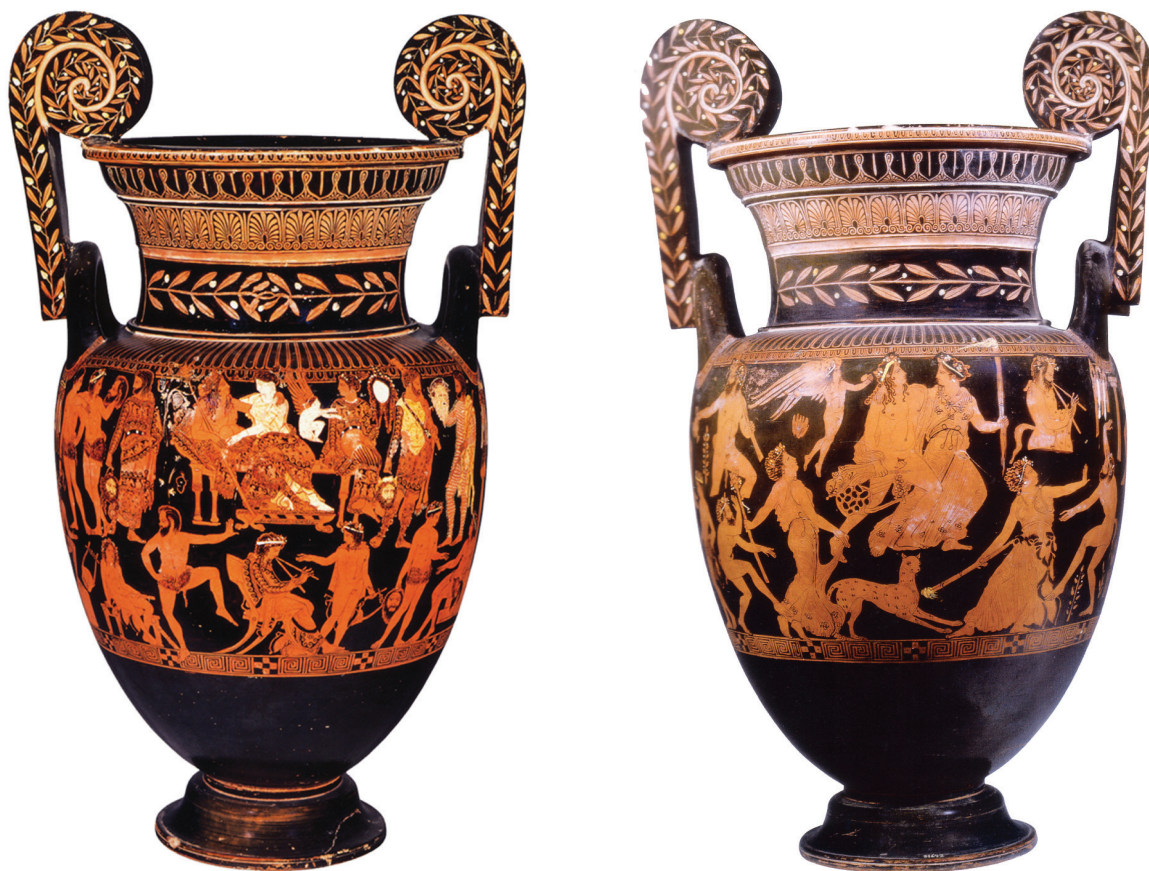
Fig. 1 (à gauche) : Cratère de Pronomos, face A. Naples, Museo archeologico nazionale, inv. 81673.