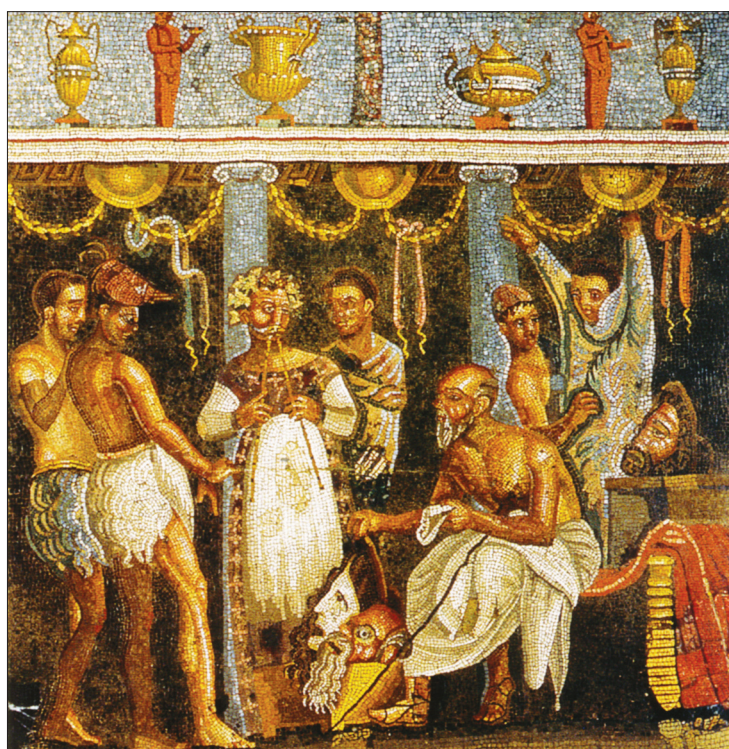
Fig. 10 : Pompéi, mosaïque de la maison du Poète Tragique (VI, 8, 3-5), emblemata du tablinum 8. Naples, Museo archeologico nazionale, inv. 9986. Sur concession du Ministero per i beni e le attività culturali – Soprintendenza speciale per i beni archeologici di Napoli e Pompei.

De fait, si l'on regarde attentivement la scène, l'identification de la représentation d'un drame satyrique ne va pas de soi. En effet, ce sont les costumes des deux personnages de gauche et de celui de droite qui ont fait penser à la culotte velue des satyres et à la combinaison poilue d'un Papposilène. En ce qui concerne les satyres, dont l'un porte également sur la poitrine une sorte de maillot de corps couleur chair, leur position