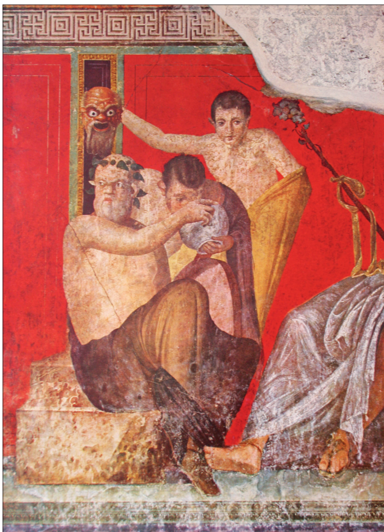
Fig. 9 : Pompéi, villa des Mystères, oecus 5, détail du mur ouest, in situ .

de la sphère mythique. En outre, s'il l'on admet le principe de l'analogie entre les deux prosôpa , le masque de silène est à rapporter à son modèle, Silène, et non au satyre. La sphère humaine n'apparaît pas sur cette image : la sphère divine est rendue accessible au monde humain par le biais du théâtre, représenté par le masque, et par celui du vin, signifié par le vase que le silène présente au second satyre.