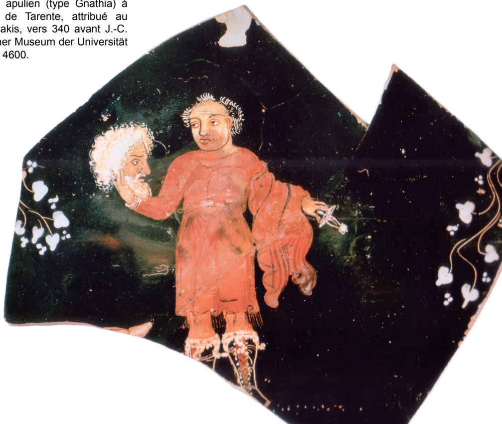
Fig. 4 : Cratère apulien (type Gnathia) à figures rouges, de Tarente, attribué au groupe de Konnakis, vers 340 avant J.-C. Martin von Wagner Museum der Universität Würzburg, inv. H 4600.