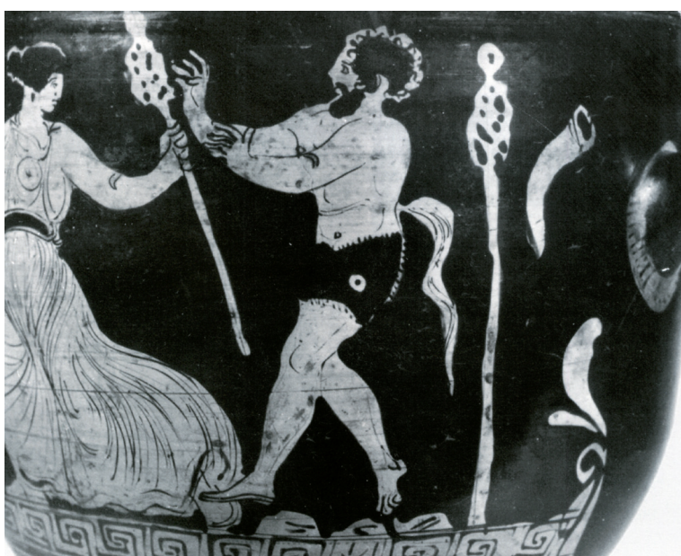
Fig. 8 : Cratère en cloche à figures rouges, 360 avant J.-C., attribué au peintre d'Iris, provenant d'Apulie. Ht. 33,2 x diam. 33 cm. Moscou, Pushkin State Museum of Fine Arts, Il 1b 1423 (CVA Russie 2, pl. 3).