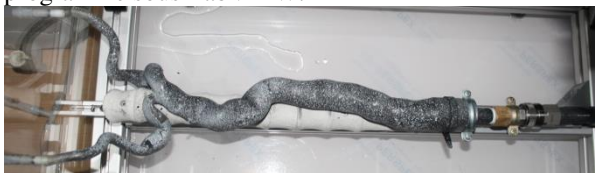
Figure 1 : Fant me d'aorte abdominale fix  sur la colonne vert brale imprim e en 3D et reli  au circuit

Notre montage exp rimental (Fig. 1) comporte un syst me hydraulique avec une pompe fonctionnant en continu; une  lectrovanne g re les cycles en reproduisant un flux cardiaque. Ce circuit est reli    une cuve d'eau, pouvant accueillir un fant me d'aorte abdominale con u   partir de donn es m dicales d'un patient pr sentant un an vrisme. Afin de se rapprocher au mieux d'un comportement r aliste ce fant me est li   lastiquement   une colonne vert brale imprim e en 3D. La cuve est surplomb e d'un m canisme motoris  recevant un syst me de cam ras et une sonde  chographique, permettant de suivre les d formations du fant me pendant les cycles du circuit. Le pilotage de l'exp rience est r alis    l'aide d'un programme d di  programm  sous LabVIEW.