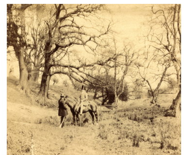
Fig. 2. Épreuve albuminée de William Morris Grundy, pour illustrer le poème d'Alexander