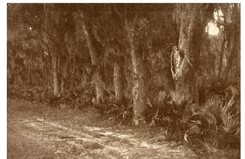
Fig. 16. « Of the dim sweet woods, of the dear dark woods / Of the heavenly woods and glades, » photographie de Henry Troth reproduite en similitravure bistre dans Sidney Lanier, Hymns of the Marshes , Charles Scribner's Sons, New York, 1907, en hors-texte après la p. 47.