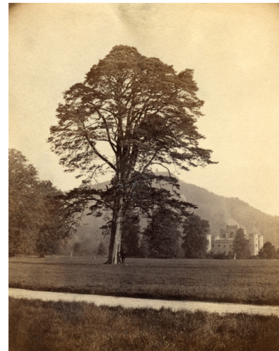
Fig. 5. Épreuve albuminée anonyme contrecollée pour illustrer le poème « A Forest King » de Jessie Saxby