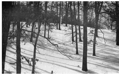
Fig. 11. Anonyme, sans titre, reproduite en photogravure pour illustrer le poème « The Shadows of the Trees »

Of beauty's solace in the troubled heart. » [22]