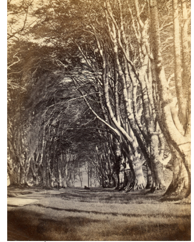
Fig. 3. Épreuve albuminée anonyme pour illustrer le poème « Springtime in the Woods » de Jessie Saxby

« Mystical life of the wonderful wood ! Breathe on the heart of this sorrowful mood, Spread all around me your bountiful arms, Fold me awhile in your soft emerald charms [...] I brought to your arbours a burden of care, And kindly tones told me to lay it down there. [...] Leave only the knowledge of friendship I found [...] The fragment of rainbow from tempest-time rude— And take all the burden, O wonderful wood ! »[9]