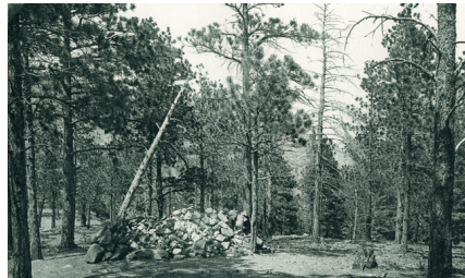
Fig. 8. W.H. Sanford, photographie pour illustrer le poème d'Ernest Whitney, « The Mourners on Cheyenne »

américain et transcendantal, Pictures and Poems of the Pike's Peak Region, Pictures by W.H. Sanford, Poems by Ernest Whitney (1891), une photographie montrant des arbres vivants et morts, droits et penchés, compose une illustration adéquate au poème « The Mourners on Cheyenne » [17] , qui décrit les quatre saisons en quatre strophes. Avec un peu de bonne volonté de la part du lecteur, chaque saison peut être observée dans tel ou tel arbre. La « foule en deuil », les « pleureurs » du titre, sont représentés par les arbres autour d'un tombeau (« At the Grave of H. H. », dit le sous-titre), mais le Printemps donne le dernier mot : « Immortality ! ». Ainsi, comme souvent, l'arbre demeure le symbole du temps, de la résistance au temps, puis de la consolation.