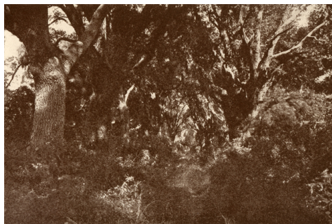
Fig. 15. « Glooms of the live-oaks, beautiful braided and woven / With intricate shades of the vines that myriad-cloven / Clamber the forks of the multiform boughs,— », photographie de Henry Troth dans Sidney Lanier, Hymns of the Marshes , en hors-texte après la p. 45.

« Glooms of the live-oaks, beautiful-braided and woven With intricate shades of the vines that myriad-cloven Clamber the forks of the multiform boughs [...] Wrought of the leaves to allure to the whisper of vows, When lovers pace timidly down through the green colonnades Of the dim sweet woods, of the dear dark woods, Of the heavenly woods and glades [...] Chamber from chamber parted with wavering arras of leaves,— Cells for the passionate pleasure of prayer to the soul that grieves, Pure with a sense of the passing of saints through the wood, Cool for the dutiful weighing of ill with good [...] Like a lane into heaven that leads from a dream,— Ay, now, when my soul all day hath drunken the soul of the oak, And my heart is at ease from men, and the wearisome sound of the stroke Of the scythe of time [...] And belief overmasters doubt, and I know that I know [...] Oh, now, unafraid, I am fain to face The vast sweet visage of space. » [25]