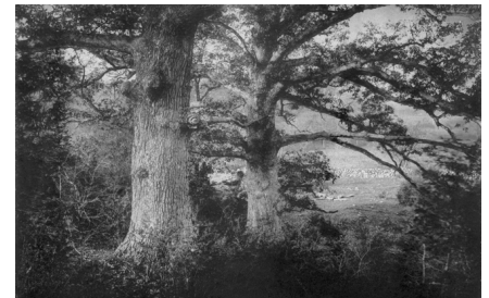
Fig. 6. « The Oaks, Waverley », photographie de William James Stillman (1828-1901) pour illustrer le poème de James Russell Lowell « The Oaks »

Le transcendantalisme de Lowell transparait à tout propos, car le monde physique est pour lui un monde d'idées et de formes néoplatoniciennes sous-jacentes : appeler une « Pléiade » [16] les sept