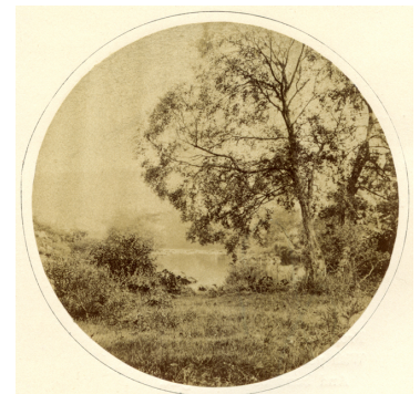
Fig. 1. Épreuve albuminée de William Morris Grundy, pour illustrer le poème de James Montgomery, « A Landscape »[5]

« The groves of Eden, vanish'd now so long, Live in description, and look green in song [...] Here hills and vales, the woodland and the plain, Here earth and water seem to strive again ; Not chaos-like together, crush'd and bruised, But, as the world, harmoniously confused ; Where order in variety we see, And where, though all things differ, all agree. Here waving groves a chequer'd scene display,