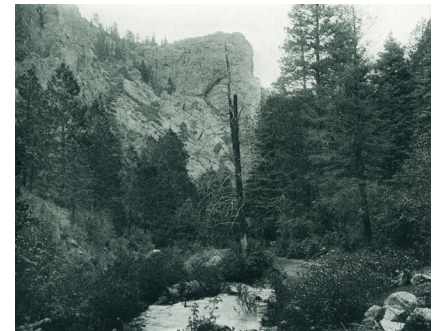
Fig. 9. W.H. Sanford, photographie pour illustrer le poème d'Ernest Whitney, « In North Cheyenne Canon »