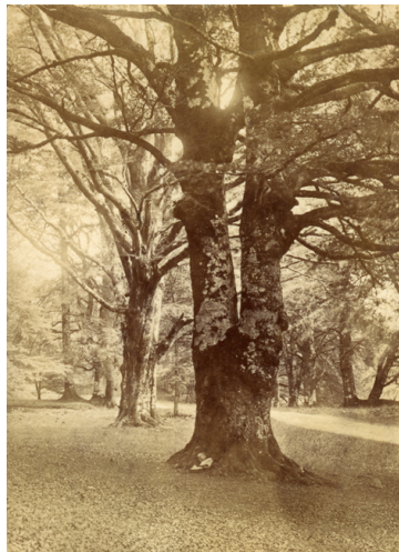
Fig. 4. Épreuve albuminée anonyme contrecollée pour illustrer le poème « The Marriage Tree » de Jessie Saxby

La consolation heureuse n'est pas la seule émotion du recueil. Un arbre fourchu a été choisi comme illustration pour la série de poèmes intitulée « The Marriage Tree »[10], car l'union de deux troncs symbolise le mariage, selon le petit texte d'introduction. Les histoires de cette section sont racontées par le hibou qui a tout vu et tout entendu, les couples fidèles et les adultères, les flirts et les deuils, car tous ont gravé leurs initiales sur l'écorce en cherchant à unir leurs âmes et leurs promesses à l'immortalité de l'arbre.