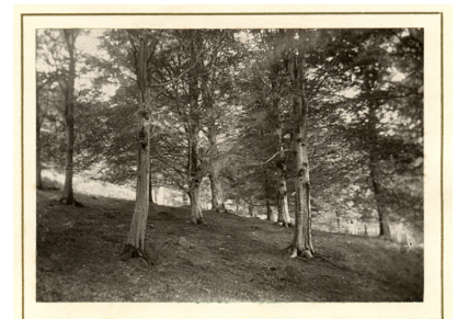
Shadows of the silver birk Sweep the green that folds thy grave.