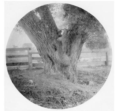
Fig. 7. « Under the Willows », photographie de W. J. Stillman pour illustrer le poème de J. Russell Lowell.

Like Beauty and Strength, from their slumbers arising refreshed, for their love and embracing,