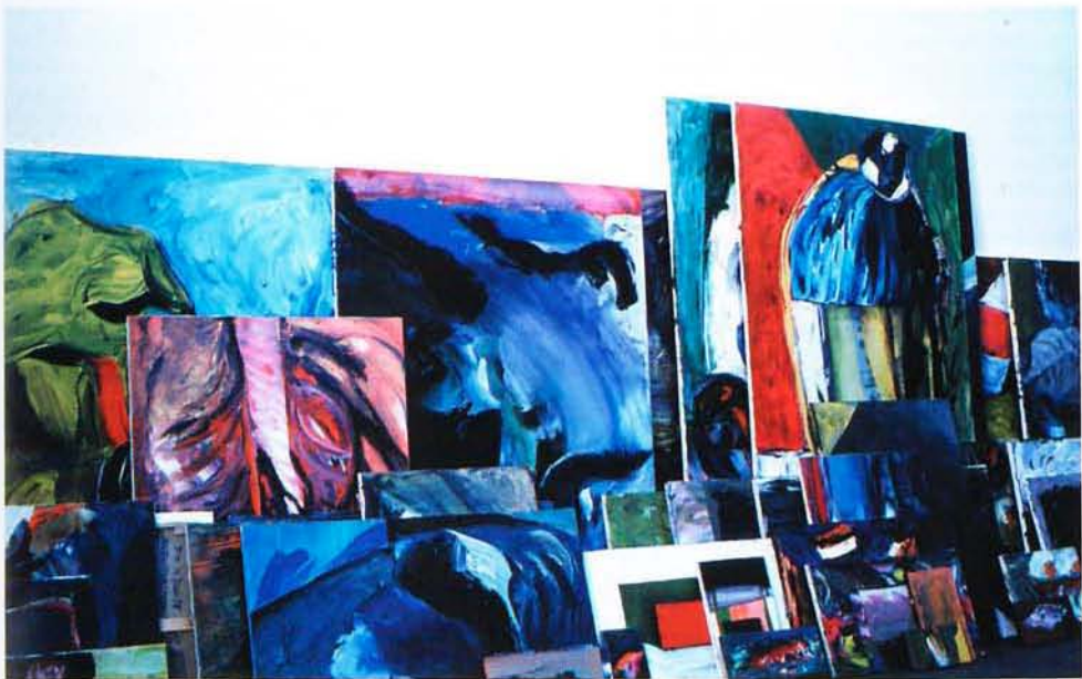
Richard Conte Installation, 64 matchs / 64 toiles, 2001