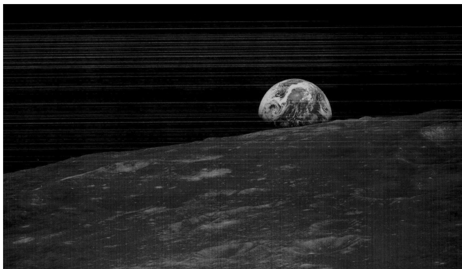
Fig. 1 : Cette photo est la première qui a été prise de la Terre depuis la Lune avec un film noir et blanc. Ce seront les images couleur prises peu après qui deviendront iconiques. La position de la Terre par rapport à la Lune pour inhabituelle qu'elle soit correspond à l'orbite du vaisseau qui était située dans le plan équatorial lunaire.