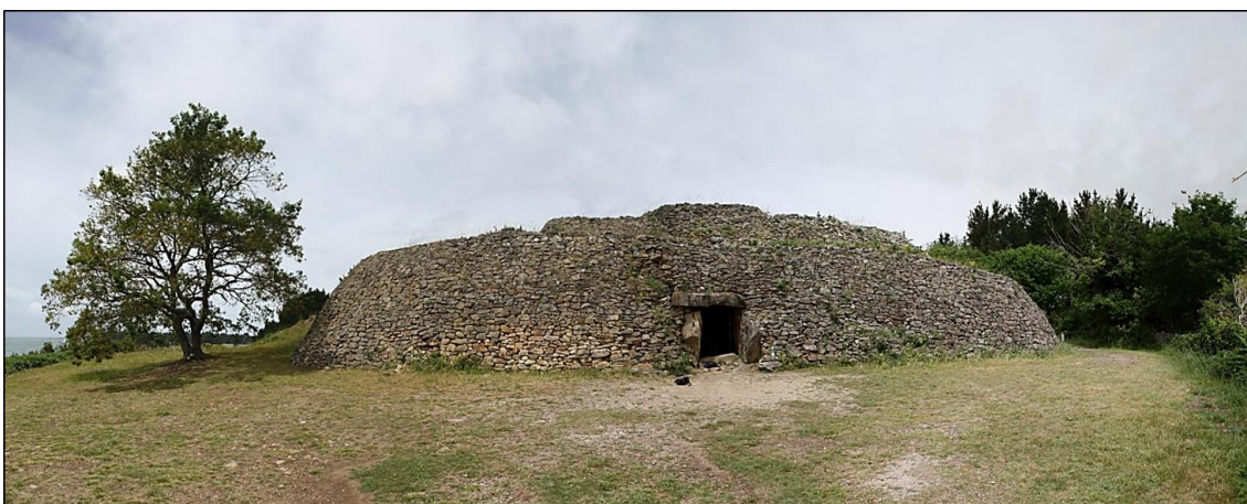
Le cairn de Gavrinis, vue de la façade.

C'est au croisement de ces enjeux que se déploie le projet présenté pour le site de Gavrinis, tombe néolithique, en Bretagne. En travaillant sur les durées longues, sur de l'archéologie, nous cherchons des positionnements sur ces couches hiérarchiques à inerties variables. Comment concilier, pour un même site, un même sujet, une production scientifique dont une pointe émergente serait assimilable à de l'art, la rendant pour le coup marchande, avec une volonté de préservation et d'enracinement profond dans le terreau de la culture et comment faire en sorte que la gouvernance articule cette mécanique.