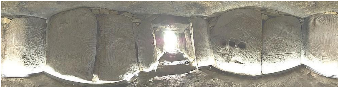
Gavrinis, stèles de la chambre.