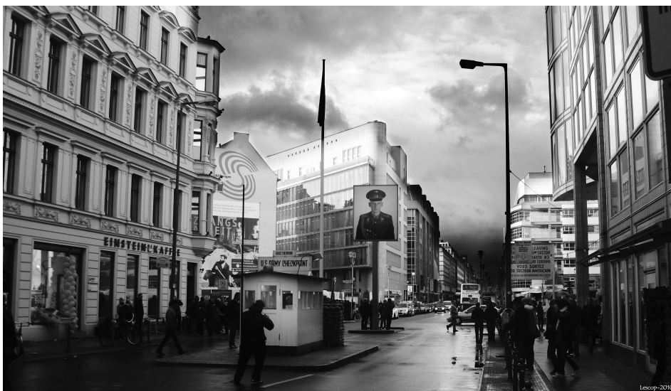
Mes funérailles à Berlin, Guy Hamilton.

Un grillage s'étire à l'infini. Impossible de savoir précisément où nous sommes, ici semble pareil à là-bas, l'ensemble se perd dans l'indifférence et l'indifférencié. Un jour de 1961, un couple se précipite sur les fils métalliques qu'un passeur vient de couper. Les Vopos 1 tardent à réagir, la femme plonge mais s'accroche violemment aux barbelés, sa tête bascule en arrière, elle perd l'équilibre. Son compagnon la rattrape, ils sont passés. Longtemps ensuite, ce point auparavant indifférencié, sera le sujet de toutes les attentions, de tous les espoirs.