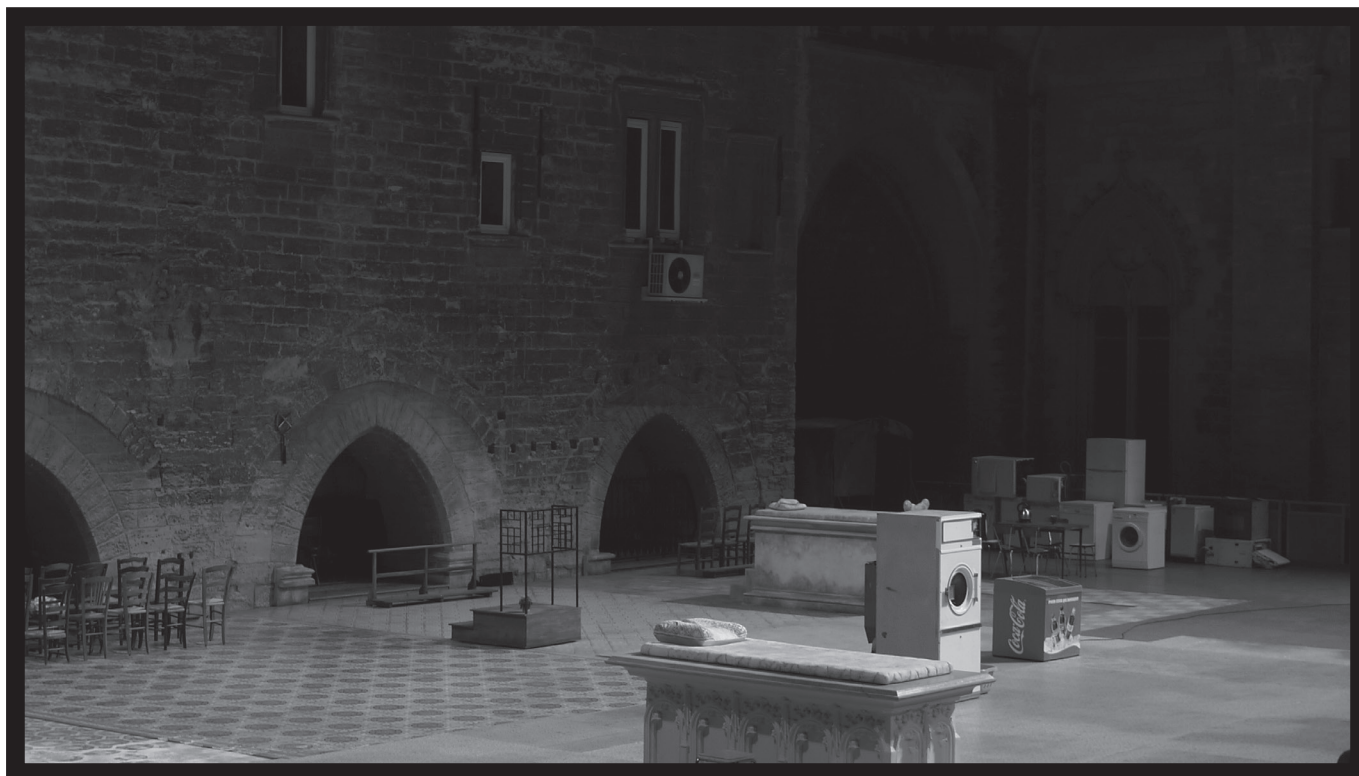
Paperlapapp , mise en scène Christoph Marthaler, cour d'honneur du Palais des Papes, Avignon In 2010