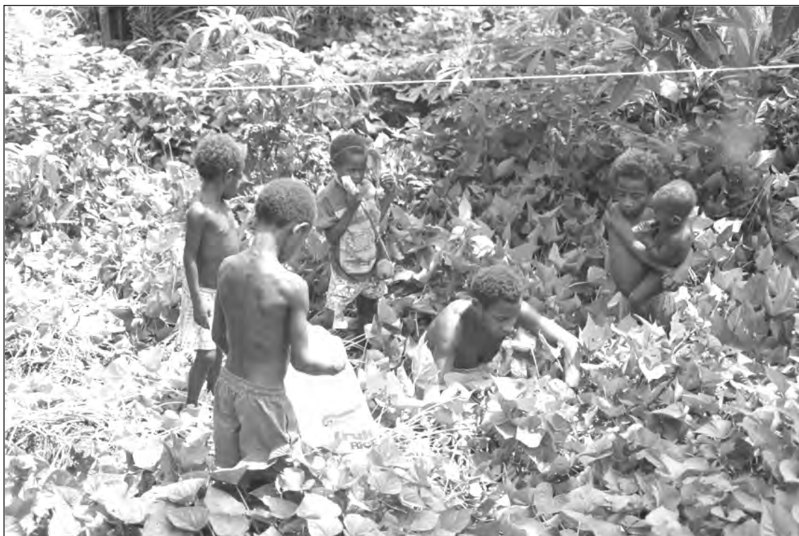
Krisa - PNG - 1998

Malgré les imprécisions des recensements nationaux dont nous disposons, on peut actuellement estimer l'effectif total des populations vivant directement de l'écosystème forestier à environ 12 millions de personnes (Bahuchet et Grenand 1994).