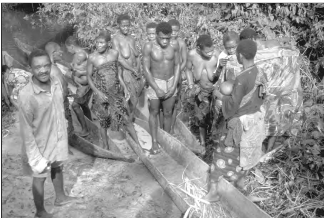
Région de Ouesso - Congo Brazza - 1996 - (cliché E.Thuret)

Malgré les imprécisions des recensements nationaux dont nous disposons, on peut actuellement estimer l'effectif total des populations vivant directement de l'écosystème forestier à environ 12 millions de personnes (Bahuchet et Grenand 1994).