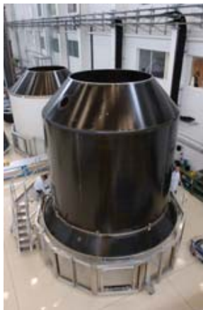
Figure 1. Structure SYLDA

L'accent a été porté dans un premier temps sur les transmissions solidiennes. La convergence de ces deux méthodes à hautes fréquences a été vérifiée. Les travaux futurs incluront le développement d'une méthodologie de calcul des transferts structures fluide en moyennes fréquences.