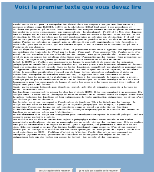
fig 3 : Ecran de lecture de texte proposé.

contiendra la dernière version de son texte. Enfin, les deux dernières colonnes lui fournissent, respectivement, la valeur de proximité sémantique entre son résumé et le texte correspondant, renvoyée par LSA, et enfin la comparaison entre cette dernière valeur et l'avis de l'élève concernant sa propre compréhension (p. ex., « Vous pensez avoir compris le texte et votre résumé le prouve »).