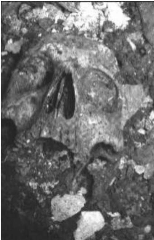
Figure 2: Dans un sarcophage, même très ancien, les restes ou des traces d'ossements peuvent être mêlés à la matière calcaire du sarcophage.

-Comprendre les circonstances de la mort de Clovis