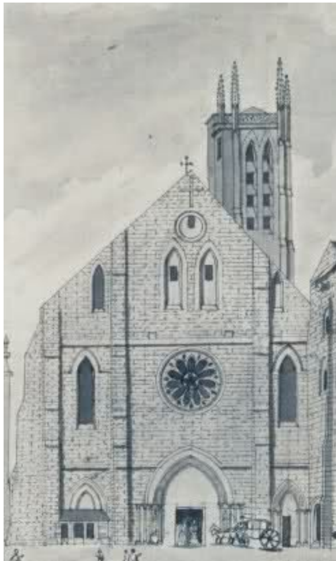
Figure1: Eglise Sainte-Geneviève de Paris Actuellement Rue Clovis

Une notice de ces fouilles est alors publiée afin de tenir informé le Gouvernement en place à cette époque, cette notice répertorie essentiellement un descriptif complet des recherches et des découvertes effectuées. Cette étude permet également d'obtenir un bon aperçu des tombes qui étaient alors enfouies au plus profond de l'église.