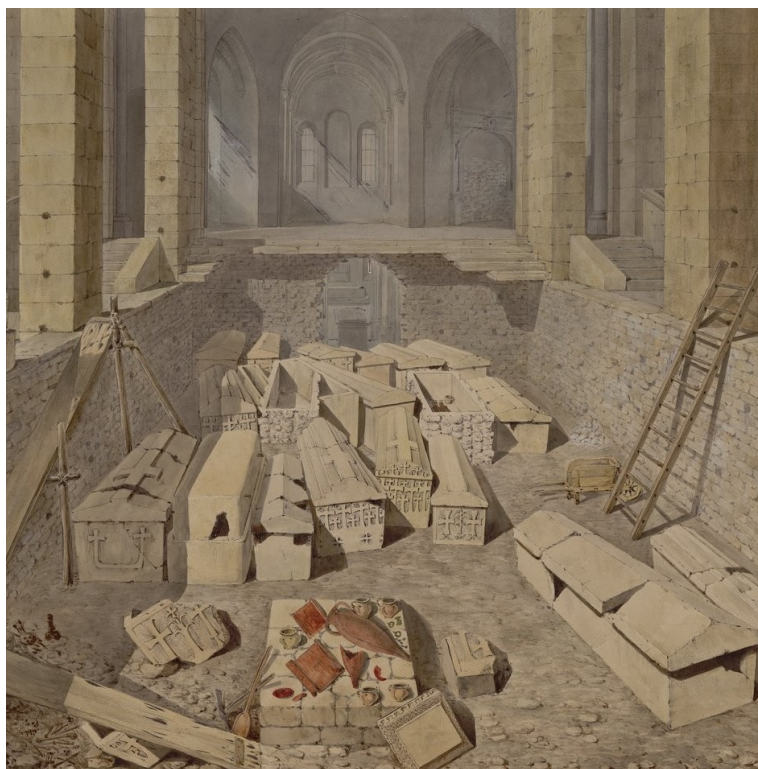
Figure 4 : Fouilles de 1807. Dessin de A. Bourla

Une bague d'or qu'Alexandre Lenoir dans cette notice qualifie de petite et qui aurait échappé à la recherche des Normands est retrouvée. Outre ce qualificatif de « petite » et la matière dans laquelle elle fut fabriquée : l'or, aucune description claire quant à sa forme ou son usage ne transparaît.