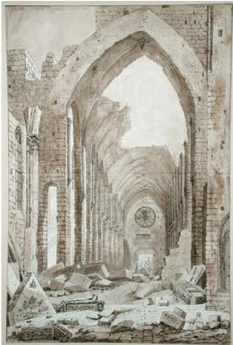
Figure 7 :Démolition de l'ancienne église Sainte-Geneviève à Paris en 1807, Denise Duchateau-Destours Musée Carnavalet - Histoire de Paris