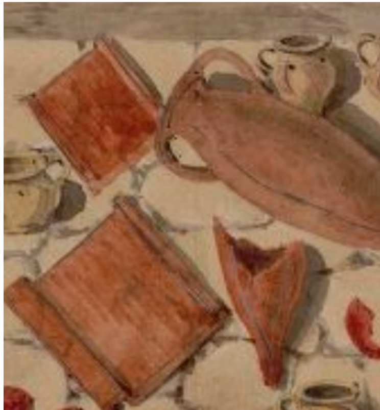
Figure 3 : Poteries et autres artefacts retrouvés lors des fouilles de 1807

D'autres poteries Gallo-Romaines principalement retrouvées dans les tombes en plâtre et que l'on nommera poteries funèbres servant à recevoir du charbon allumé sur lequel était répandu de l'encens lors des funérailles. Quelques-unes étaient couvertes d'un morceau de tuile afin de ne laisser échapper que faiblement l'encens qui sortait par des trous fait sur le galbe du pot.