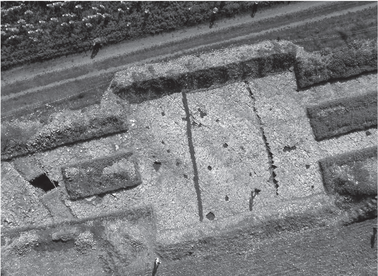
Fig. 2 – Chenommet, Bellevue (Charente) : photographie des structures mises au jour à l'intérieur de l'enceinte près du fossé interne F. I, après les avoir rebouchées de terre noire en fin de fouille.

Les structures internes se répartissent sur une bande d'une cinquantaine de mètres, au-delà d'une bande vierge de 9 m le long du fossé interne F. I (fig. 2). Il s'agit pour la majorité d'entre elles de trous de poteau (33 au total), très érodés (moins de 20 cm de profondeur), dont les calages ont généralement disparu.