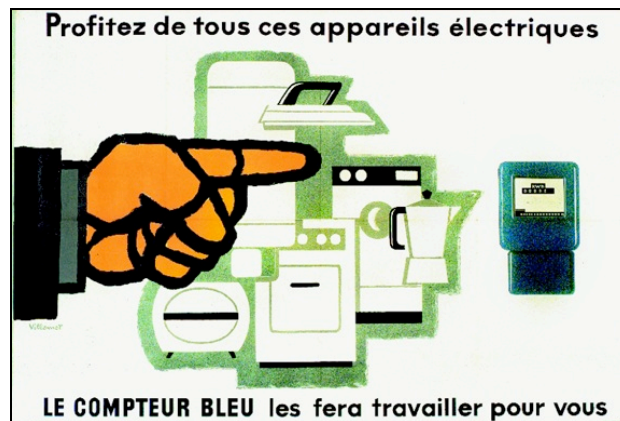
Figure 2 : Publicité EDF pour le compteur bleu (1963)

redressement de l'économie nationale et pour inciter le citoyen à y adhérer et à y contribuer. Cette même mise en scène peut, selon nous, être appréhendée comme le point de départ d'un récit de la relation entre EDF et ses clients.