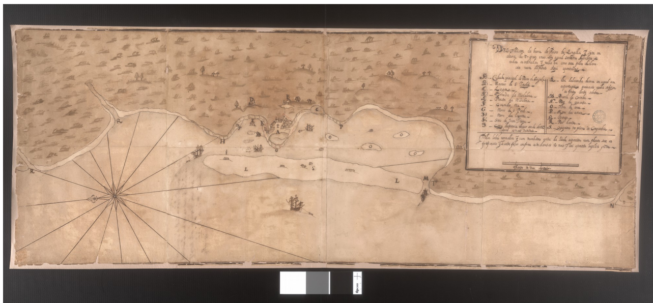
Figure 1 : Biblioteca da Ajuda, Lisbonne, codex 51-IX-21, f° 2. Reproduit dans HEINTZE, B. op. cit.

Le gouverneur portugais d'Angola de l'époque, Fernão de Sousa, tenta de remédier à cette situation dès son arrivée à Luanda, en juin 1624, alors que Philip van Zuylen assiégeait le port. Aussitôt ce dernier reparti vers le nord, il entreprit la construction de forts munis de pièces d'artillerie dans plusieurs points stratégiques de la baie de Luanda ainsi qu'une palissade sur la plage pour protéger la ville 24 . Les travaux entrepris étaient modestes, car les moyens manquaient, mais ils furent suffisants pour tenir en échec la deuxième attaque néerlandaise, commandée par Piet Heyn.