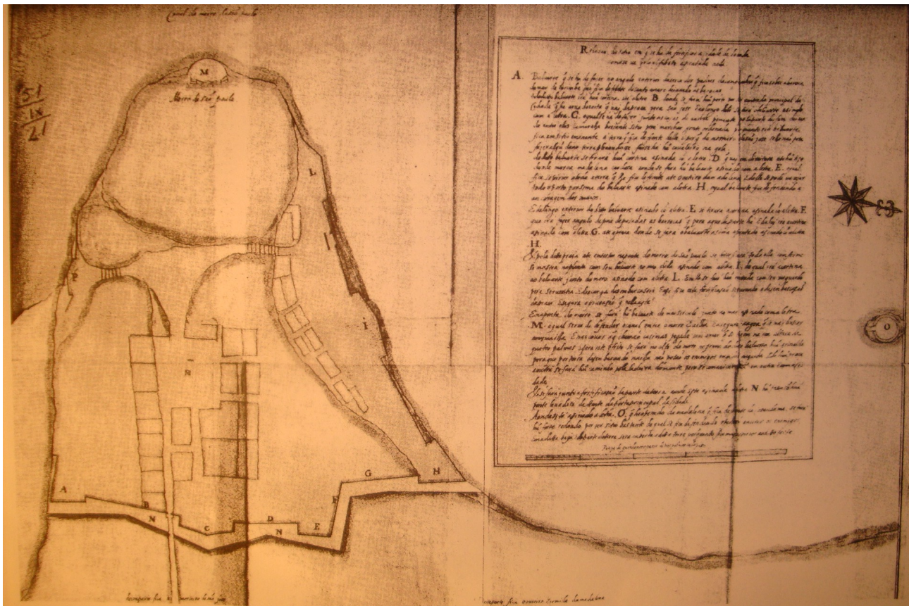
Figure 2 : Biblioteca da Ajuda, Lisbonne, codex 51-IX-21, f° 1. Reproduit dans HEINTZE, B. op. cit.

Après les échecs de 1624, les Néerlandais délaissèrent provisoirement leur projet de prise de Luanda. A cela, on peut trouver plusieurs explications. Premièrement, en 1624, l'occupation de Luanda n'avait de sens que dans la perspective d'assurer le commerce avec le port brésilien de Bahia. Or, la WIC en avait été expulsée par une flotte luso-espagnole en 1625. De plus, la compagnie néerlandaise connaissait des difficultés financières qui l'empêchaient d'entreprendre une nouvelle attaque contre le Brésil. La situation fut modifiée en 1628, lorsque Piet Heyn s'empara d'une flotte espagnole remplie d'argent du Pérou, au large de Cuba 28 . L'importante quantité de métal saisie permit à la WIC de reprendre son développement dans l'Atlantique sud. En 1630, les Néerlandais s'emparèrent de la capitainerie portugaise de Pernambouc. Très vite se posa la question de l'approvisionnement en main d'œuvre africaine nécessaire au fonctionnement des moulins à sucre de la région d'Olinda et de Recife. Le mouvement s'accéléra lorsque Johan Maurits de Nassau fut nommé gouverneur de Recife par la WIC. En 1637, il lança une expédition contre Elmina, puis en 1641, profitant du flottement politique provoqué par la restauration de l'indépendance du Portugal vis-à-vis de l'Espagne, il s'attaqua à Luanda et São Tomé.