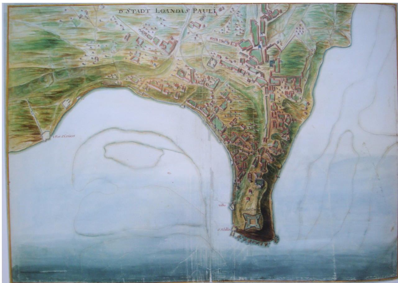
Figure 5 : Johannes Vingboons, Nationaal Archief, 4. VELH 619.63. Reproduit dans BROMMER, B. (ed.), op. cit

Les Portugais utilisèrent, quant à eux, le réseau de forteresses qu'ils avaient constitué dans l'hinterland. En 1646 et 1647, au fur et à mesure que leur situation devenait plus fragile, ils durent renforcer les quatre présides de l'intérieur, en particulier ceux de Muxima et de Massangano. En effet, cette forteresse, située à plus de 150 kilomètres de Luanda à la confluence du Kwanza et du Lucala, ne disposait pratiquement d'aucune défense capable de résister aux assauts de l'artillerie néerlandaise 38 . Les Portugais procédèrent également à la construction de forteresses supplémentaires dans quelques endroits stratégiques. En 1648, les Néerlandais assiégèrent la forteresse de Massangano, sans toutefois arriver à la prendre 39 .