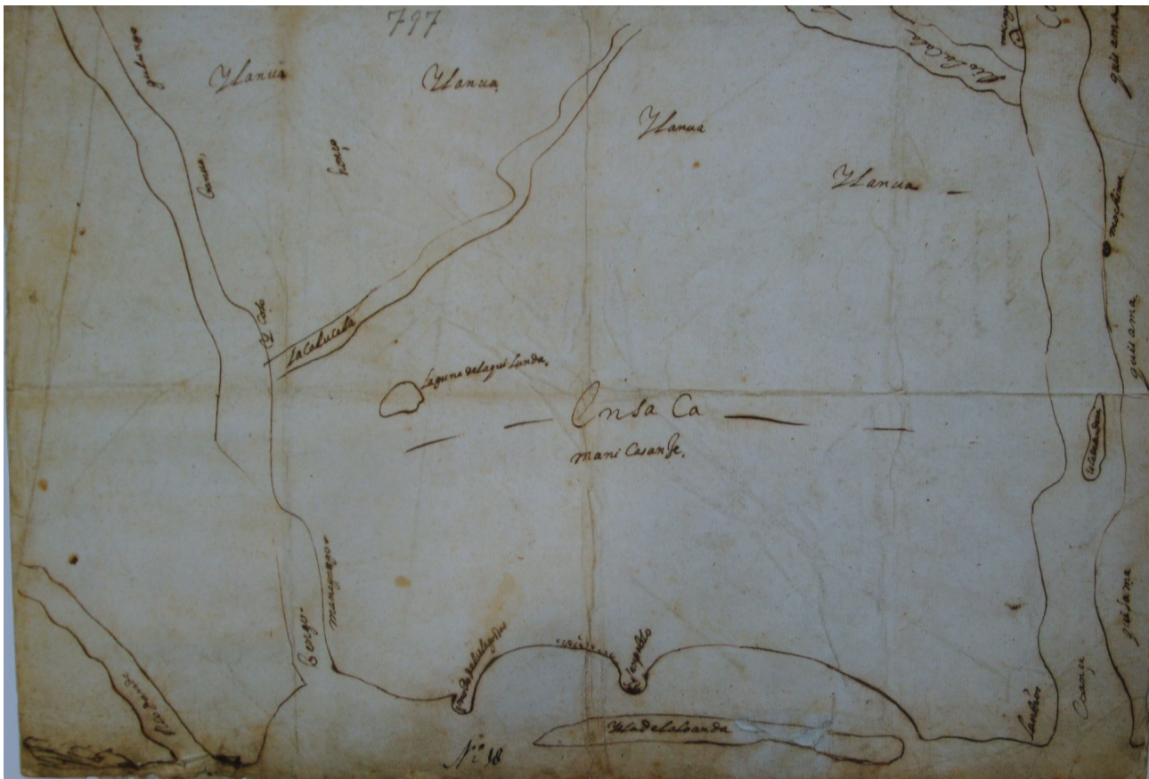
Figure 4: Anonyme, Nationaal Archief, 4 VEL 797. Reproduit dans BROMMER, B. (ed.), op. cit.

De leur côté, les Portugais commencèrent à établir des plans de reconquête de l'Angola à partir de 1643-1644, notamment sous l'impulsion de Salvador Correia de Sá. Dans un premier temps, il s'agit de projets visant à contourner Luanda : les Portugais cherchaient à éviter une confrontation directe avec les Néerlandais. Ces propositions visaient à construire des forts pour contrôler l'embouchure des fleuves Dande au Nord de Luanda, puis du Kwanza. L'objectif était d'encercler les Néerlandais et d'empêcher leur progression le long de la côte ou des fleuves. Finalement, une expédition portugaise accosta à Kikombo, dans la région de Benguela, au sud de Luanda, en 1645. Francisco de Sotomaior, le gouverneur portugais à la tête de cette expédition, fit construire un fort à cet endroit de la côte, avant de rallier Massangano via l'île de Ensandeira, située sur le Kwanza. Après l'expulsion des Néerlandais, ce fort fut abandonné par les Portugais.