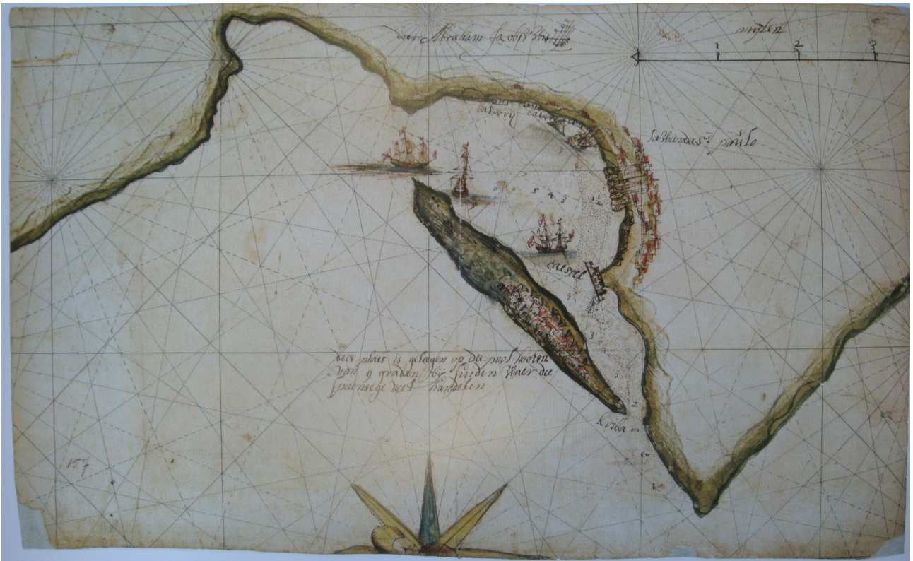
Figure 3 : Abraham Jacobsz Wis, Nationaal Archief, 4, VEL, doc. 157. Reproduit dans Brommer, B. (ed.), Grote atlas van de West-Indische Compagnie, Voorburg, Asia Maior - Atlas Maior , 2011.

La prise de Luanda par les Néerlandais eut lieu en août 1641 et se déroula pratiquement sans combat. Dans un document rédigé en 1643, le gouverneur portugais de l'époque, Pedro César de Meneses, écrit qu'il avait été impossible de défendre Luanda car ce port « était complètement ouvert sur la mer et sans aucune défense » 30 . Les Portugais abandonnèrent la ville et se réfugièrent sur les rives du fleuve Bengo, à quelques kilomètres au nord de Luanda, dans les propriétés agricoles des jésuites et de quelques riches habitants de Luanda 31 . A la fin de l'année 1641, sous la pression des Néerlandais, ils furent contraints de fuir vers l'intérieur des terres, jusqu'à Massangano. A partir de cette période, ils furent réduits au rôle d'intermédiaires commerciaux entre les Néerlandais et les Africains 32 .