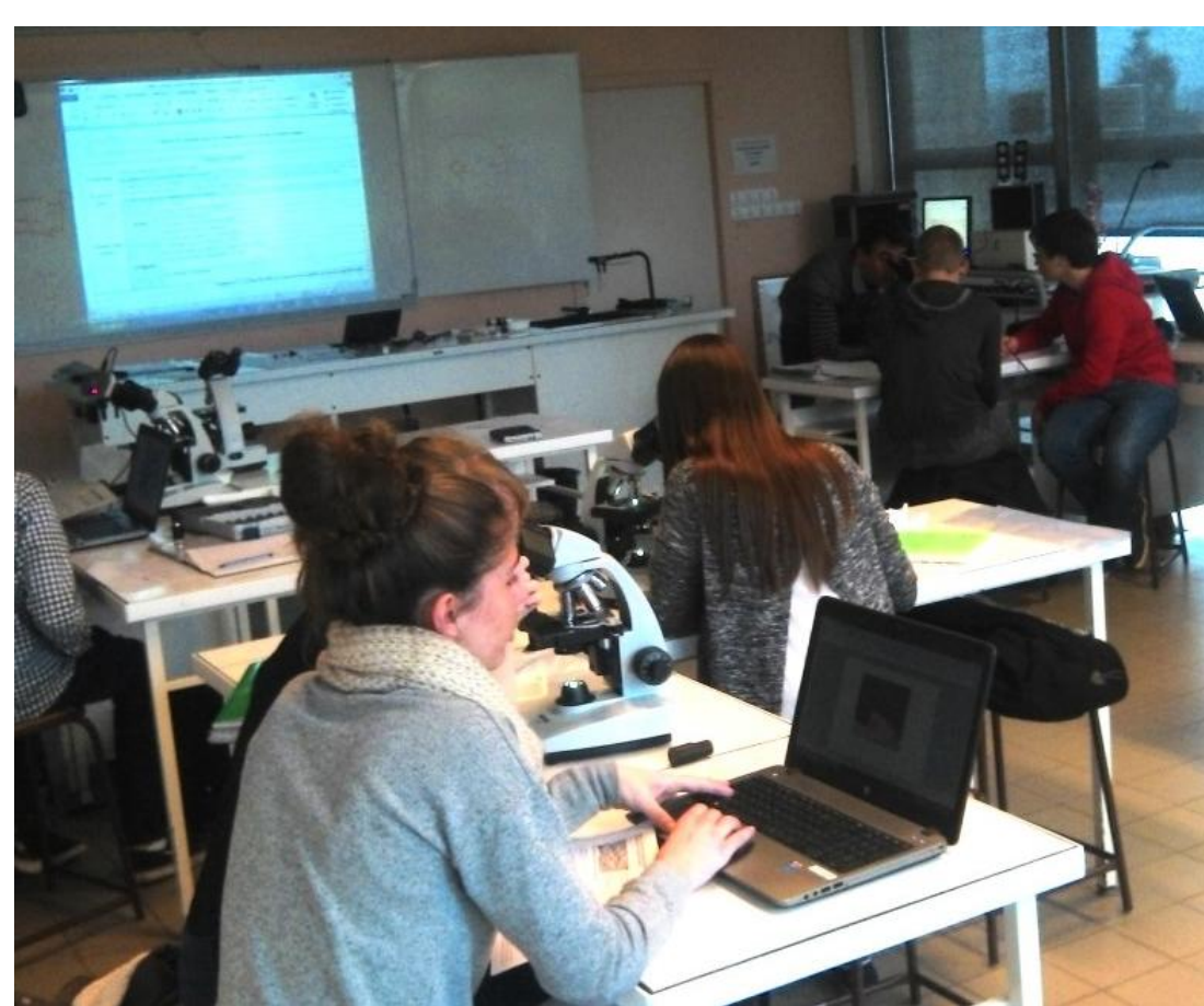
Séance de travaux pratiques de sciences de la vie et de la terre

Aider les élèves de lycée à concevoir un protocole expérimental en SVT (sur la mise en évidence de la fermentation alcoolique). Il s'agit d'une tâche complexe inhérente à la démarche d'investigation, attendue à l' ECE , et à l'origine de difficultés identifiées . Afin de faciliter l'activité, nous leur proposons comme étayage , une pré-structuration de protocole sur la plate-forme informatique LabBook qui prend en charge certaines difficultés identifiées.