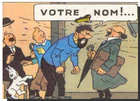
Figure 3 : Position posturale typique dans le cas de forçage vocal (Source : Hergé)

Des études récentes ont montré par exemple que la production de parole pouvait être accompagnée de mouvements de sourcils, ceux-ci s'élevant à des moments bien précis pour marquer, par exemple, des informations importantes. De même, la posture d'un locuteur peut accompagner la production vocale. Typiquement, quand nous voulons nous adresser à un interlocuteur de façon insistante pour nous faire comprendre de façon impérative, il est fréquent d'observer une bascule du tronc vers l'avant et une bascule de la tête (Figure 3).