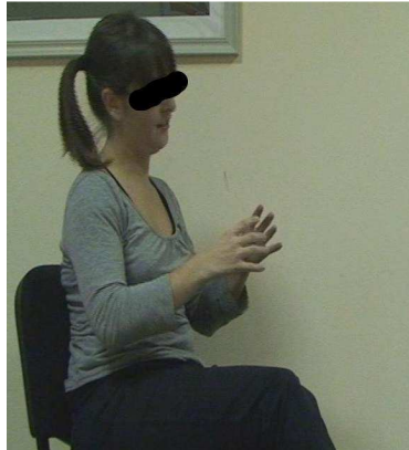
Figure 4 : Geste illustratif en disant [gros comme ça]

du fromage ce qui est beaucoup plus facile que de décrire la taille verbalement (en centimètres par exemple). De même, le geste peut véhiculer des informations qui ne sont pas du tout apportées par la parole. Par exemple, lorsque quelqu'un dit « On reste en contact ? » en produisant un geste de mains tapant sur un clavier, il est suggéré que le contact se fera par courriel par exemple et non par téléphone.