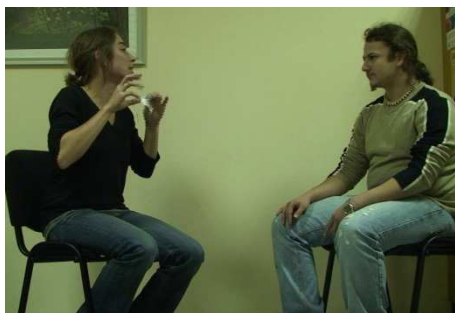
(a) [quand tu montes à un arbre]

Lorsque l'interlocuteur peut avoir du mal à comprendre, le locuteur a également tendance à adapter sa gestuelle. Ainsi, Tellier et Stam (2010) ont demandé à de futurs enseignants de Français Langue Etrangère de faire deviner des mots de vocabulaire à des partenaires francophones et des partenaires étrangers apprenant le français. Cette étude montre que lorsque les futurs enseignants s'adressent à des étrangers, ils produisent des gestes plus illustratifs, plus grands et qui durent plus longtemps que lorsqu'ils s'adressent à d'autres francophones. Ainsi, dans la Figure 5a, la locutrice parle à un francophone et dit « quand tu montes à un arbre » et produisant un geste au niveau du cou. Quand elle parle à un apprenant de français (Figure 5b), elle dit presque la même phrase et produit le même geste mais beaucoup plus grand. Cela suggère que ces futurs enseignants utilisent leurs gestes comme stratégie pour faciliter la compréhension de leur discours par leurs interlocuteurs.