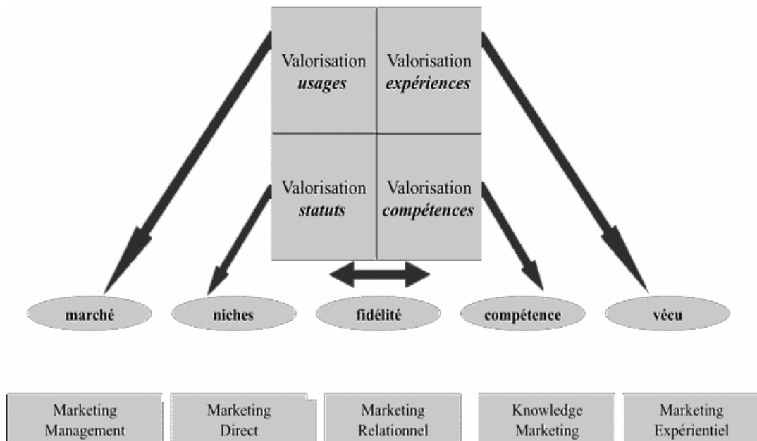
Figure 2. Les liens entre les sources de valorisation du et les axes stratégiques

Ces différentes valeurs (usage, statutaire, expériences, compétences) peuvent être mises en regard des divers axes stratégiques de l'entreprise (marché, niche, fidélité, compétence, vécu) (fig. 2).