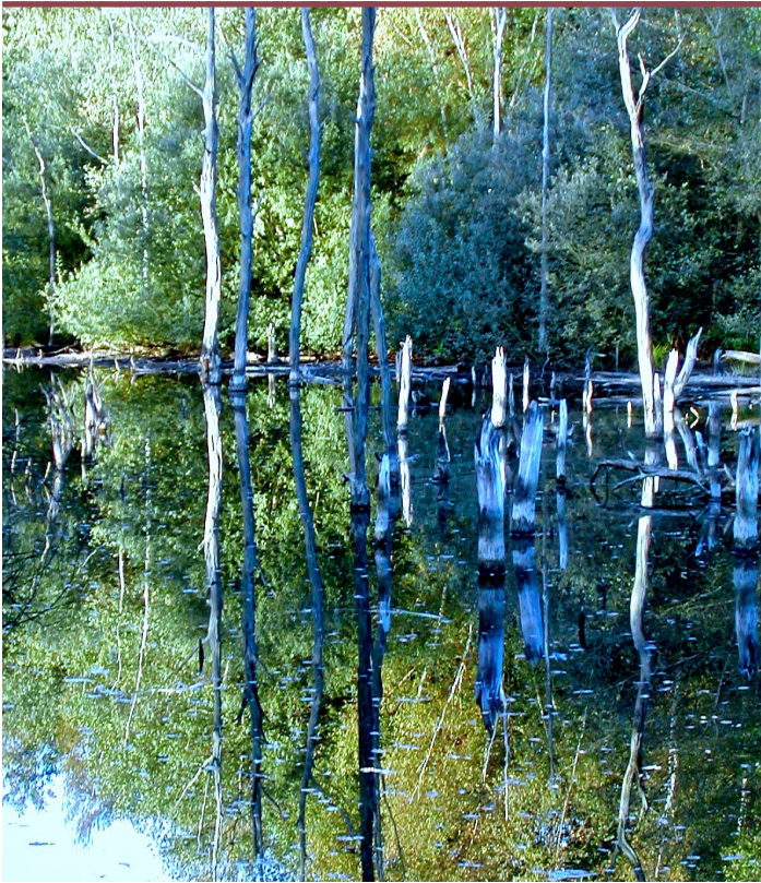
Figure 2. Le droit à la différence.

câblage [wiring] dans son article de 1998 [5]), mais ce n'est pas être normal (au sens de : conforme à un modèle, sain, bien conçu) ou avoir l'exclusivité d'un bon fonctionnement cérébral.