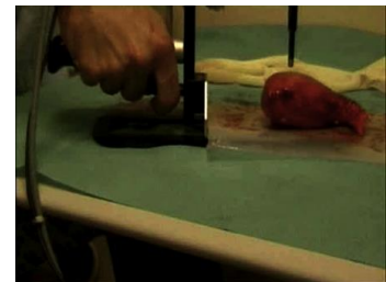
Figure 2 : Essai d'indentation d'utérus (pince rhéobiol)

expérimentaux que numériques qui ont pour objectif commun de permettre une meilleure caractérisation du comportement mécanique des tissus du vivant et de proposer des lois de comportement représentatives de ce comportement afin d'enrichir les codes de calculs numériques. En tenant compte notamment des possibilités offertes par les méthodes d'identification par analyse inverse, nous avons par exemple conçu et réalisé une machine d'essai transportable (« pince rhéobiol »), utilisable à proximité