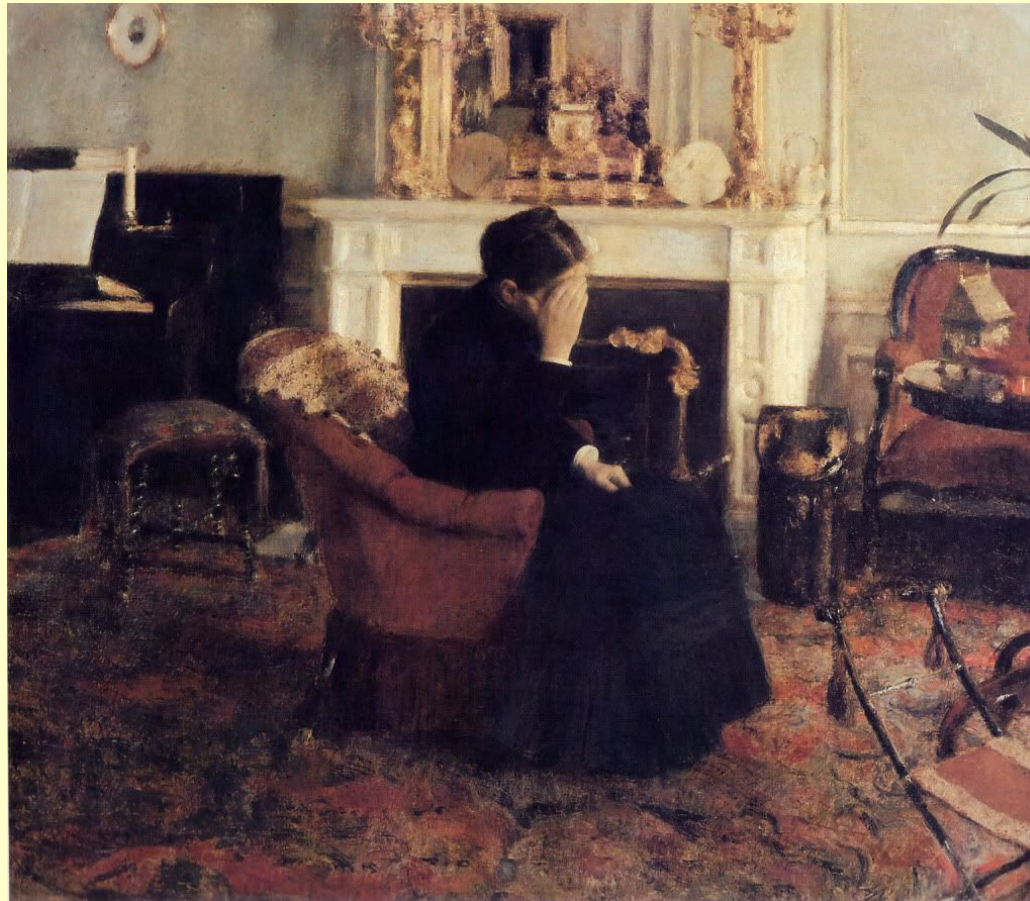
Fernand Khnopff, Schumanns Werken zuhörend , 1883