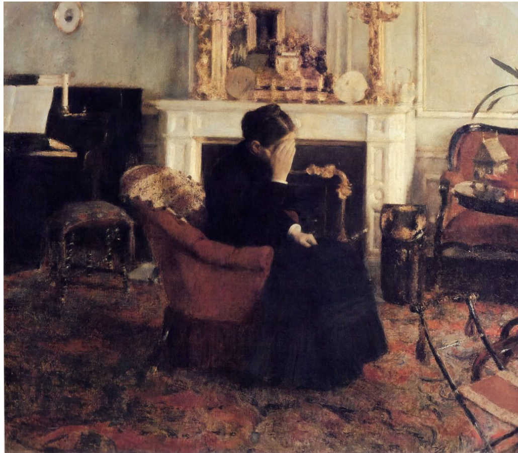
Fernand Khnopff, Schumanns Werken zuhörend , 1883