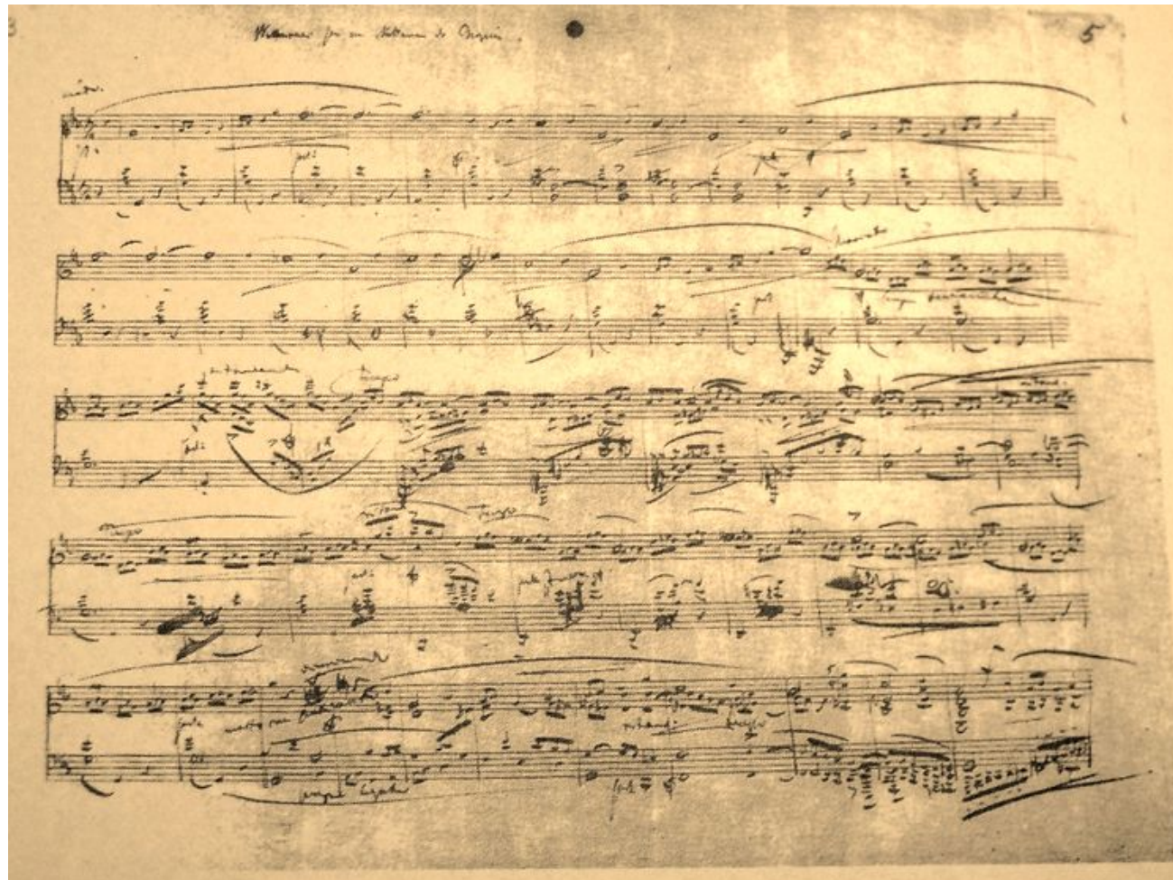
Autographe des Variations sur un nocturne [sic] de Chopin, Zwickau, Robert-Schumann-Haus, 9954-A1