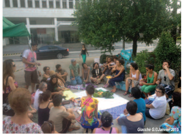
Photo 2 : Présentation du CSA lors d'un moment de convivialité dans le jardin du Cycliste