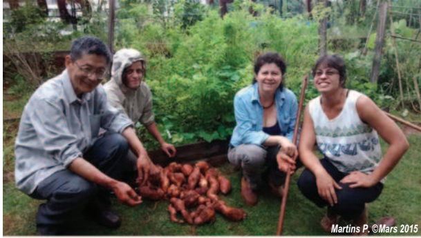
Photo 1 : Récolte collective de patates douces dans le jardin du centre culturel de Sao Paulo