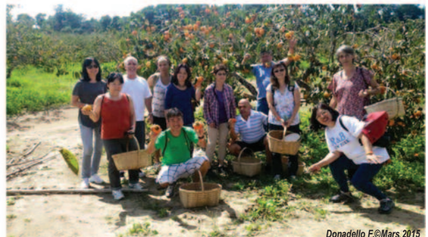
Photo 4 : Visite dans une exploitation en Piedade (SP) lors de la récolte du Kaki

d'accès facile. La moitié des enquêtés continuent d'acheter les produits dans les supermarchés, même s'ils préféreraient acheter des produits biologiques directement auprès des producteurs, mais la diffusion est insuffisante sur des marchés et les horaires réduits et non flexibles.