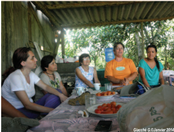
Photo 3 : Réunion entre agriculteurs, techniciens et consommateurs de l'Organisation de Contrôle Social (OCS) à Sao Paulo dans la zone rurale de Parelheiros

Pour ce qui concerne l'approvisionnement, un quart des personnes enquêtées s'approvisionne à travers le delivery biologique ou participe à un Groupe d'achat collectif 31 (Photo.2), en achetant un panier une fois par semaine auprès des agriculteurs qui se trouvent dans les environs 32 de la métropole. Un autre quart s'approvisionne dans les marchés de quartier où normalement il y a des revendeurs qui vendent de produits achetés dans le CEAGESP 33 issu de l'agriculture conventionnelle. Ce choix est dicté principalement par la facilité d'accès et la proximité qui ne sont pas garanties par les seuls sept marchés biologiques où généralement le vendeur est producteur, ces marchés ne fonctionnant seulement qu'un ou deux jours par semaine. Pour ces raisons, les marchés biologiques ne sont pas pratiques à utiliser au quotidien et ne sont pas