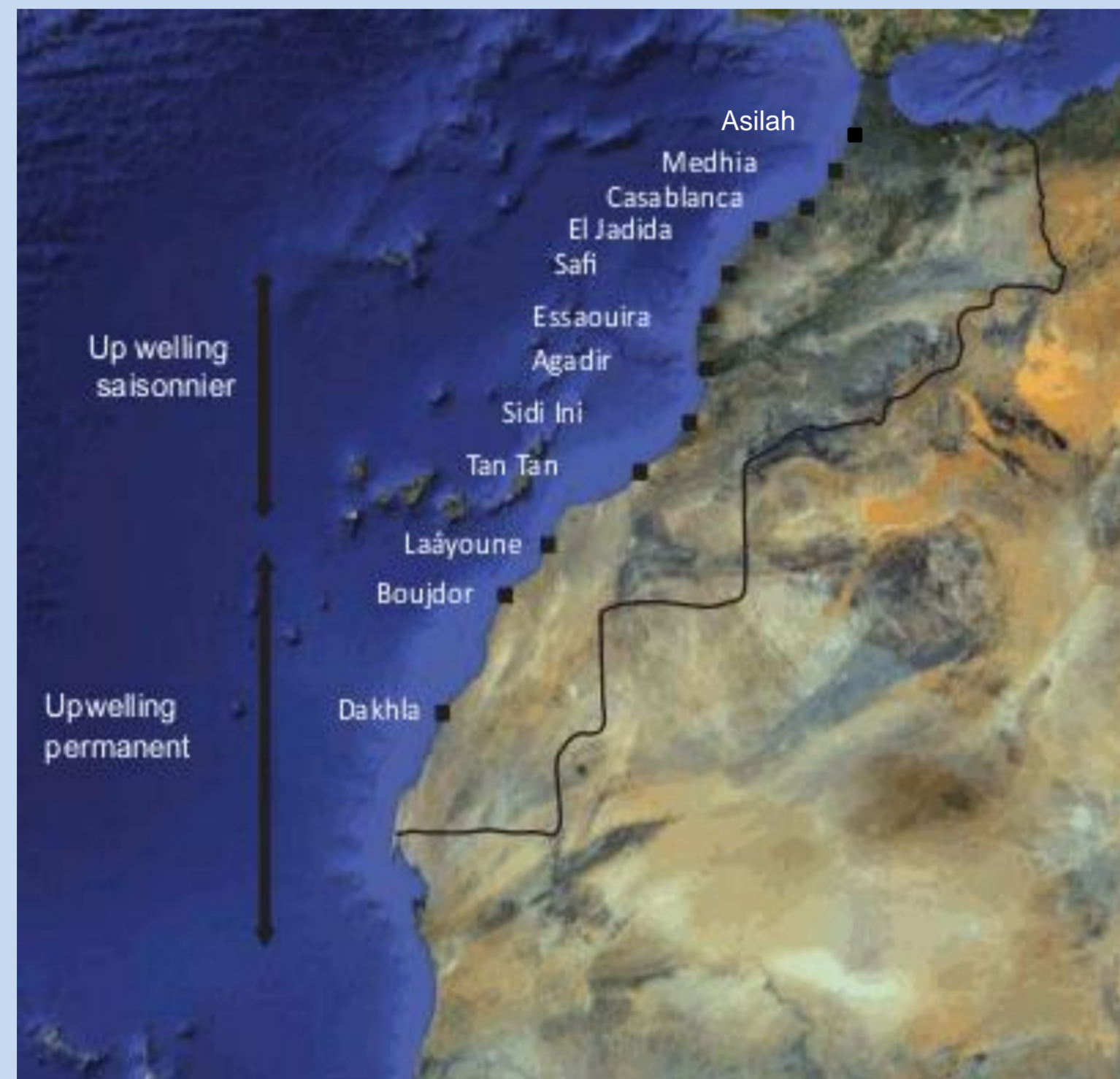
Figure 1: Carte des sites de prélèvements sur la côte marocaine

1-INRH, Bd Sidi Abderrahman Ain Diab, Casablanca, Maroc 2-UMR 6539 IRD/CNRS/UBO LEMAR, IUEM, Place copernic, 29820 Plouzané, France 3-UMS 3113, PSO, IUEM, Place copernic, 29820 Plouzané, France