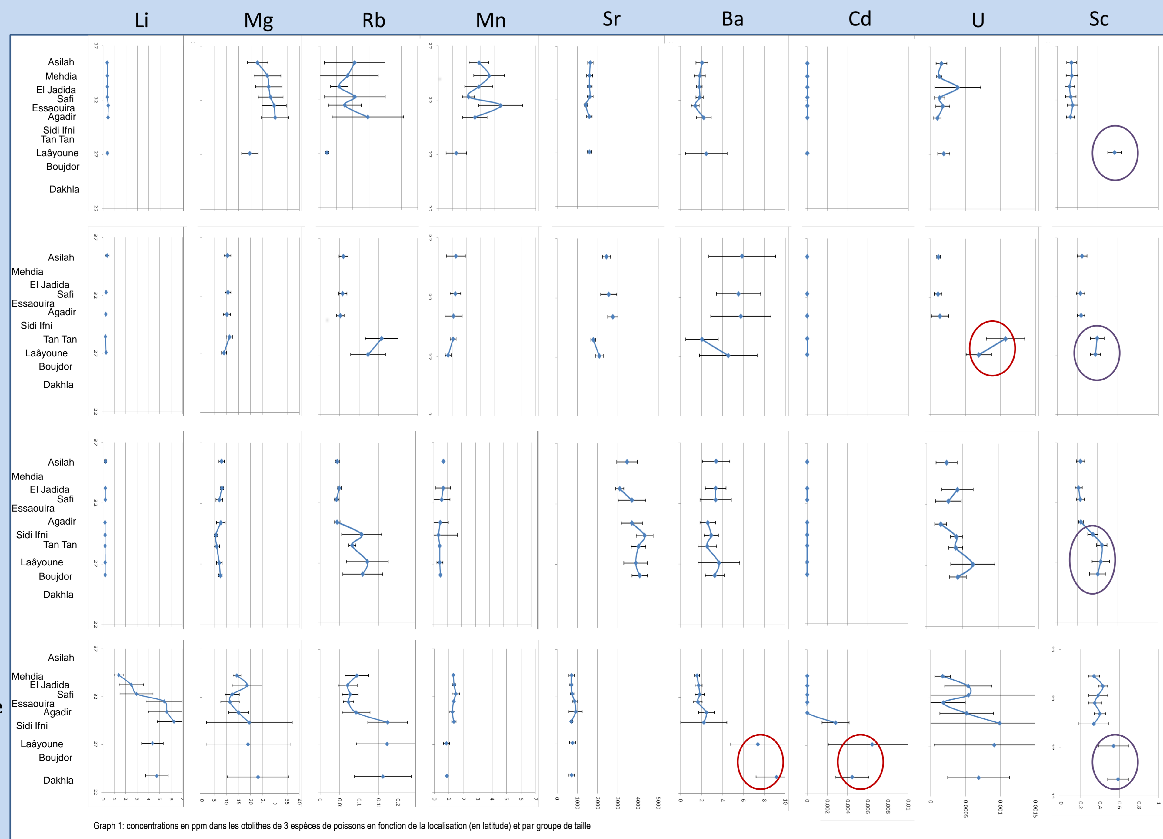
Graph 1: concentrations en ppm dans les otolithes de 3 espèces de poissons en fonction de la localisation (en latitude) et par groupe de taille