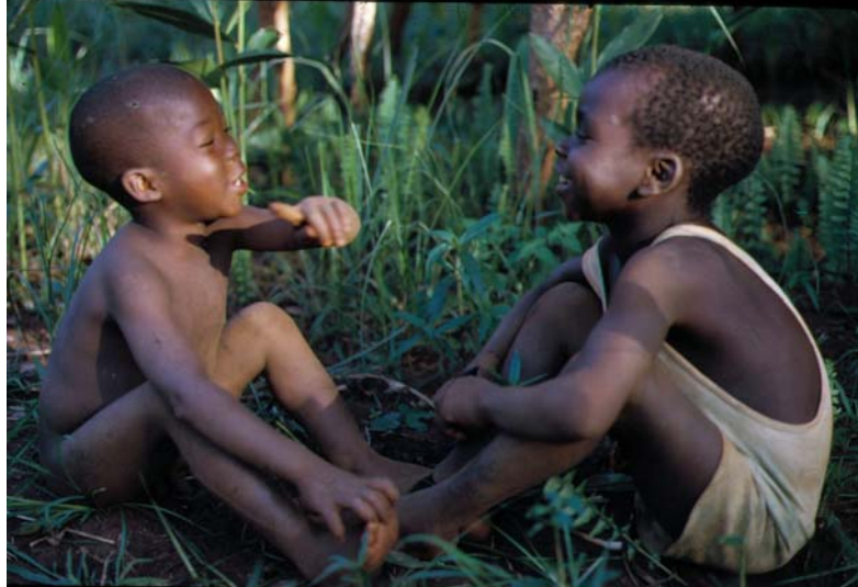
Photo. 1 Conversation animée entre deux enfants

La « parole » 1 wèn a un support, la « voix » kò-gér (intérieur.D/cou) et un outil « la langue, l'idiome » nú 2 que seuls les humains savent utiliser. Le verbe « parler » n'est pas un terme simple mais un terme technique, le verbe transitif tò dont le sens de base est « rendre performant ». Il réfère au fait d'« affûter » une lame lorsque le COD est le terme couteau ou coupe-coupe, par exemple, et au fait de « parler » lorsque le COD est le terme parole ou langue. Parler une « langue » nú permet d'exprimer des « paroles » wèn . Ces paroles sont une production élaborée qui se distingue de la simple production brute que sont les cris des animaux ou les pleurs des hommes qu'exprime le verbe hei dont le sens de base est « rassembler dans un but précis ».