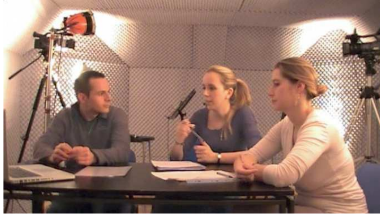
Figure 1 Dispositif d'entretien d'autoconfrontation

La Figure 1 montre le dispositif d'autoconfrontation (l'étudiant est à gauche, assis avec les deux chercheuses). Avant de commencer les entretiens, un test pilote a été réalisé afin de tester le protocole expérimental mis au point pour les entretiens d'autoconfrontation. Nous avons choisi de faire tous les entretiens en chambre sourde pour les avantages suivants : une bonne insonorisation phonique pour avoir une qualité de son optimale, une bonne luminosité qui n'est pas sujette aux variations du soleil et que l'on peut contrôler avec des projecteurs et, enfin, la certitude de ne pas être dérangé-e-s pendant les enregistrements. Le déroulement de ces entretiens était toujours le même. D'abord, le futur enseignant lisait silencieusement la consigne pour le visionnage de la vidéo. Ensuite, lors du visionnage, il était invité à lancer la vidéo et à l'arrêter chaque fois qu'il souhaitait faire un commentaire en rapport avec son corps et/ou sa voix ou le corps et/ou la voix de son partenaire (laisser l'étudiant arrêter la vidéo dès qu'il le souhaite est une pratique privilégiée pour les entretiens d'autoconfrontation, voir à ce sujet Leroy, 2011). À la fin de l'entretien, nous lui proposons un questionnaire pour recueillir ses impressions sur la séance (que nous évoquerons dans la conclusion du présent chapitre). Les résultats présentés ici montrent les commentaires des étudiants pendant la séance d'autoscopie sur leur corps ou celui de leur partenaire.