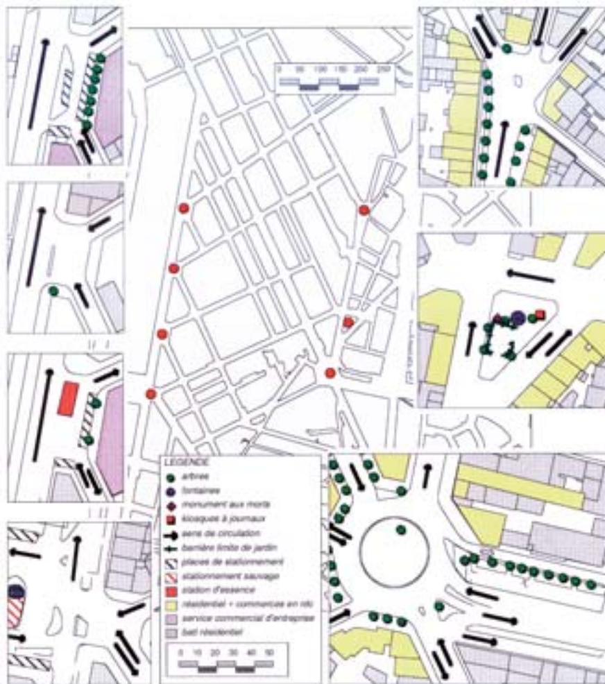
1. Typologie de places

Les cartons de la figure. 1 servent de support à l'analyse comparée des sept places ; les données retenues sont suscep-