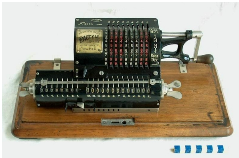
Une calculatrice Dactyle

erreur ne s'est glissée dans les calculs. Il montre ensuite comment effectuer facilement les calculs à l'aide d'une calculatrice mécanique de type Dactyle . En effet, sa méthode devait pouvoir être utilisée par des soldats n'ayant qu'une formation minimale en mathématiques. Cholesky termine son travail par des exemples numériques : il faut 4 à 5 heures pour obtenir la solution d'un système de dimension 10 avec 5 chiffres exacts.