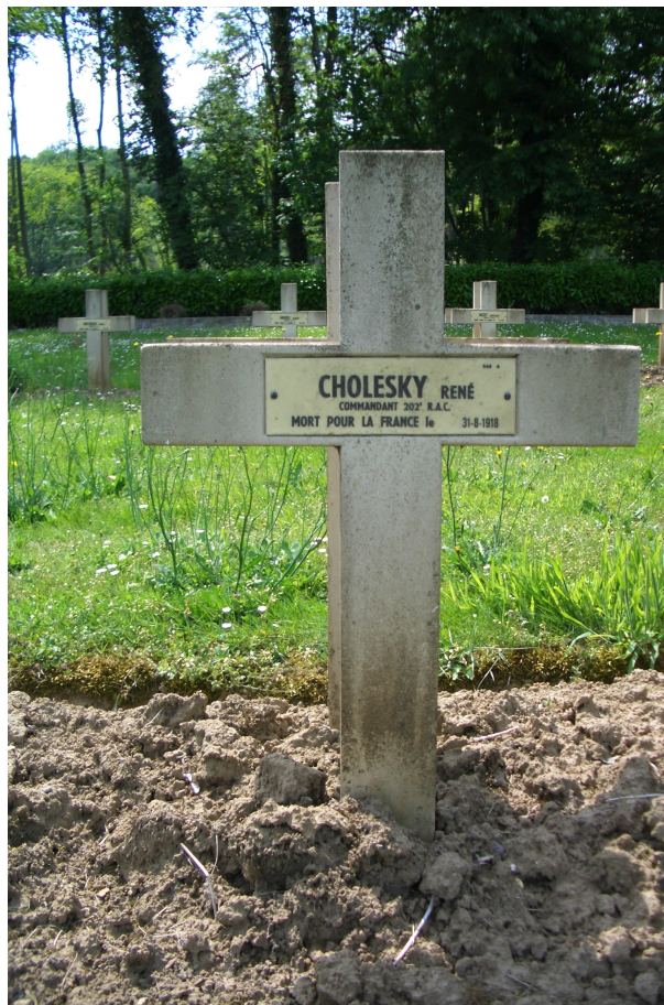
La tombe de Cholesky

Le 31 août 1918, le Commandant Cholesky décède à 5 h du matin dans une carrière au nord de Bagneux (dans l'Aisne, à environ 10 km au nord de Soissons) des suites de blessures reçues sur le champ de bataille. Il repose au cimetière militaire de Cuts (dans l'Oise, à 10 km au sud-est de Noyon), tombe 348, carré A.