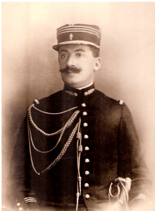
André-Louis Cholesky

En conclusion, Cholesky est un exemple remarquable d' ingénieur-savant issu des grandes écoles scientifiques françaises du dix-neuvième siècle. Ayant reçu une culture mathématique de haut niveau, il est capable d'initiative et d'originalité dans les travaux auxquels il est confronté [10]. Comme enseignant, il expose des idées nouvelles et fait preuve d'une réflexion personnelle dans ses ouvrages. C'est un personnage complet et attachant, également remarquable dans ses multiples activités d'ingénieur, de mathématicien, de topographe, d'officier d'artillerie et d'enseignant.