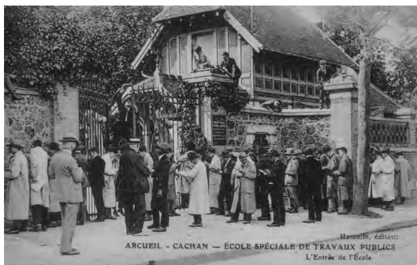
École spéciale des travaux publics à Cachan

À partir de décembre 1909 (et peut-être avant) et jusqu'à janvier 1914 au moins, Cholesky participa à l'enseignement par correspondance de l' École spéciale des travaux publics, du bâtiment et de l'industrie [11]. Cette école avait été fondée en 1891 par Léon Eyrolles (1861-1945), un conducteur de travaux des Ponts et Chaussées, pour aider ses collègues à obtenir le titre d'ingénieur [12].