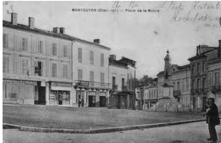
Café du Centre et Hôtel de l'Étoile