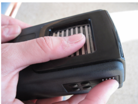
figure 1 : le Module d'Intertaction Tactile

D'abord, premièrement, on peut considérer que toute médiation technique singulière est une modalité sensori-motrice inédite du toucher-l'autre. Si l'on considère, par exemple, le cas de la caresse distale (mobilisant la médiation des Modules d'Intertaction Tactile 28 ), les possibilités fonctionnelles d'être touché par l'autre sont