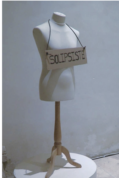
figure 3 : La Statue d'un solipsiste