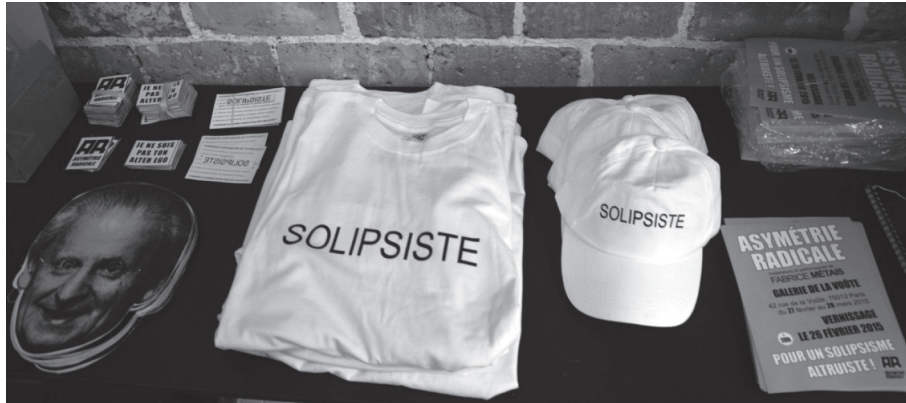
Illustration 3. Supports de communication pour la diffusion du « solipsisme altruiste ».