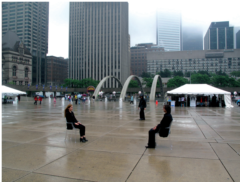
The Two Gullivers. Re-enactment of Nightsea Crossing . 8h. 2011. (Nathan Philips Square, Toronto. Place originale de la performance de Marina Abramovic & Ulay, 1982).