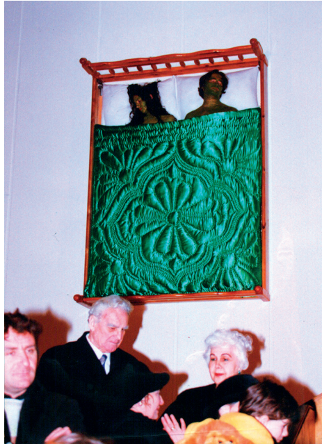
The Two Gullivers. Gullivers Sleep . 1998. Performance, Installation. Galerie Nationale de Tirana (Albanie).