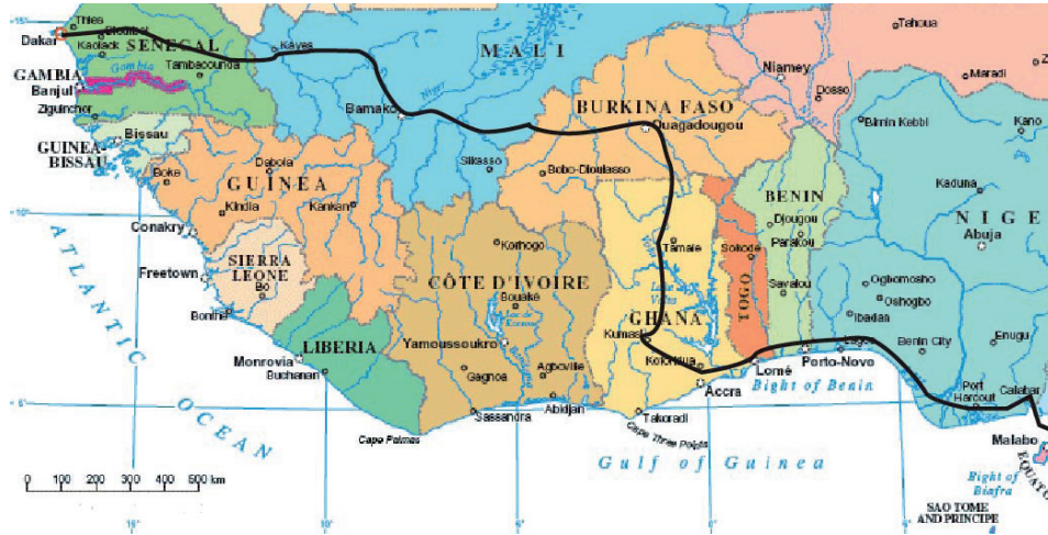
Fig. 2. Itinéraire du projet Exitour (de Douala à Dakar en passant par Lagos, Cotonou, Lomé, Accra, Ouagadougou, Bamako).

Dans une certaine mesure, Exitour apparaît aussi comme une réponse à la rivalité des collectifs d'artistes de Douala et de Yaoundé dans les années 1990 et 2000. Cette période connaît une très forte propension de regroupements en associations. Le Cercle des Artistes Plasticiens du Littoral (CAPLIT) créé en 1983 20 , faction transfuge de l'UDAPCAM 21 , se mue en Kheops Club 22 en 1994 avec, à la tête, les doyens des arts plastiques du Cameroun (Koko Komegne, Viking, Nya Delors...). Mais très vite, les discordes liées aux démarches artistiques et approches esthétiques vont amener les jeunes, étouffés par les anciens, à s'isoler pour mieux s'auto définir. Ainsi naît à Douala, le cercle Kapsiki 23 ; qui fait le choix de se libérer de la peinture classique pour explorer l'espace de la ville, il se démarque par l'organisation de scénographies urbaines en collaboration avec des partenaires étrangers 24 . La réponse de Yaoundé est la mise en