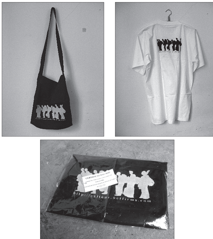
Ph. 6. Le package

Au début des années 2000, la scène artistique camerounaise en particulier et africaine en général manquait cruellement d'infrastructures d'accompagnement des artistes et de leurs œuvres. C'est fort de ce constat d'immobilisme, d'attentisme qu' Exitour s'est progressivement construit sur la base d'interactions avec un public diversifié. Cette construction , conçue comme un « vivre ensemble harmonieux ( walkingtogether ) » a, durant deux mois, noué, délié et éprouvé les liens d'existence entre les artistes nomades – et introduit la métaphore du miroir de notre propre « inculturation ».