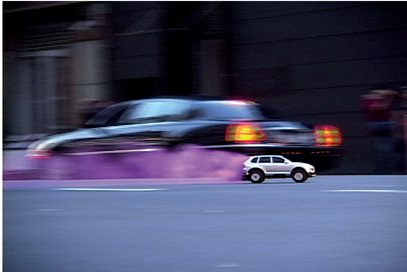
Toy Emissions, New York 2007, HeHe

Performer l'espace public le « design critique » du collectif HeHe