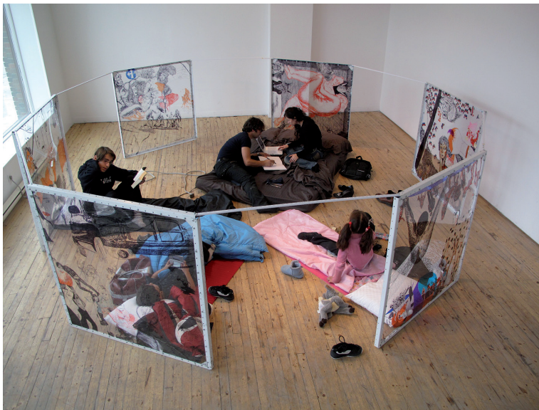
The Two Gullivers. Bauhaus Nr.1 . 2009. Performance, Installation. Artspace, Peterborough (ON, Canada)