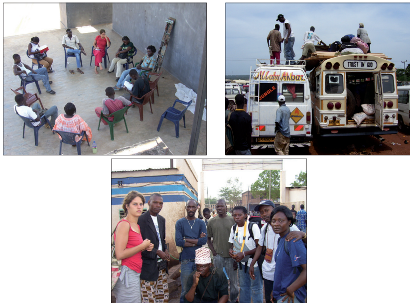
Ph. 4. De Lomé à Ouagadougou en passant par Accra