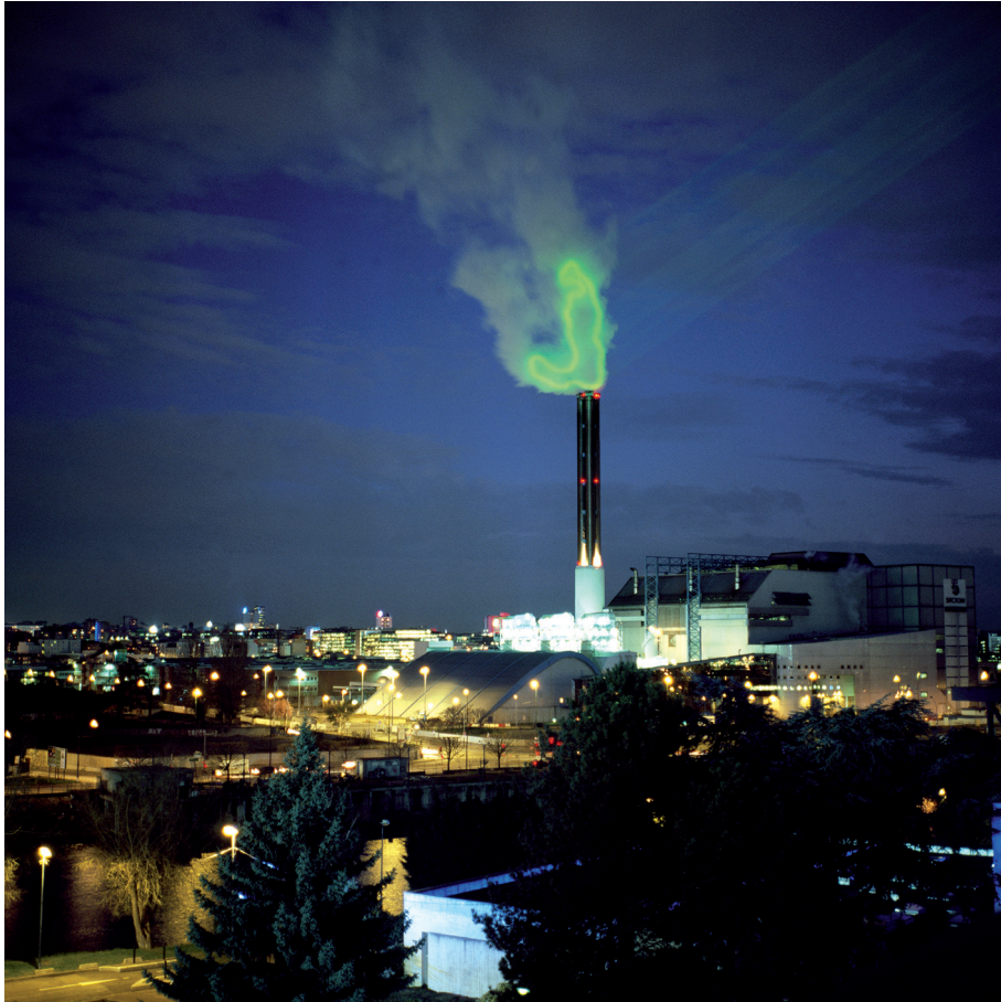
Nuage Vert, Saint-Ouen 2009, HeHe