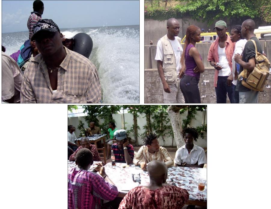
Ph. 2. De Douala à Cotonou en passant par Lagos