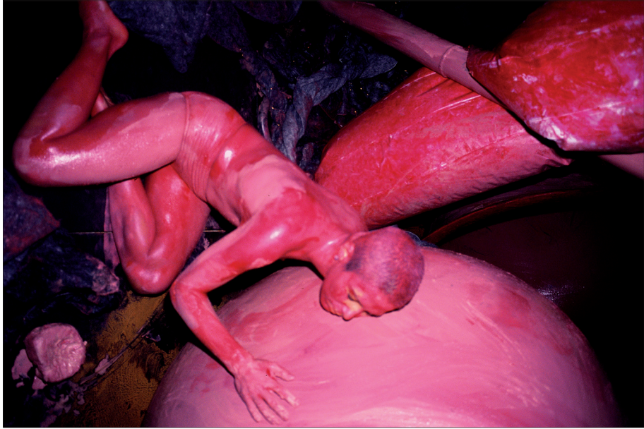
Figure 2 - Rachat , Centre culturel de la banque du Brésil, 2001

la fuite du prisonnier. Tunga construit une métaphore, en se servant de cette scène pour activer le rapport entre prison et liberté. La performance Tereza fut réactualisée dans d'autres villes 3 et à chaque fois elle se transforma, et de nouveaux sens y furent ajoutés, en fonction des rapports établis avec d'autres travaux et aspects culturels locaux. À São Paulo et à Brasília, elle fut réalisée au Centre Culturel de la Banque du Brésil (CCBB), et s'intitula respectivement Resgate [Rachat], comme une opération bancaire, et Assalto [Hold-up].