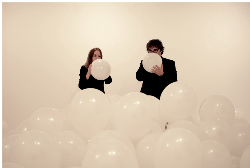
The Two Gullivers. Souffle de l'Artiste . 2014. 40h, 2000 Ballons soufflés par les artistes. Performance, Installation. Galerie Joyce Yahouda, Montréal.