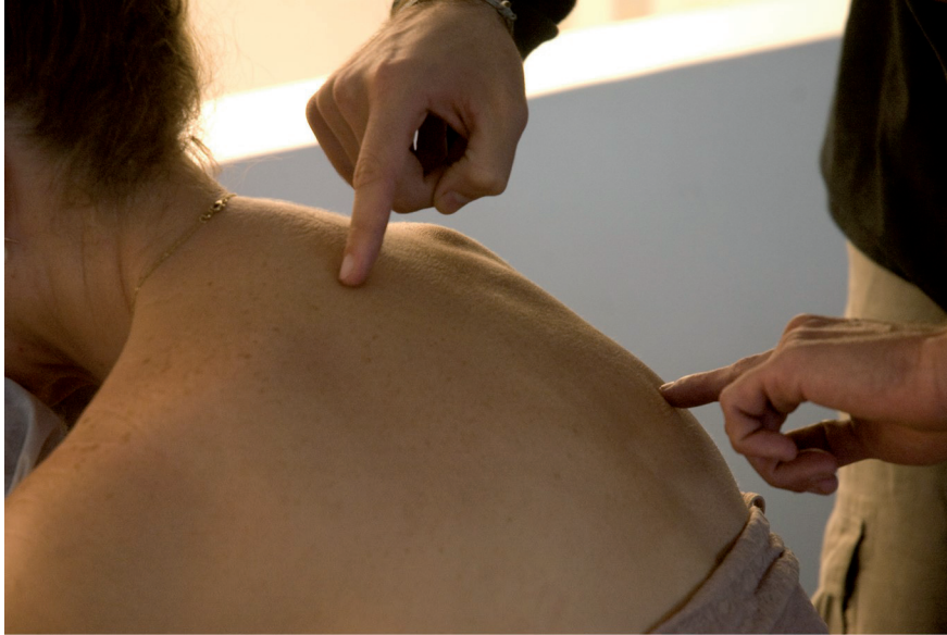
Caminhozinho [ Petit chemin ]. Photographie Sung Pyo Hong, 2009.