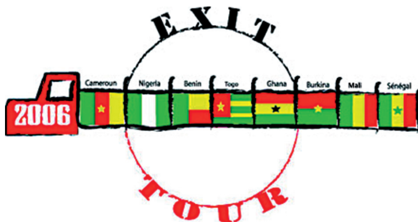
Fig. 1. Conception graphique : Alioum Moussa

Université de Maroua, département des Beaux-Arts et des Sciences du Patrimoine, CREGUM (Centre de recherche et d'études globales aux unités multidisciplinaires), Cameroun.