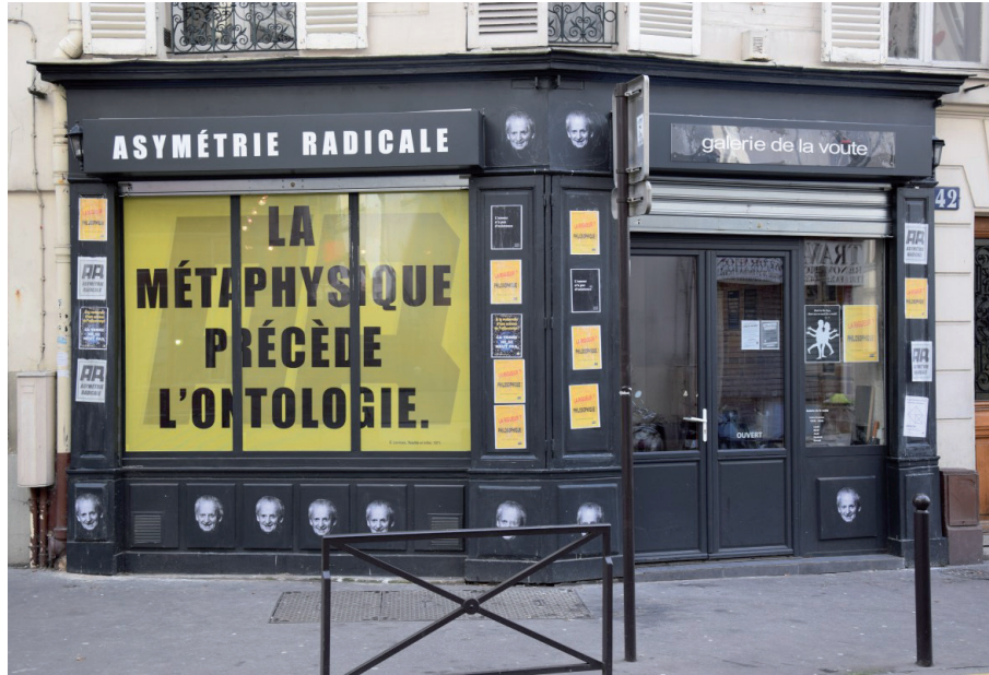
Illustration 1. La galerie de la Voûte devient le quartier général du collectif Asymétrie Radicale.

d'une adresse et d'un partage. S'il devait être dans l'essence de la philosophie que d'être partagée (ou partageable) au sein d'une communauté de philosophes, alors toute philosophie solipsiste serait à exclure a priori , comme inconsistante. Ces philosophies qui ne s'autorisent pas à mettre en doute le « nous » transcendantal, qui se placent sous son autorité, le collectif AR les qualifiera de politiquement correctes. En effet, elles s'inclinent d'emblée sous l'exigence d'un vivre ensemble, d'un partage, d'un commun, d'une réciprocité, d'un universel. Par là même, leur serait inaccessible tout domaine du sens relevant d'abord de l'asymétrie séparant le sujet de l'autre. Si le collectif AR entend transgresser le paisible enclos d'une philosophie assujettie au « nous », ce n'est pas (uniquement) par goût de la provocation, mais parce que c'est au prix seulement de cette subversion que certaines dimensions du sens pourraient se laisser atteindre par la description phénoménologique : quand, par exemple, l'expérience du désir ou de la responsabilité appelle une pensée de la singularité et de la non-réciprocité, le phénoménologue devra, au prix – sans doute accessible, sans doute nécessaire – d'une absurdité ontologique, se risquer hors le confort d'une philosophie communautaire. Levinas aura ouvert la voix d'une telle philosophie, refusant avant tout l'hégémonie et la primauté du « nous ».