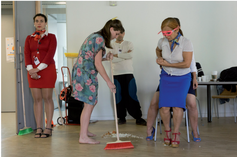
Activation de la méta-performance par 4 métanautes... 25 septembre 2014.