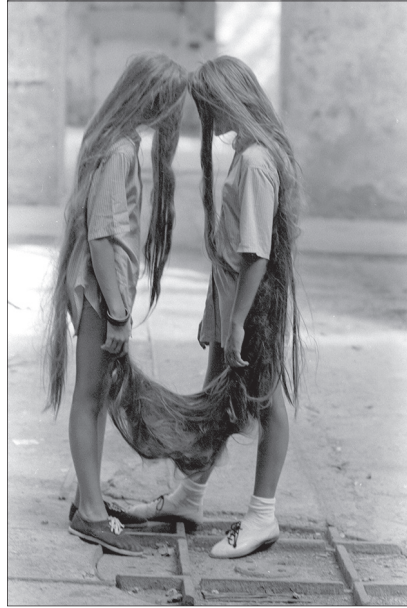
Figure 1 - Xiphopages capillaires, 1985

qui remet en question l'élitisme de la culture et le système de l'art. Corpobra montrait que les supports traditionnels de l'art ne répondaient plus aux nécessités nouvelles, le corps étant alors considéré comme un moyen de plus pour l'élargissement des activités artistiques, au même titre que tant d'autres objets, tels des cartes, des photos, des films, des vidéos, des photocopies, des miméographes.