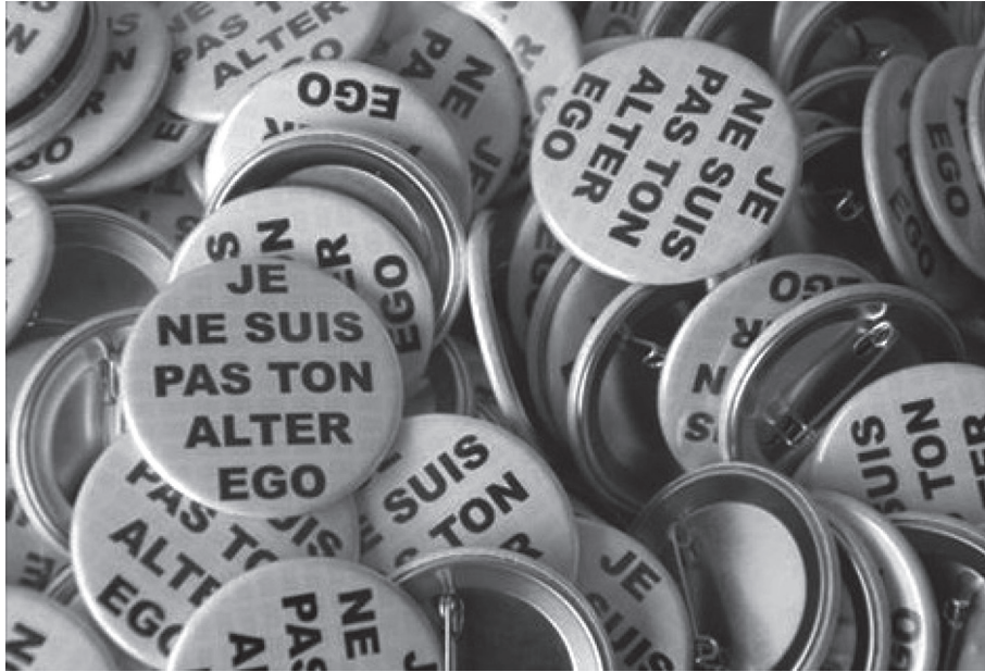
Illustration 2. Insinuer, dans le monde même, une critique incarnée du « nous » transcendantal.

de son visage – témoignage d'une altérité radicale, inassimilable dans l'immanence de la conscience. La révélation du visage est appel, commandement – elle pousse le sujet hors la somnolence de ses pensées, elle l'accuse et en cela fait son élection, son érection. « [La mortalité d'autrui] me rappelle d'urgence à ma dernière essence, à ma responsabilité 25 . »