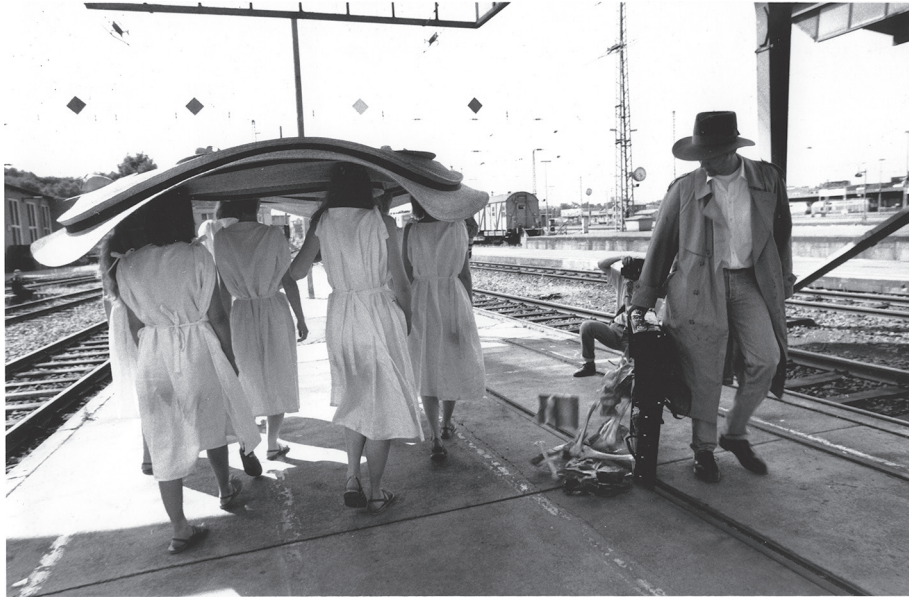
Figure 3 - Performance Inside Out-Upside Down , Documenta de Kassel, 1997

une temporalité intriquée que l'on aperçoit dans l'ensemble des travaux de l'artiste. Tout conspire contre la normalisation, car l'idée de flux, de métamorphose constante, empêche la notion de quelque chose d'établi et de fini. Dans le travail de Tunga, la question du continu est complexe, car elle comprend plusieurs strates de signification juxtaposées, par la relation constante qu'il établit avec la topologie et avec la psychanalyse, par la fiction de ses textes et l'incorporation de travaux précédents. Ses œuvres sont susceptibles de nouveaux arrangements; parfois ce ne sont que des éléments qui migrent d'une œuvre à l'autre, mais il y a aussi le fait que les travaux changent de nom à chaque réactualisation et incorporent de nouveaux éléments ou bien se mélangent à d'autres œuvres, comme s'ils gagnaient une vie nouvelle à partir de l'atmosphère et de l'occasion pour lesquels ils sont réalisés. Dans cette réactualisation survient un changement, tel un processus d'immersion de temps et d'espace, qui déplace le même en autre. Il ne s'agit pas d'un moment et d'un lieu, mais de plusieurs dimensions, étant donné que chez Tunga il n'y a ni espace euclidien ni temps linéaire.