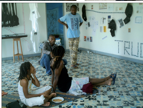
Ph. 5. De Bamako à Douala en passant par Dakar