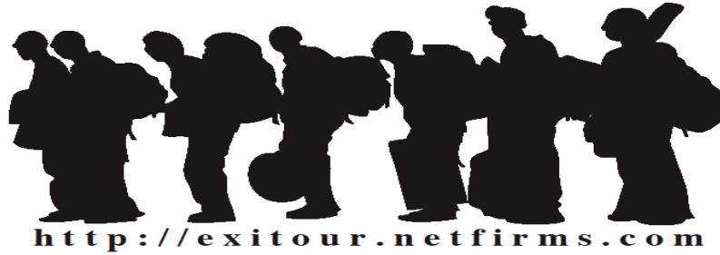
Fig. 3. Emblème/autocollant du projet Exitour