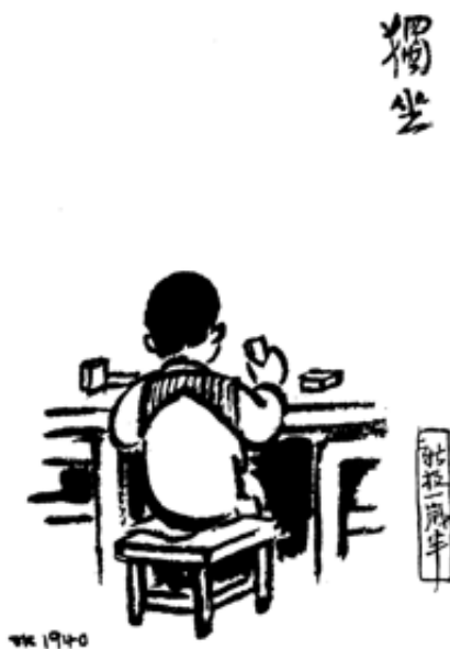
Ill. 4: Assis solitaire (1940)

La douleur est bientôt oubliée au profit d'un nouveau jeu, auquel l'enfant accorde à nouveau toute son attention. Une image intitulée Assis, solitaire (1940) rend particulièrement bien compte de cette extrême concentration qui caractérise l'enfant jouant (ill. 4). On y voit un petit garçon de dos assis sur un tabouret devant une table, occupé à manipuler des cubes. Esquissé en quelques traits, l'enfant se tient très droit, manifestant par son attitude l'intérêt extrême qu'il porte à ce jeu de construction.