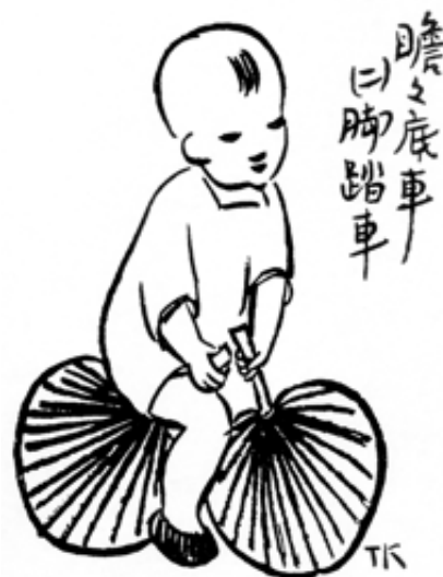
Ill. 1 : Les véhicules de Zhanzhan (2 - le vélo (1927)

De même, un tabouret peut faire office de table, de palanquin, de guichet, de bateau ou de gare ferroviaire 7 , voire se muer en personnage doué de vie auquel il faudra prêter ses propres chaussures, comme dans le dessin intitulé Ah Bao a deux pieds et le tabouret en a quatre (1927) (ill. 2). Une fillette à l'air espiègle y chausse, accroupie, les quatre pieds d'un tabouret de deux paires de chaussures neuves.