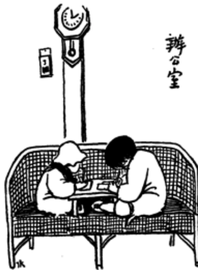
Ill. 7 : Au bureau (1927)

ments de ses jeux. Si les adultes considèrent les jouets comme peu de chose, ceux-ci sont aux enfants ce qu'est la hache au bûcheron, le boulier au commerçant, la palette au peintre, l'instrument au musicien» 10 . Selon Feng Zikai, « les jeux des enfants sont comparables aux activités des adultes. Dans la réalité, adultes et enfants souffrent pareillement : les uns par manque de travail, les autres parce qu'ils sont insatisfaits de leurs jeux» 11 . Un dessin intitulé Au bureau (1927) (ill.7) confirme ce point de vue : deux enfants sont assis sur un canapé. Ils se font face de part et d'autre d'une tablette que l'on y a posée, un crayon à la main devant des feuilles de papier. L'artiste a jugé inutile de détailler les traits des visages : les postures suffisent à montrer à quel point le plus grand est absorbé par son « travail », tandis que le cadet l'observe et tente de l'imiter.