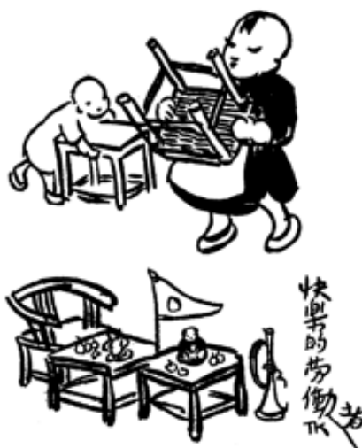
Ill. 6 : Joyeux travailleurs (1927)

Cette application peut évoquer le sérieux d'un adulte au travail, ce qui n'a pas échappé à l'artiste qui qualifie volontiers les enfants de « joyeux travailleurs ». C'est le titre d'un autre dessin (1927) (ill. 6), où deux enfants s'affairent à déplacer des sièges pour organiser une dînette. Le plus grand transporte une chaise de bambou d'un air décidé, sûr de l'endroit où il veut la poser. Le plus jeune, au second plan, pousse maladroitement son petit tabouret et lance à son aîné un regard interrogateur dans l'attente que celui-ci lui indique où le placer.