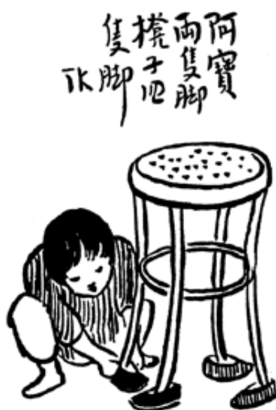
Ill. 2 : Ah Bao a deux pieds et le tabouret en a quatre (1927)

De même, un tabouret peut faire office de table, de palanquin, de guichet, de bateau ou de gare ferroviaire 7 , voire se muer en personnage doué de vie auquel il faudra prêter ses propres chaussures, comme dans le dessin intitulé Ah Bao a deux pieds et le tabouret en a quatre (1927) (ill. 2). Une fillette à l'air espiègle y chausse, accroupie, les quatre pieds d'un tabouret de deux paires de chaussures neuves.