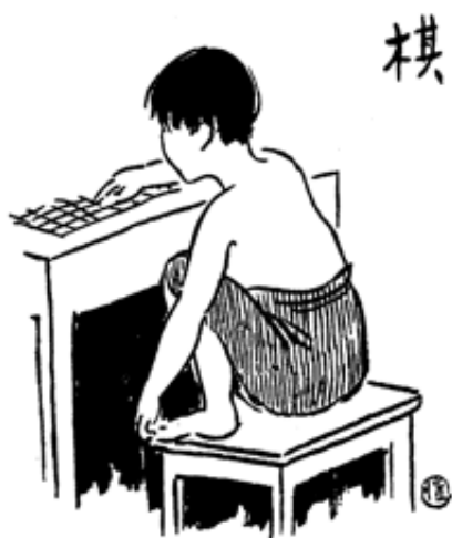
Ill. 5 : Les échecs (1927)

Dans Les échecs (1932) (ill. 5), un jeune garçon est, une fois de plus, campé dans une pose qui dénote la ferveur avec laquelle il s'implique dans le jeu, légèrement penché sur un damier, un pion dans une main, le pied qu'il a posé sur le siège dans l'autre.