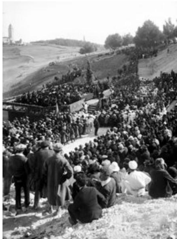
Fondation de l'université hébraïque de Jérusalem sur le Mont Scopus en 1925