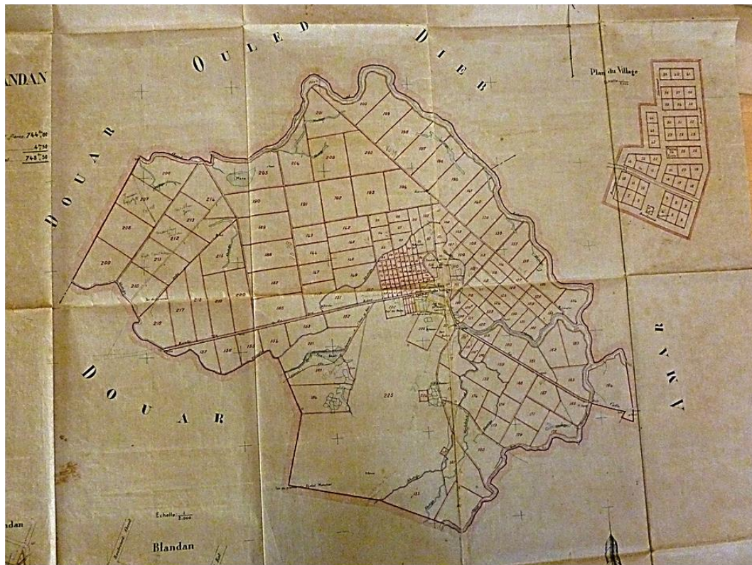
Document 3 : plan du centre de colonisation de Blandan

Au début des années Vingt, cet espace dédié aux logements des colons constitue le dernier rempart d'une présence française largement amoindrie par les départs vers la Tunisie voisine.