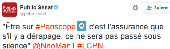
Figure 2 : extrait de l'interview sur la chaîne Public Sénat d'un photoreporter ayant couvert les manifestations contre « la loi travail » 4 .

Dans les premiers écrits de Steve Mann sur la sousveillance à la fin des années 1990, le chercheur ne fait pas que conceptualiser l'idée de « surveiller les surveillants » et réfléchir aux implications sociétales de ce panoptique inversé, il propose aussi de nouveaux dispositifs visant à la faciliter, comme des lunettes avec caméra intégrée. L'auteur relie ce qu'il nomme donc le « réflexionnisme » à la notion de détournement de Roger (1994), soit l'ensemble des tactiques d'appropriation des outils de surveillance (caméras par exemple) et la réutilisation de ces outils de manière désorganisée. Nous pouvons alors constater qu'aujourd'hui, ces caméras sont présentes dans de nombreux outils informatiques et de communication. Si les scénarios d'usages possibles de ces outils sont nombreux, les possibilités de braconnages, de détournements, à des fins de sousveillance le sont aussi. Le projet de Mann nous apparaît comme clairement politique, au sens où il propose une forme de gouvernance de l'espace public qui s'appuierait sur la désorganisation des processus de contrôle social formel, par la multiplication des points de vue sur les actions des acteurs qui exercent au quotidien ce contrôle. A ce titre, lors des manifestations que nous citons en introduction, certains militants et journalistes ont mis en avant la nécessité de filmer les actions des forces de police afin qu'un « dérapage » ne soit « pas passé sous silence » (Figure 2).