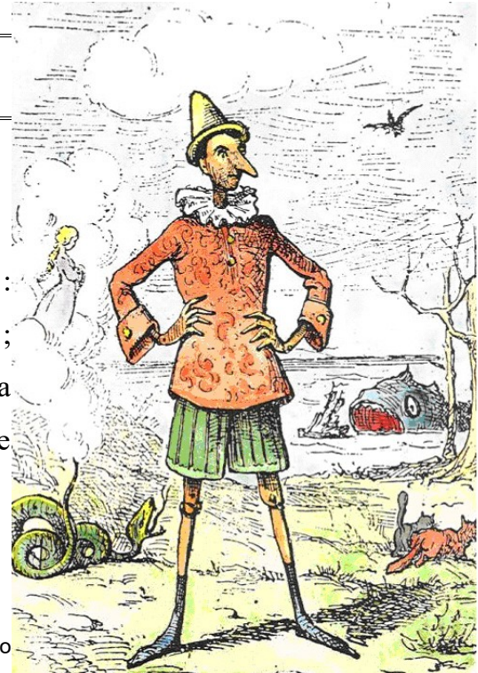
Pinocchio by Enrico

Le conte de Collodi semble multiplier les incertitudes : au pays rêvé des jouets succède le cauchemar de l'esclavage ; la Fée bleue est un personnage fantasmagorique, fantôme de la mère décédée et projection idéale du désir de mère de Pinocchio.