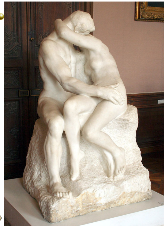
Rodin, le baiser, Musée Rodin, Paris