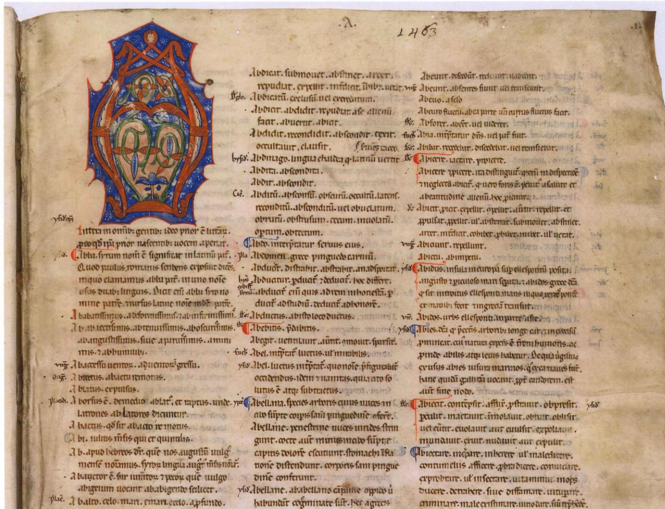
Tav. 3 Vat. lat. 1463, f. 1r (sec. XIII-XIV)