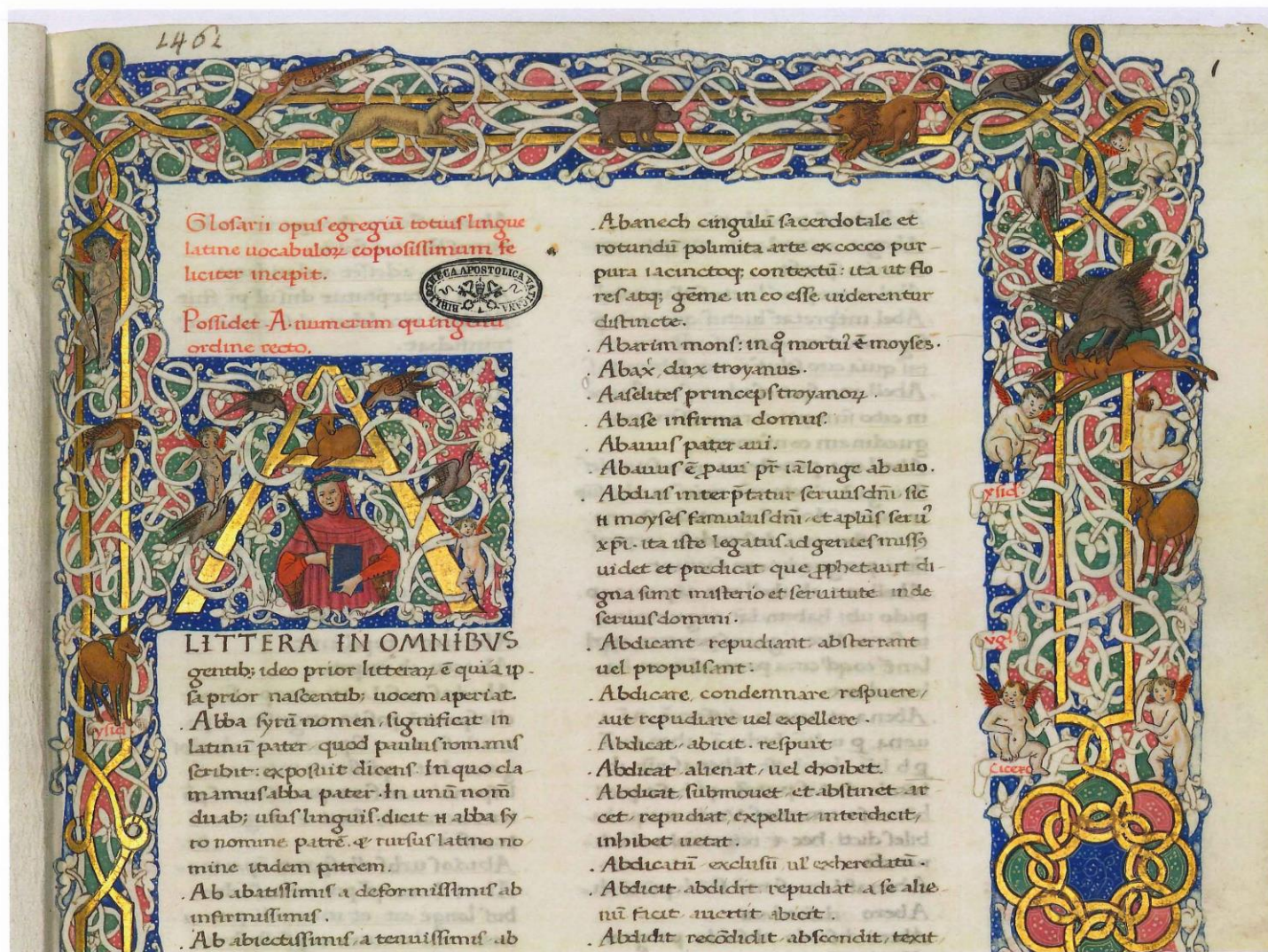
Tav. 4 - Vat. lat. 1461, f. 1r (sec. XV, circa 1470-1477)