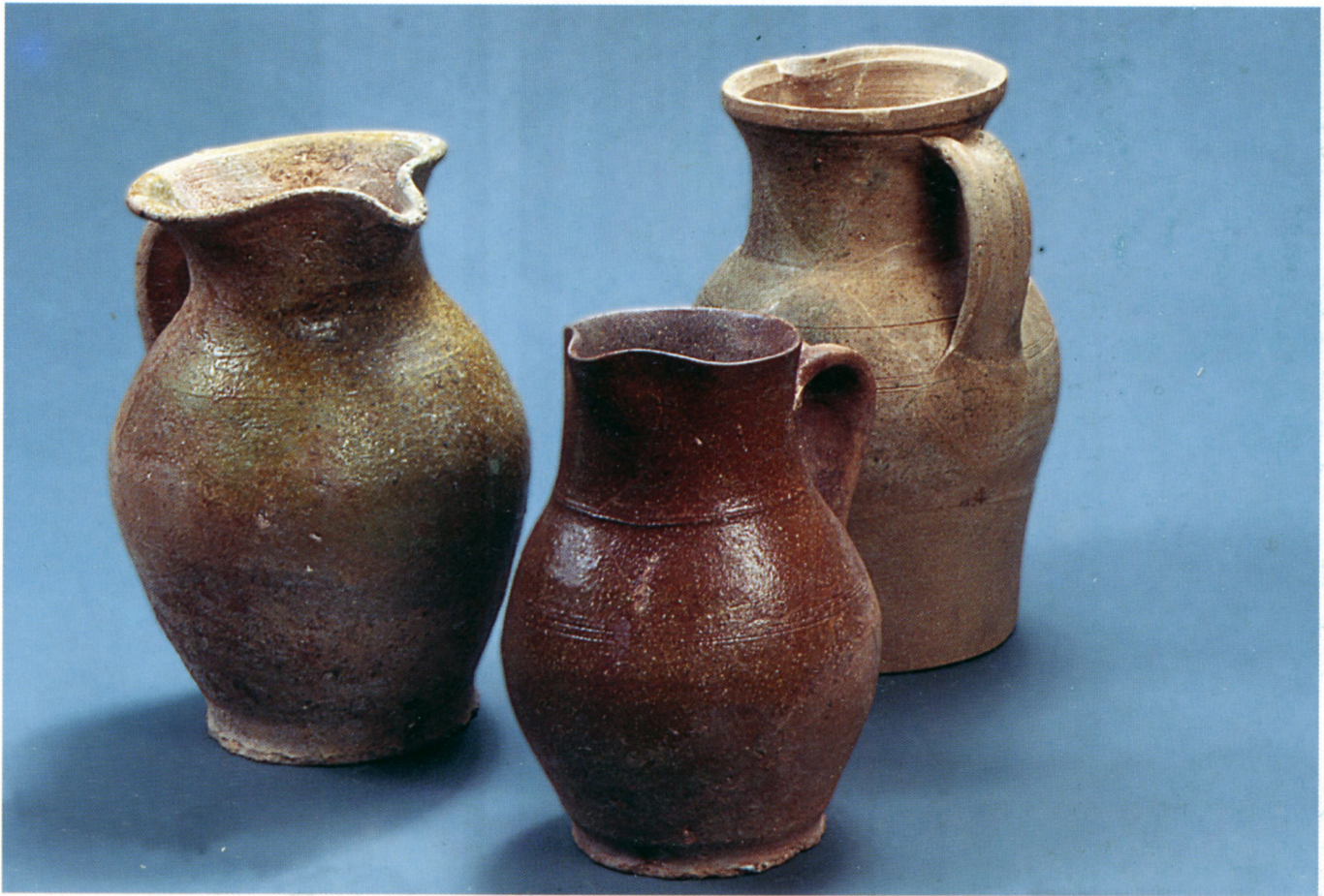
Fig. 109 : Gap, Hôtel du Département. Trois cruches glaçurées.