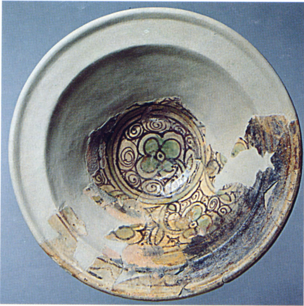
Fig. 110 Digne, quartier canonial : coupe à décor vert et brun