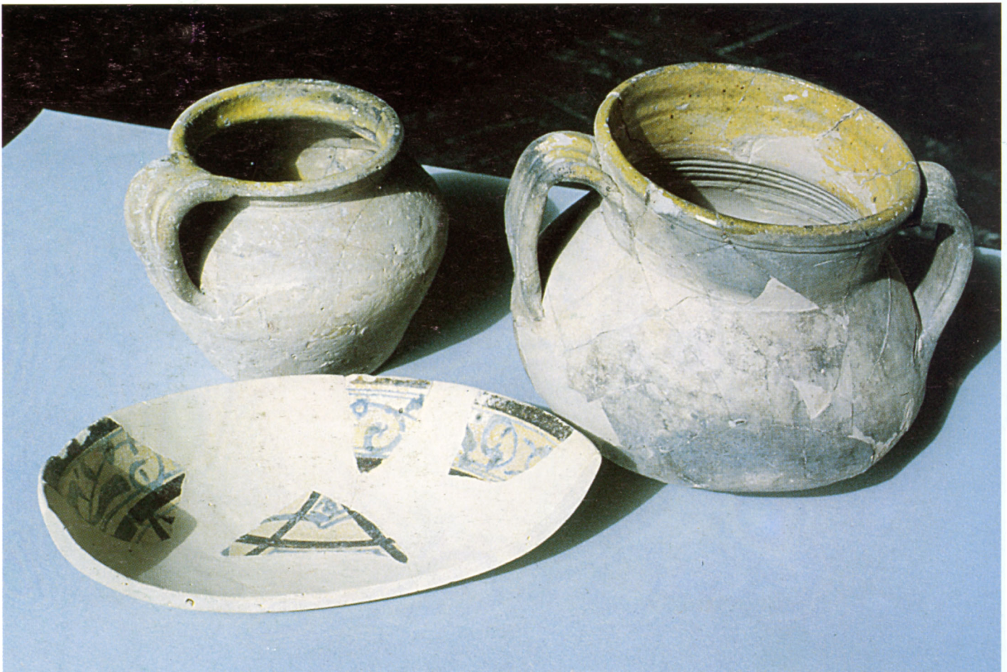
Fig. 103 Saint-Jean-de-Taravon : pégau et marmite en pâte claire glaçurée de l'Uzège, et coupe en faïence bleue et brune de Tunisie. Premier tiers du XIVe siècle.