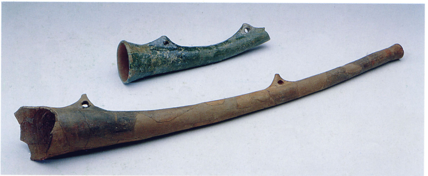
Fig. 114 : Les trompes de Faudon