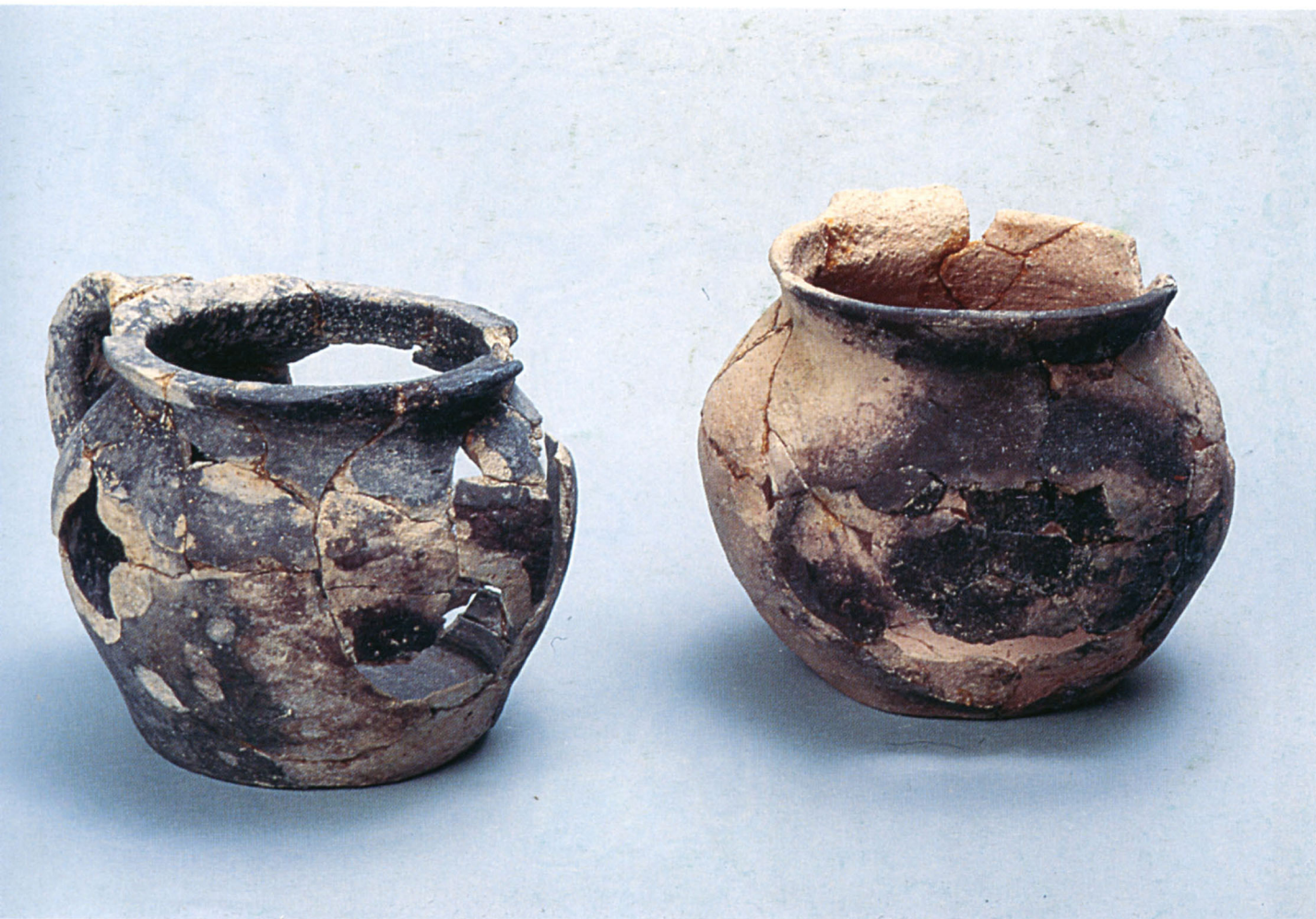
Fig. 105 Curel : pégaus brûlés à l'opposé de l'anse.