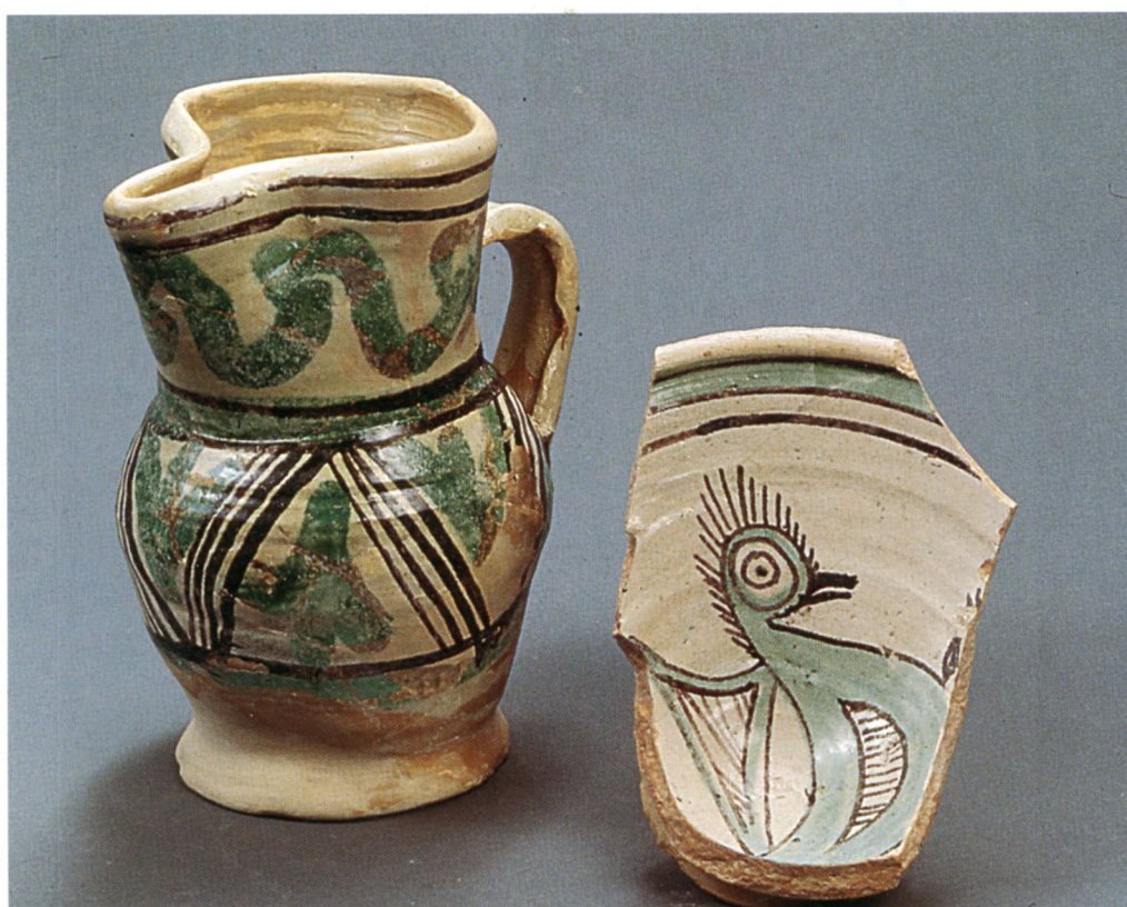
Fig. 106 Lazer : cruche et coupe à décor peint vert et brun. Faïence avignonnaise, 2e moitié du XIVe s.