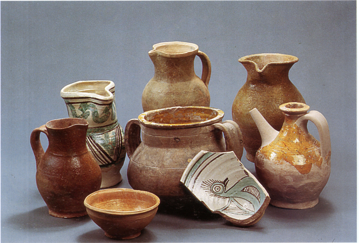
Fig. 102 : Céramiques communes glaçurées et faïences de Lazer et de Gap