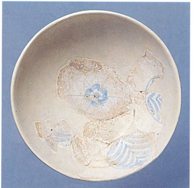
Fig. 113 Digne : coupe à décor bleu et lustré de Valence (Espagne)