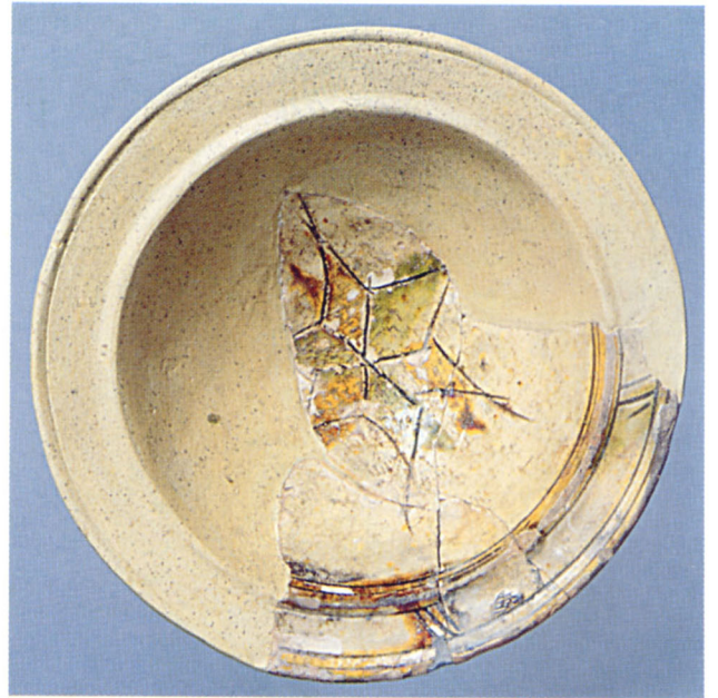
Fig. 111 Digne : coupe à sgraffito archaïque de Ligurie