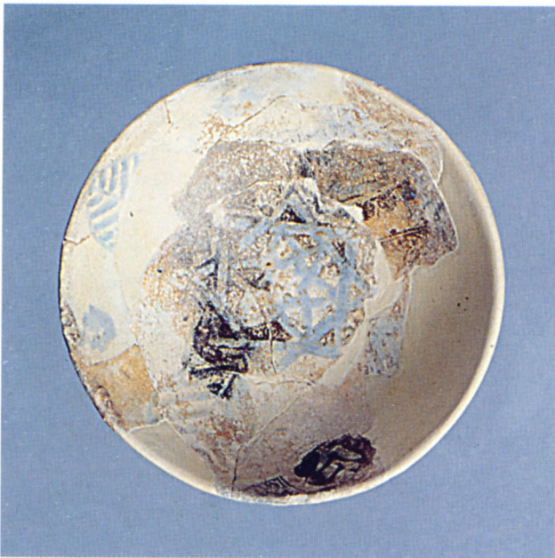
Fig. 112 Digne : coupelle à décor bleu et lustré de Valence (Espagne)