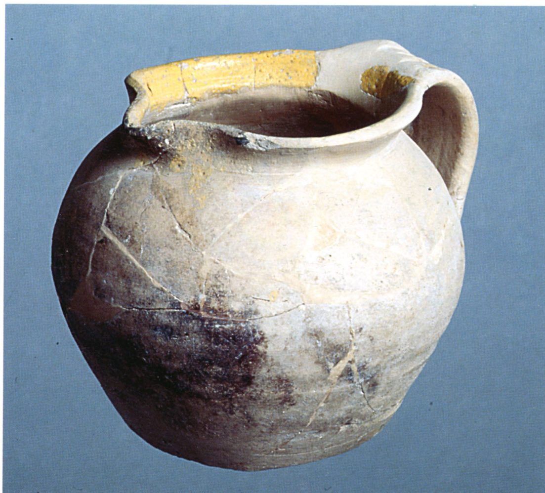
Fig. 104 : Pégau en pâte claire glaçurée ; production de l'Uzège (XIVe s.). Découvert en 1946 par M. Delmas dans une tombe de Notre-Dame-du-Bourg à Digne.