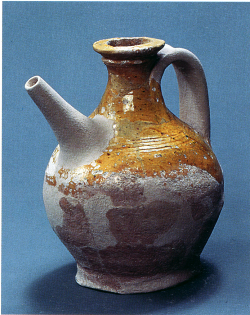
Fig. 108 Lazer : pichet en pâte claire glaçurée de l'Uzège.