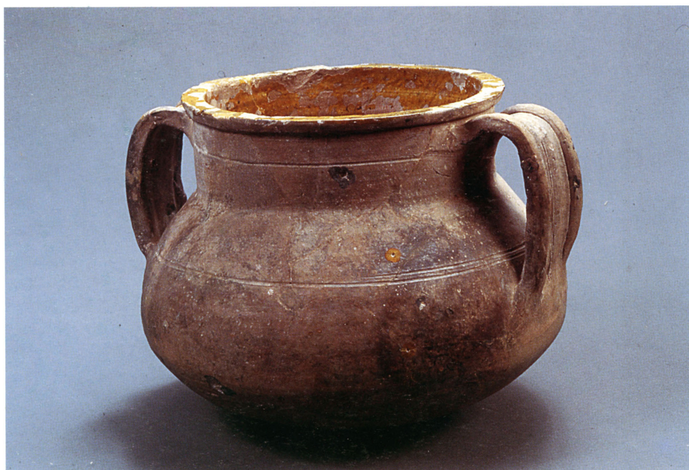
Fig. 107 Lazer : marmite en pâte claire glaçurée de l'Uzège.