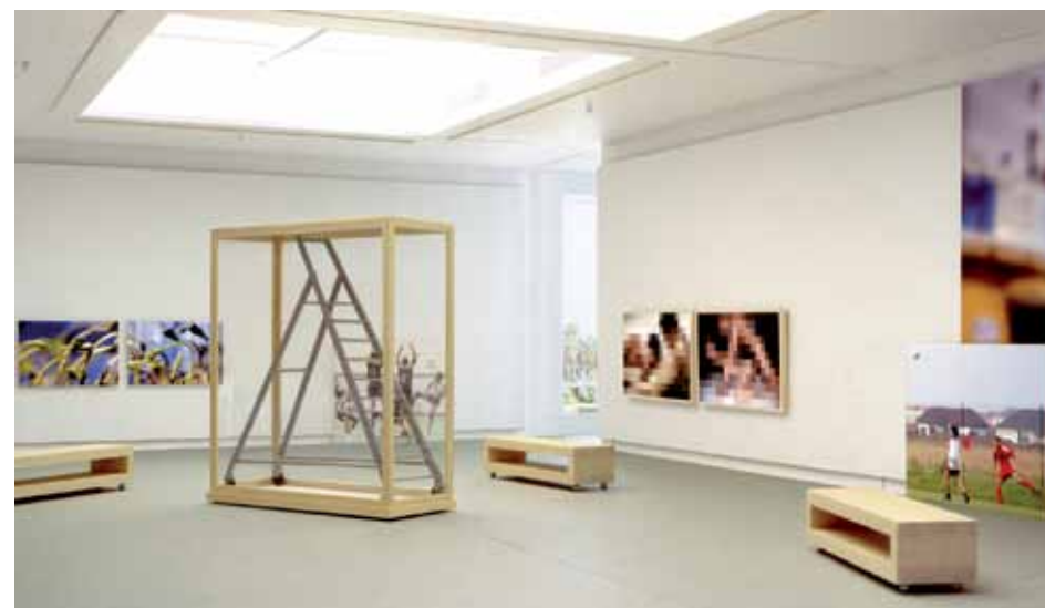
Vue de l'exposition rétrospective d'Hubert Renard «Le Bout du monde» à la fondation Rosario Almara, Pully, Suisse, 1996. De gauche à droite, au mur: Paysages , 1990; Vol (au filet) , 1995; Nuanciers - 1 et 13 , 1996; Vol (des champs) , 1995; Le Bout du monde 7 , 1996. Au sol: 3 Bancs-Mobiles , 1996 et Escamobile (version muséale) , 1996.

Pinxit – qui est finalement devenu l'unique mode d'exposition de cette activité.