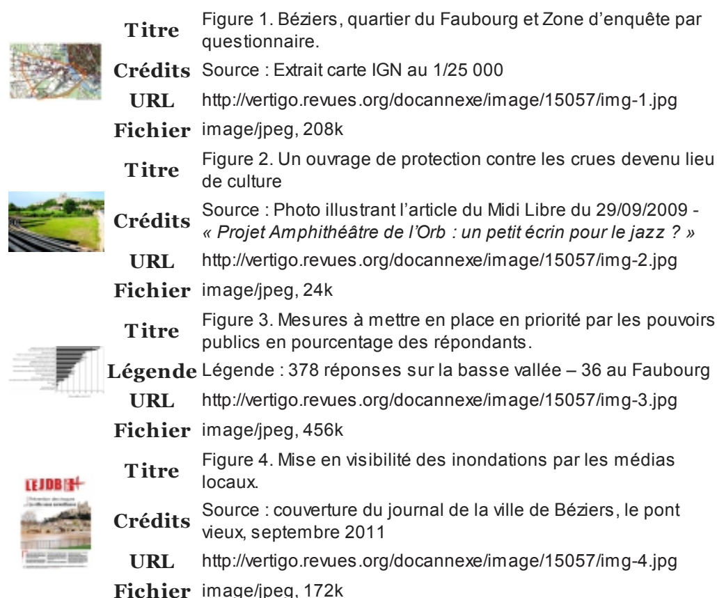
Table des illustrations

16 À l'entrée de la saison pluvieuse, mais sans qu'un évènement spécifique se soit produit.