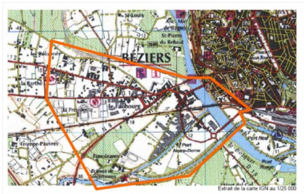
Figure 1. Béziers, quartier du Faubourg et Zone d'enquête par questionnaire.