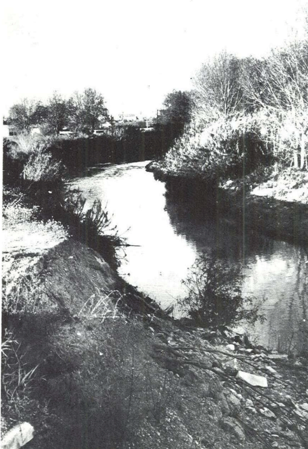
Figure 2. Photo du Lez illustrant l'article « Grand-Père Ledun, ça suffit »

Journal communal n° 9 de janvier 1980, p16.