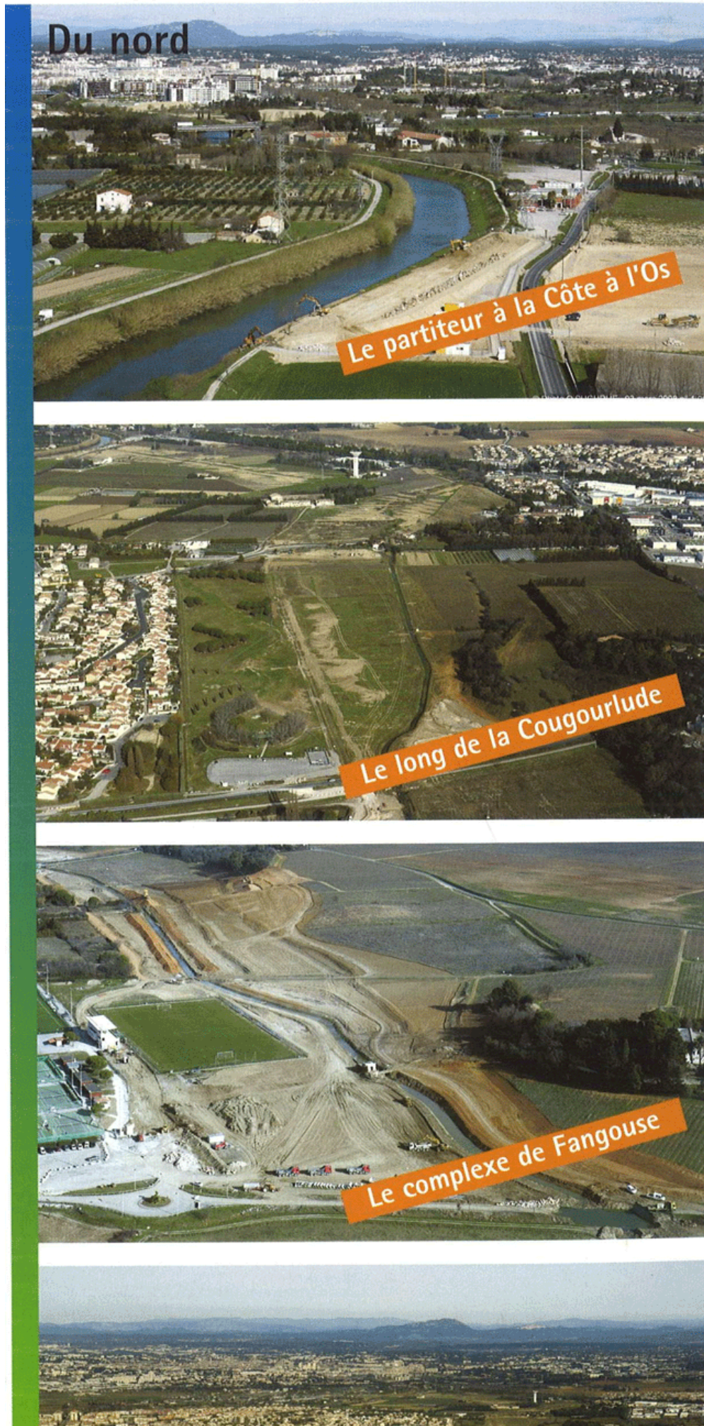
Figure 4. Photos du Lez illustrant l'article titré « Protection contre les inondations » et sous-titré « Le grand chantier vu du ciel »