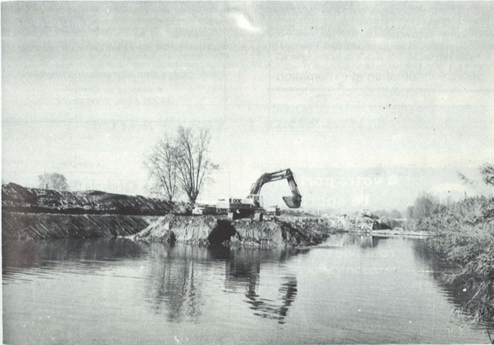
Figure 3. Photo du Lez illustrant un encadré « Travaux concernant le Lez » dans l'article « Grand-Père Ledun, ça suffit »

Journal communal n° 9 de janvier 1980, p17.