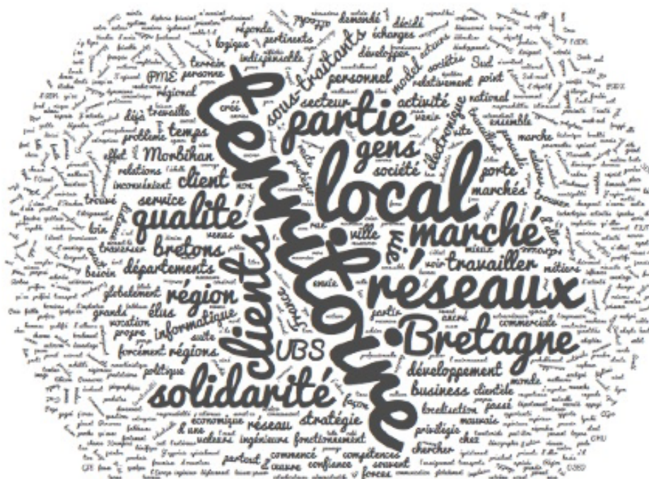
Figure 1 : Nuage de mots issus des entretiens avec les dirigeants de PME

D'une manière générale, l'enquête a consisté à interroger les chefs d'entreprise en face-à-face autour d'un questionnaire portant principalement sur i) leur insertion dans les réseaux et ii) leur lien avec le territoire d'implantation de leur entreprise et ses acteurs. Ces entretiens semi-directifs approfondis ont permis d'appréhender le rôle des réseaux structurés pour l'entreprise et son dirigeant. Il a été demandé aux interviewés de décrire la nature de leur implication dans ces réseaux afin de comprendre les raisons qui les amenaient à y investir du temps et parfois de l'argent sous forme de cotisation. Ces déclarations ont permis de procéder à une analyse thématique qui a mis en évidence la dimension solidaire des réseaux (cf. figure 1).