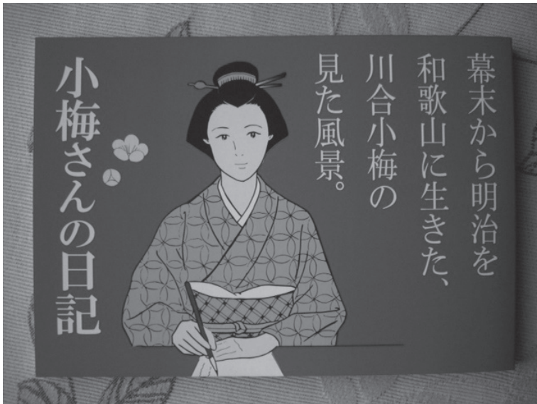
Fig. 8 – Le journal de Koume