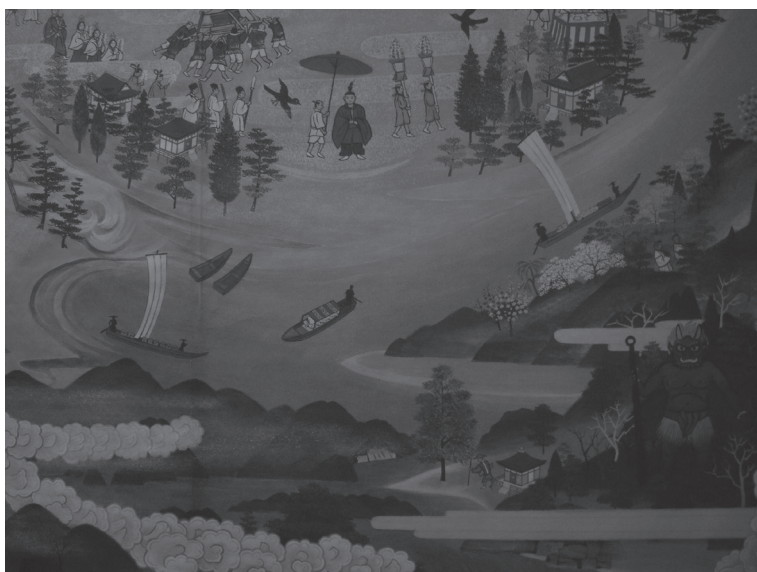
Fig. 2 – Détail d'une reproduction de mandala du pèlerinage à Nachi