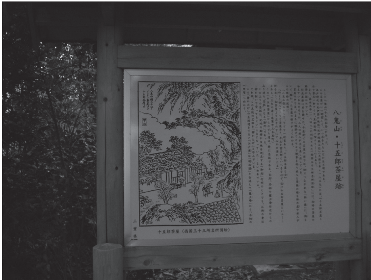
Fig. 3 – Estampe: Yakiyama. Les ruines de la maison de thé de Jūgorō