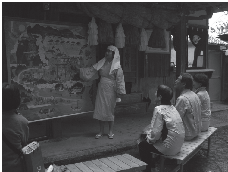
Fig. 1 – Explication par l'image ( etoki ) de mandala du pèlerinage à Nachi