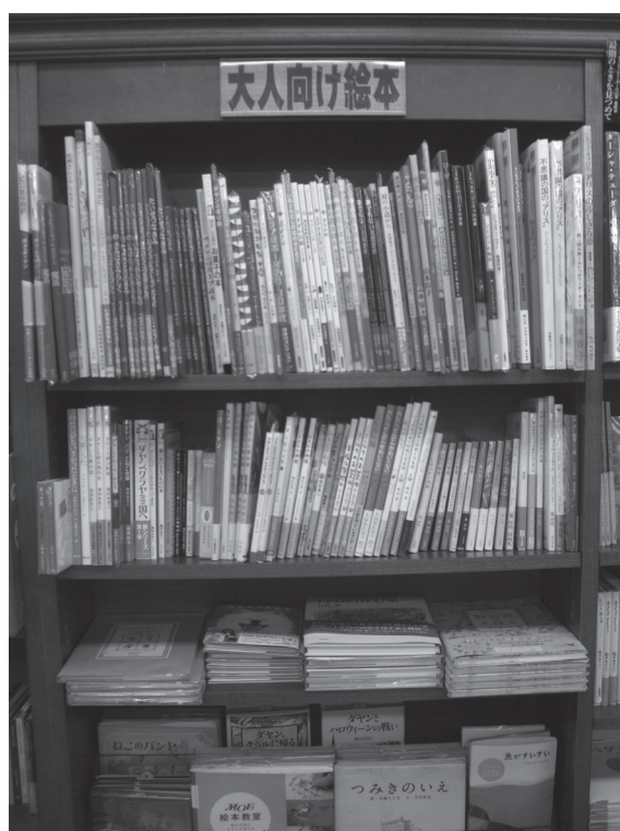
Fig. 6 – Rayons d'albums pour adultes, Kyoto