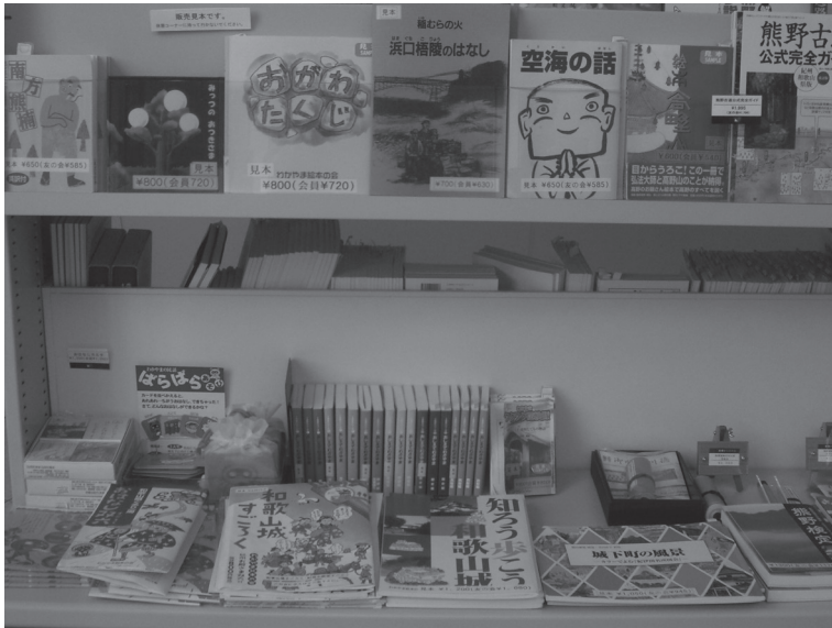
Fig. 7 – Rayons d’ouvrages de l’Association des albums de Wakayama